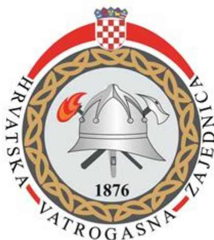
Slika 1. Grb Hrvatske vatrogasne zajednice [3]

U razdoblju Domovinskog rata (1991. – 1995.) vatrogasna organizacija je, kao i ostala udruženja i organizacije na području Hrvatske, primila teške udarce i prolazila kroz iznimno teško razdoblje. Velik broj članova vatrogasnih organizacija izgubilo je život, uništena je i otuđena oprema, uništeni i razoreni vatrogasni domovi i spremišta. Ime "Hrvatska vatrogasna zajednica" vraćeno je 1993. godine, a po završetku rata počela je obnova vatrogastva. Na slici 1. prikazan je grb Hrvatske vatrogasne zajednice. [2]