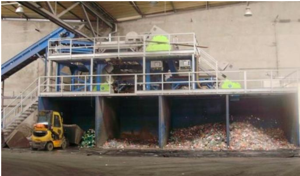
Slika 3. Sortirnica tvrtke Drava International [12]

Sortirnica prikazana na slici 2. funkcionira tako da sortira plastične boce prema boji, čime se sortira 98% plastične ambalaže u prvoj fazi, a veliki postotak efikasnosti govori i o kvaliteti, a postoje i senzori koji se koriste za eliminaciju neprihvatljivih vrsta plastike te trake za odvajanje naljepnica s boca. [13] Dio PET flekica koristi se za proizvodnju PET folije, dok se manji dio PET flekica zajedno s HD-PE granulama koristi dalje za proizvodnju PET pretformi i čepova koji se dobivaju postupkom brizganja. Brizganjem se dobije određena pretforma iz koje se daljnjim zagrijavanjem i puhanjem dobiva određeni oblik i volumen boce.[11]