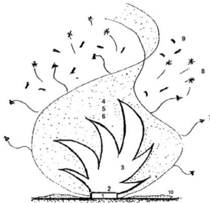
Slika 1. Svojstva požara [4]

Pri gorenju stvaraju se produkti gorenja, kao što su toplina, plamen, dim, čađa, pare, iskre, plinovi, pepeo, ugarci, žar i dr. Svaki od ovih produkti ima štetan utjecaj na okoliš. Na sljedećoj slici prikazana su svojstva požara (slika 1.).