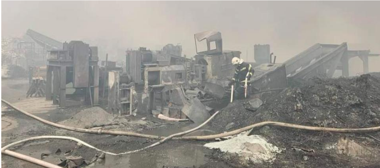
Slika 6. Izgled mjesta događaja nakon što je požar ugašen [15]

su posljedica požara. Požar je ugašen 13. listopada u 13:49 sati, a stanje na mjestu događaja prikazano je na sljedećoj slici (slika 6.).