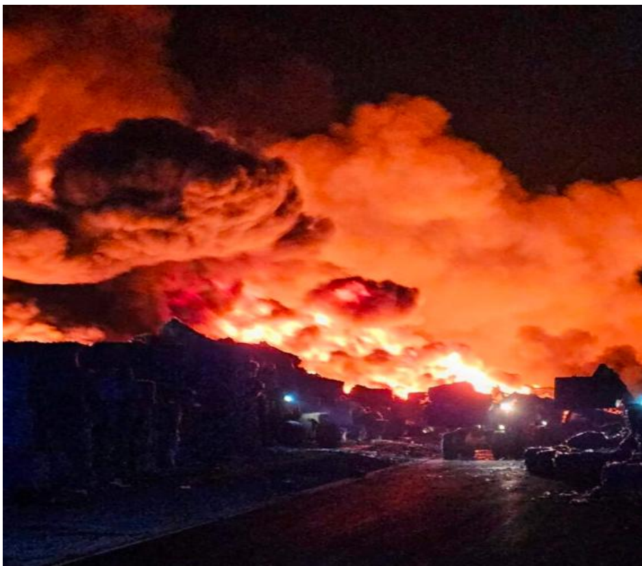
Slika 4. Požar u tvrtki Drava International [15]

U tvrtki Drava International u Brijestu na području Osijeka izbio je požar malo nakon ponoći 4. listopada 2023. godine. Na mjestu gdje je nastao požar obavljaju se djelatnosti povezane sa skladištenjem i preradom plastične otpadne ambalaže. Požarom je zahvaćeno veliko područje, odnosno požar je zahvatio veliku količinu otpada na otvorenom prostoru, krovšte i jedan pogon unutar objekta. Požar velikog razmjera zahtijevao je angažman velikog broja vatrogasaca i vozila kako bi se što prije zaustavilo njegovo širenje, odnosno kako bi se požar ugasio. Na sljedećoj slici prikazano je gašenje požara (slika 4.).