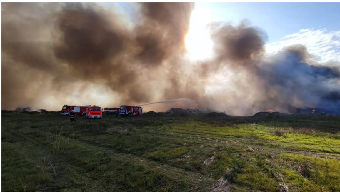
Slika 5. Gašenje požara u tvrtki Drava International [15]

Na slici 4. prikazano je stanje požara u noći 4. listopada 2023. godine kada je u gašenju sudjelovalo oko 200 vatrogasaca sa 100 vozila iz 44 vatrogasne postrojbe. Zbog veličine požara u Vatrogasnom društvu Osječko-baranjske županije stigli su u pomoć i vatrogasne postrojbe iz Vukovarsko-srijemske županije s cisternama. Glavni cilj je osigurati dovoljne količine vode stoga su cisterne visokih kapaciteta bile prioritet, a gasio se požar koji je zahvatio oko 10 hektara plastike. Pravovremeno sprečavanje širenja požara bilo je ključno u ranoj fazi gašenja. Iako su pokušali svim snagama spasiti objekt od požara, ipak nisu uspjeli, no na vrijeme izvukli iz objekta veliku količinu zapaljivih tvari i tekućina zbog kojih se požar mogao još više proširiti, ali i ostaviti još teže posljedice na onečišćenje u zraku, te se time spriječila moguća eksplozija koja bi zasigurno još više otežala posao vatrogascima. Požar je stavljen pod kontrolu tek u srijedu navečer, a u četvrtak ujutro počinje zatrpavanje zemljom. Na sljedećoj slici prikazano je mjesto događaja kada je požar stavljen pod kontrolu (slika 5).