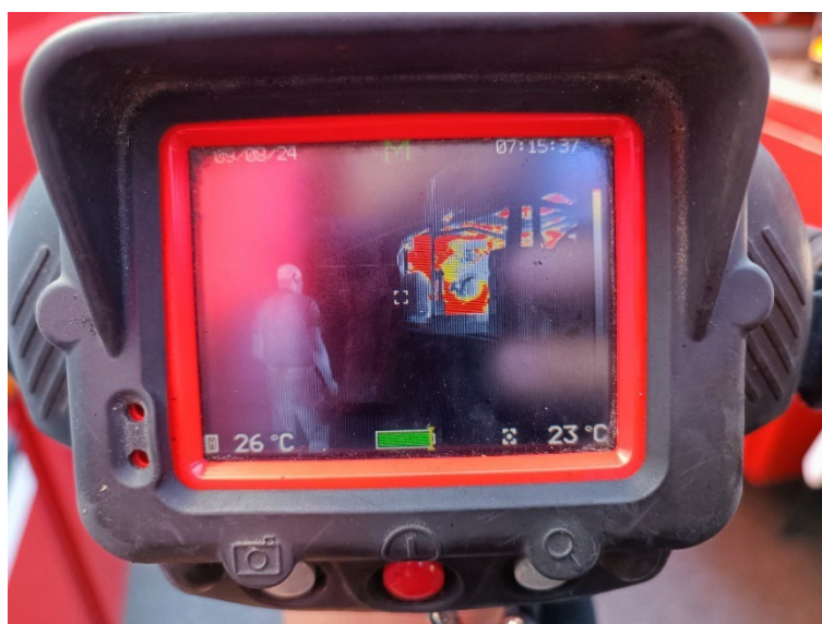
Slika 7. Termalna kamera [6]

Termalnom kamerom se pretražuje prostorija ako ima unesrećenih osoba koje se ne vide od dima ili u nastalim ruševinama. Također termalnom kamerom se može tražiti izvor topline pri nastanku gustoga dima ili se može pratiti temperatura požara dimnjaka.