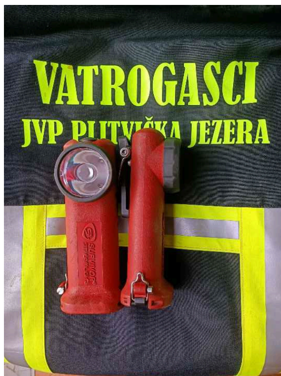
Slika 19. Baterijske lampe [6]

Prijenosna baterijska lampa proizvođača streamlight. Ovaj model je jedan od najčešće upotrebljivanih i najpouzdanijih modela svjetiljke kod vatrogasaca. Namijenjena je za nošenje na vatrogasnoj jakni. Kvaliteta ovih baterija omogućava vatrogascima siguran rad. Baterija ima tri načina svjetljenja, titrajući odnosno bljesak za signalizaciju, nisku svjetlost i visoku svjetlost. Visoka svjetlost ima najjači snop svjetlosti, preko 450 m, ali duljina trajanja svjetljenja je kraća u odnosu na nisku svjetlost i bljesak za signalizaciju. Velika prednost ovih baterija je što se pune na 220 V i što se mogu puniti auto punjačima 12V.