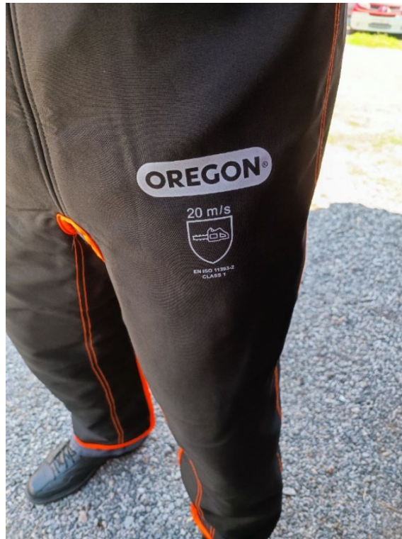
Slika 25. Zaštitne hlače [6]

Zaštitne hlače upotrebljavaju se pri radu s motornom pilom. Pružaju sigurnost, smanjuju moguće opasnosti koje bi mogle nastati. Njihova najveća uloga je sprječavanje posjekotine koje može nastati od lanca koji se nalazi na vodilici pile.