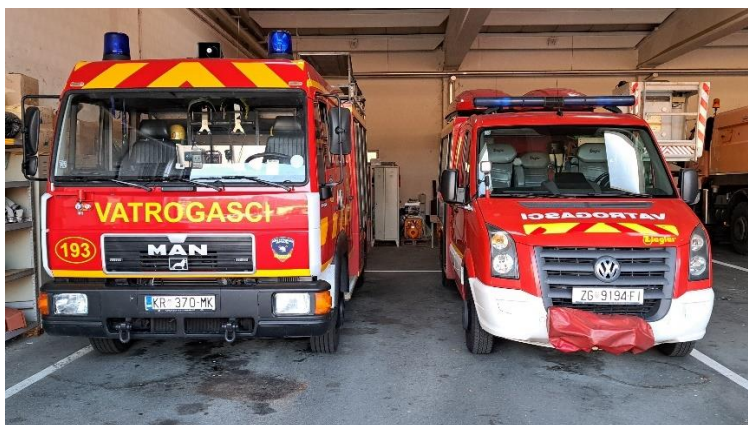
Slika 4. Navalno vozilo (lijevo) i tehničko vozilo (desno) Tim-a 2 [11]

Tim 2 je drugi vatrogasni tim vatrogasne postrojbe EROC. Sastoji se od dva vatrogasca od kojeg jedan mora biti operativni djelatnik JVP Krapina koji ima polozeni stručni ispit za vatrogasce s posebnim ovlastima i odgovornostima, važeću vozačku dozvolu C kategorije te je on ujedno vozač i voditelj Tim-a 2, a drugi član je vatrogasac portir iz tvrtke EROC d.o.o. koji mora imati polozeni ispit za vatrogasca, važeću liječničku potvrdu te polozeni ispit za rad s zaštitnim napravama za disanje. Tim 2 se nalazi u stalnom dežurstvu u bazi COKP-a Krapina. Dežurstvo se obavlja s dva vatrogasna vozila (Slika 4), od kojih je jedno navalno vozilo, a drugo je malo tehničko vozilo. Vozila su smještena u garaži COKP-a Krapina. Tim 2 djeluje na području autoceste od čvora Začretje do čvora Trakošćan u oba smjera te od čvora Začretje do čvora Zabok u smjeru 2 (Zagreb). Uzbunjivanje Tim-a 2 vrši kontrolor prometa uključivanjem sirene za uzbunu ili preko mobilnog uređaja. Kada se uzbunjivanje vrši uključivanjem sirene za uzbunu, Tim 2 uvijek izlazi s navalnim vozilom.