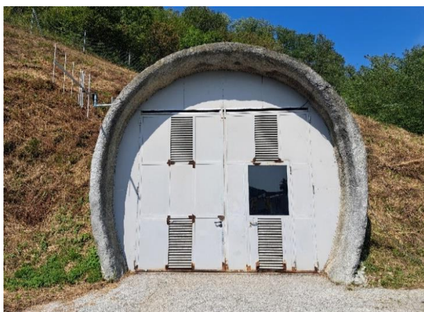
Slika 9. Ulaz u servisnu cijev tunela Sv. tri Kralja [11]

Servisna cijev tunela Sv. tri Kralja je dodatna cijev u kojoj nema konstantnog prometa. Dužine je oko 2 / 3 glavne cijevi i dovoljne širine za prometovanje jednog vozila. Povezana je sa glavnom cijevi preko 5 prolaza koji su dovoljne veličine ne samo za pješake već i za vozila. Servisna cijev se najčešće koristi za dolazak hitnih službi u tunel preko jednog od 5 prolaza ukoliko dolazak po glavnoj cijevi nije moguć te u slučaju da je potrebno izvršiti evakuaciju ljudi i po potrebi vozila, a evakuacija po glavnoj cijevi nije moguća. U servisnoj cijevi od opreme se nalaze senzori na prolazima i na glavnom ulazu koji alarmiraju kontrolnom centru svako otvaranje vrata. Po cijeloj dužini servisne cijevi instalirana je svjetlosna signalizacija koja označava put prema glavnom ulazu (Slike 9. i 10.).