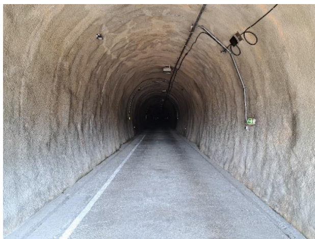
Slika 10. Unutrašnjost servisne cijevi tunela Sv. tri Kralja [11]