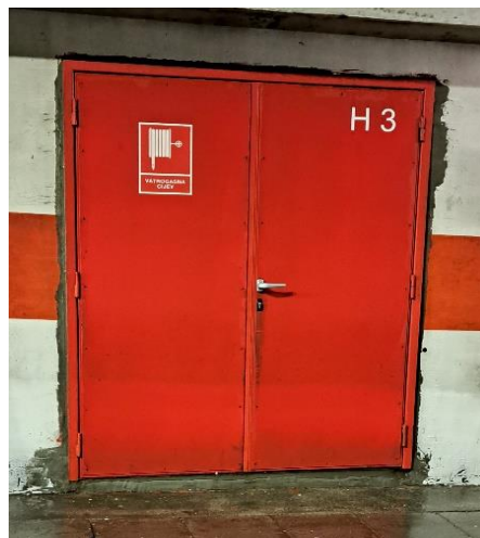
Slika 7. Hidrantska niša u tunelu Sv. tri Kralja [11]

U tunelu je ugrađen sustav radio difuzije uz prijenos HR2 (98,5 MHz) te sustav razglasa kojima se u slučaju događaja koji je različit od normalnog prometa puštaju poruke upozorenja. U tunelu postoji 14 hidrantskih niši kroz koje prolazi mokra hidrantska mreža te se u tim hidrantskim nišama (Slika 7) nalazi osnovna vatrogasna oprema (Slika 8) za gašenje požara kao što su: cijevi, pjeno, međumješalica, ključevi, mlaznice, prijelaznice, izlazi hidrantske mreže i vatrogasni aparati za gašenje požara.