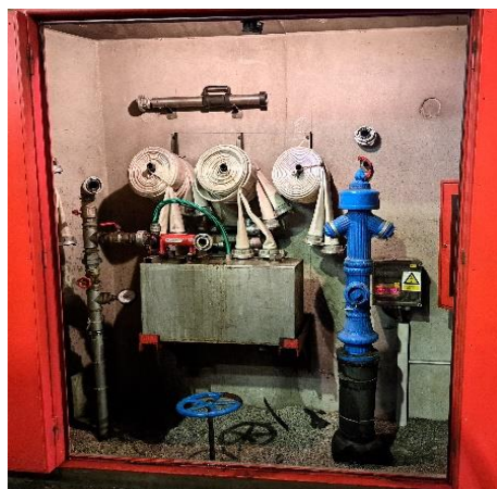
Slika 8. Oprema u hidrantskoj niši u tunelu Sv. tri Kralja [11]