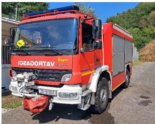
Slika 2. Navalno vozilo Tim-a 1 [11]

Tim 1 je prvi vatrogasni tim vatrogasne postrojbe EROC. Sastoji se od tri vatrogasca od kojih jedan mora biti operativni djelatnik JVP Krapina koji ima polozeni stručni ispit za vatrogasce s posebnim ovlastima i odgovornostima, važeću vozačku dozvolu C kategorije te je on ujedno vozač navalnog vozila i voditelj Tim-a 1, dok ostali članovi mogu biti i dobrovoljni vatrogasci koji imaju polozeni ispit za vatrogasca, važeću liječničku potvrdu te polozeni ispit za rad s zaštitnim napravama za disanje, s time da vatrogasac vozač autocisterne mora imati i važeću vozačku dozvolu C kategorije. Tim 1 se nalazi u stalnom dežurstvu kod južnog portala tunela Sv. tri Kralja. Dežurstvo se obavlja s dva vatrogasna vozila, od kojih je jedno navalno vozilo (Slika 2) koje je opremljeno za gašenje u tunelu, tzv. tunelsko vozilo, a drugo vozilo je autocisterna (Slika 3). Vozila su smještena na otvorenom, a u slučaju temperatura ispod 0°C, vozila se smještaju u servisnu cijev tunela Sv. tri Kralja. Tim 1 djeluje na području od južnog portala Sv. tri Kralja pa do čvora Đurmanec. Uzbunjivanje Tim-a 1 vrši kontrolor prometa pomoću mobilnog telefona.