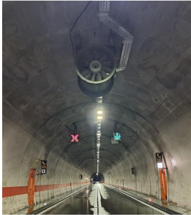
Slika 11. Ventilator u tunelu Brezovica [11]

U dijelu od južnog portala tunela Sv. tri Kralja pa sve do čvora Đurmanec postavljene su vibrirajuće trake kako bi se na taj način dodatno upozorilo vozače na zabranju pretjecanja. Dva SOS telefona se nalaze na južnom i sjevernom ulazu, dok se jedan nalazi na sredini tunela.