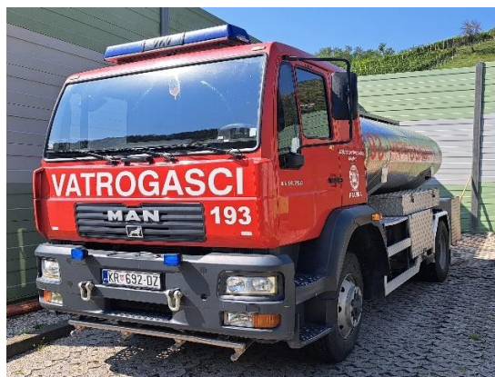
Slika 3. Autocisterna Tim-a 1 [11]

Tim 2 je drugi vatrogasni tim vatrogasne postrojbe EROC. Sastoji se od dva vatrogasca od kojeg jedan mora biti operativni djelatnik JVP Krapina koji ima polozeni stručni ispit za vatrogasce s posebnim ovlastima i odgovornostima, važeću vozačku dozvolu C kategorije te je on ujedno vozač i voditelj Tim-a 2, a drugi član je vatrogasac portir iz tvrtke EROC d.o.o. koji mora imati polozeni ispit za vatrogasca, važeću liječničku potvrdu te polozeni ispit za rad s zaštitnim napravama za disanje. Tim 2 se nalazi u stalnom dežurstvu u bazi COKP-a Krapina. Dežurstvo se obavlja s dva vatrogasna vozila (Slika 4), od kojih je jedno navalno vozilo, a drugo je malo tehničko vozilo. Vozila su smještena u garaži COKP-a Krapina. Tim 2 djeluje na području autoceste od čvora Začretje do čvora Trakošćan u oba smjera te od čvora Začretje do čvora Zabok u smjeru 2 (Zagreb). Uzbunjivanje Tim-a 2 vrši kontrolor prometa uključivanjem sirene za uzbunu ili preko mobilnog uređaja. Kada se uzbunjivanje vrši uključivanjem sirene za uzbunu, Tim 2 uvijek izlazi s navalnim vozilom.