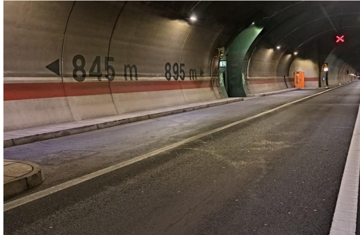
Slika 6. Ugibalište u tunelu Sv. tri Kralja u smjeru 2 (Zagreb) [11]

SOS nišama u kojima se nalaze vatrogasni aparati za početno gašenje požara i SOS telefoni kojima se korisnik spaja u razgovor sa kontrolnim centrom. Osim na ugibalištima SOS telefoni raspoređeni su po cijelom tunelu te ispred ulaza u tunel.