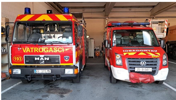
Slika 4. Navalno vozilo (lijevo) i tehničko vozilo (desno) Tim-a 2 [11]

Tim 2 je drugi vatrogasni tim vatrogasne postrojbe EROC. Sastoji se od dva vatrogasca od kojeg jedan mora biti operativni djelatnik JVP Krapina koji ima polozeni stručni ispit za vatrogasce s posebnim ovlastima i odgovornostima, važeću vozačku dozvolu C kategorije te je on ujedno vozač i voditelj Tim-a 2, a drugi član je vatrogasac portir iz tvrtke EROC d.o.o. koji mora imati polozeni ispit za vatrogasca, važeću liječničku potvrdu te polozeni ispit za rad s zaštitnim napravama za disanje. Tim 2 se nalazi u stalnom dežurstvu u bazi COKP-a Krapina. Dežurstvo se obavlja s dva vatrogasna vozila (Slika 4), od kojih je jedno navalno vozilo, a drugo je malo tehničko vozilo. Vozila su smještena u garaži COKP-a Krapina. Tim 2 djeluje na području autoceste od čvora Začretje do čvora Trakošćan u oba smjera te od čvora Začretje do čvora Zabok u smjeru 2 (Zagreb). Uzbunjivanje Tim-a 2 vrši kontrolor prometa uključivanjem sirene za uzbunu ili preko mobilnog uređaja. Kada se uzbunjivanje vrši uključivanjem sirene za uzbunu, Tim 2 uvijek izlazi s navalnim vozilom.