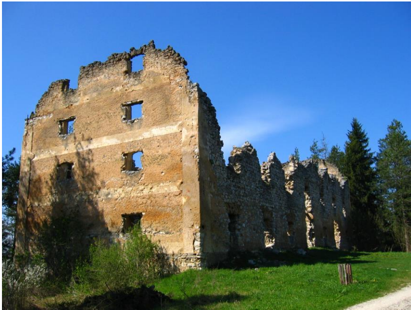
Slika 5: Napoleonov magazin i budući sportsko – rekreacijski centar