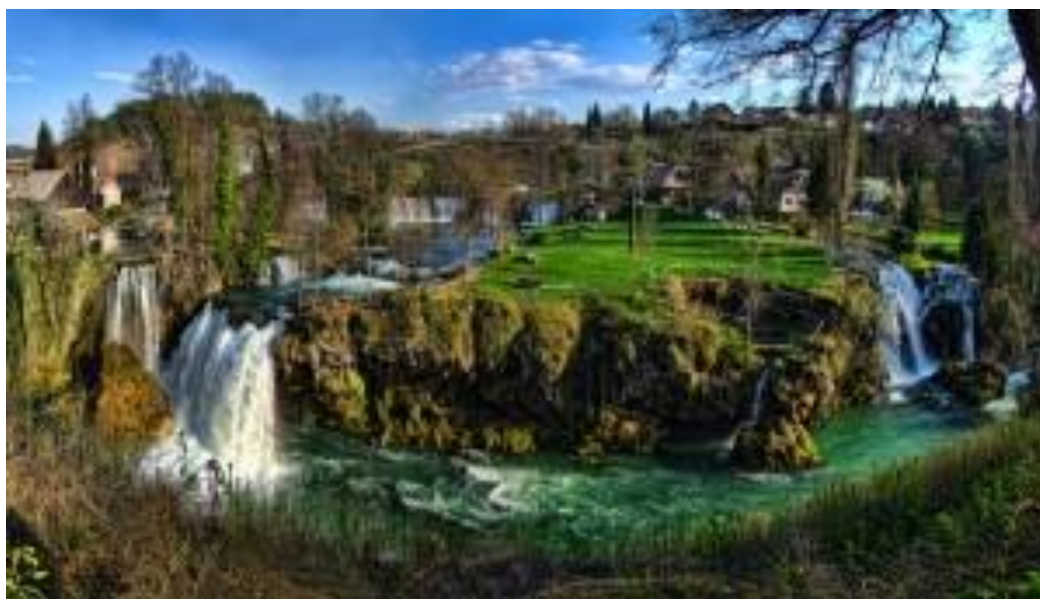
Slika 2: Rastoke