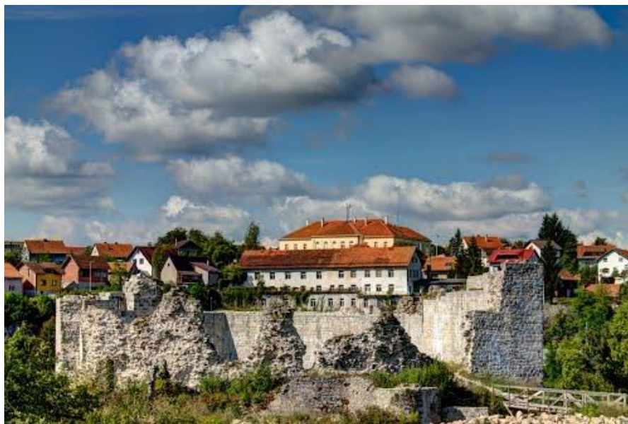
Slika 1: Stari grad Slunj