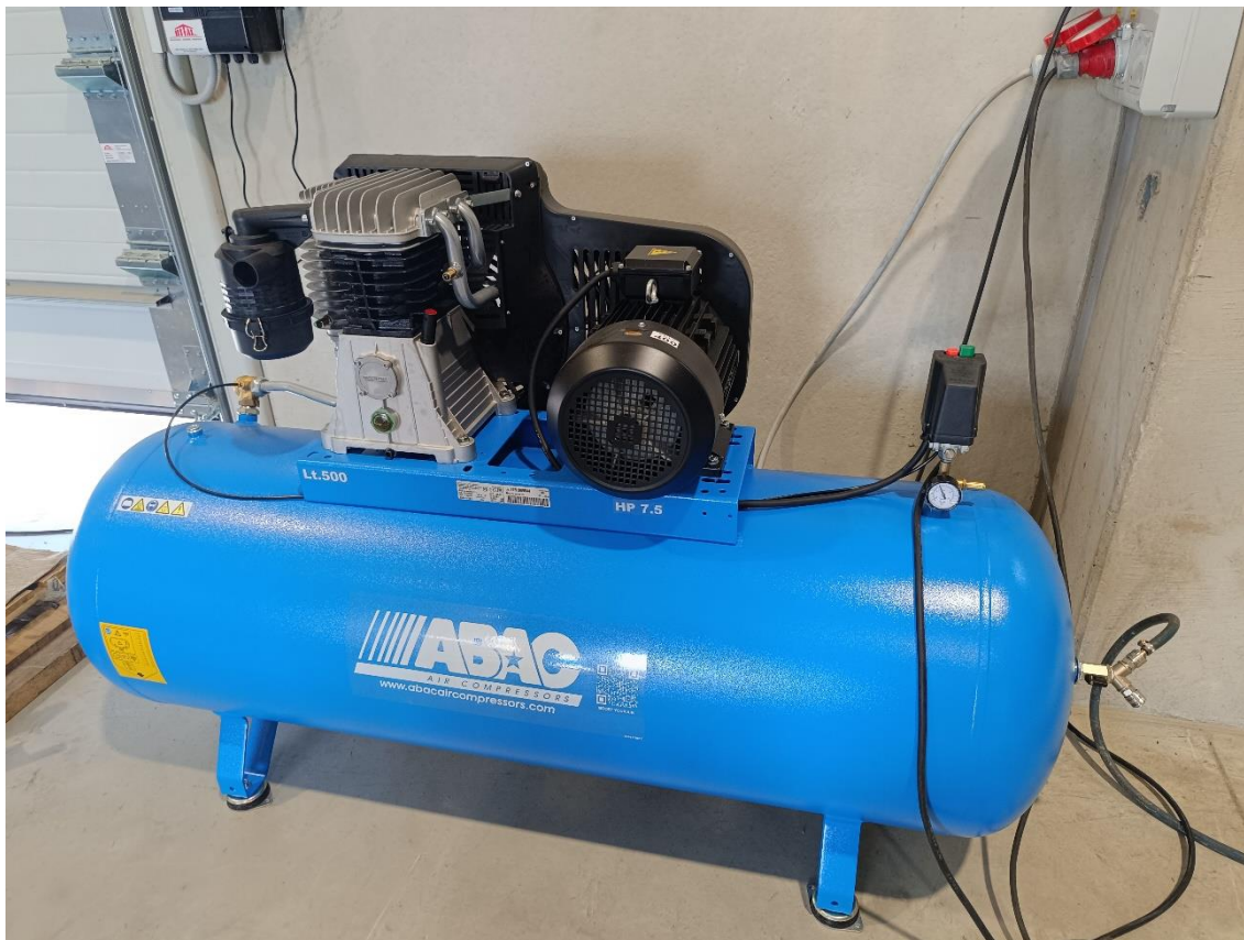
Slika 9. Klipni kompresor tvrtke "METALLIS d.o.o."

umjeravanja manometra sastavni su dio priloga zapisnika o pregledu i ispitivanju radne opreme.