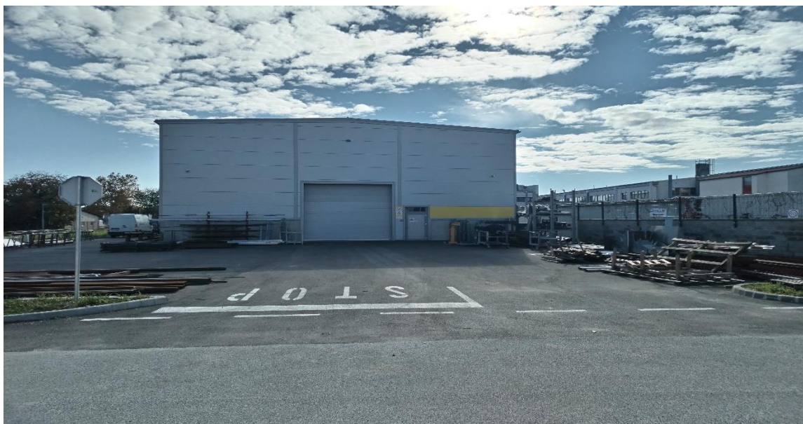
Slika 2. Proizvodna hala tvrtke "METALLIS d.o.o." u Čakovcu

Tvrtka trenutno zapošljava 38 radnika, od kojih otprilike polovica obavlja terenske poslove na različitim lokacijama privremenih radilišta. Radno vrijeme tvrtke je od 8 do 16 sati, a povremeno, zbog prirode poslova i ispunjenja rokova, radi se i prekovremeno. S obzirom da je proizvodna hala izgrađena 2023. godine ona je u jako dobrom stanju glede očuvanosti, te sve instalacije funkcioniraju besprijekorno. U proizvodnoj hali konstantno radi oko 15 radnika. Hala je prostrana, radna oprema je raspoređena tako da je radnicima omogućeno sigurno i neometano kretanje, te također sigurno manevriranje viličarom i mosnom dizalicom. Sa stražnje strane proizvodne hale omogućen je pristup teretnim vozilima te je na taj način značajno olakšan utovar i istovar materijala i metalnih elemenata za montažu.