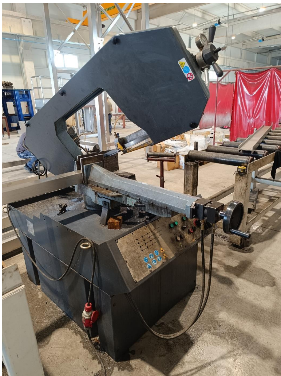
Slika 8. Tračna pila tvrtke "METALLIS d.o.o."

Tvrtka posjeduje dvije tračne pile koje se koriste svakodnevno, te se svrstavaju kao strojevi na kojima se ne može primijeniti zaštita od mehaničkih opasnosti, pa njihovi rukovatelji moraju ispunjavati, osim zdravstvenih, uvjete vezane uz stručnu osposobljenost. Tračna pila ima uzak list spojenih krajeva koji na taj način tvori beskonačnu traku zategnutu preko dva pogonska kotača od kojih jedan traku pogoni, a drugi ju napinje. Izvodi se isključivo kao stolna pila za strojno rezanje.