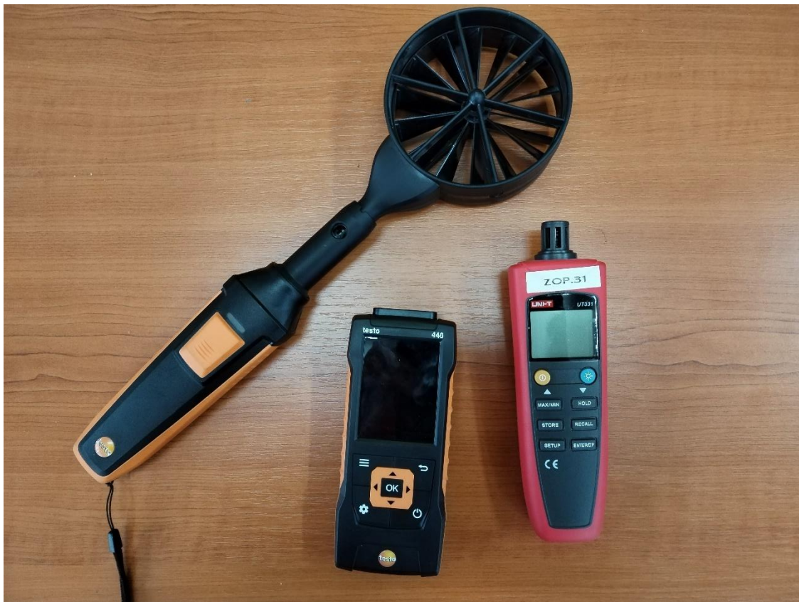
Slika 5. Anemometar TESTO i termohigrometar UNI-T korišteni za ispitivanje mikroklimatskih parametara radnog okoliša