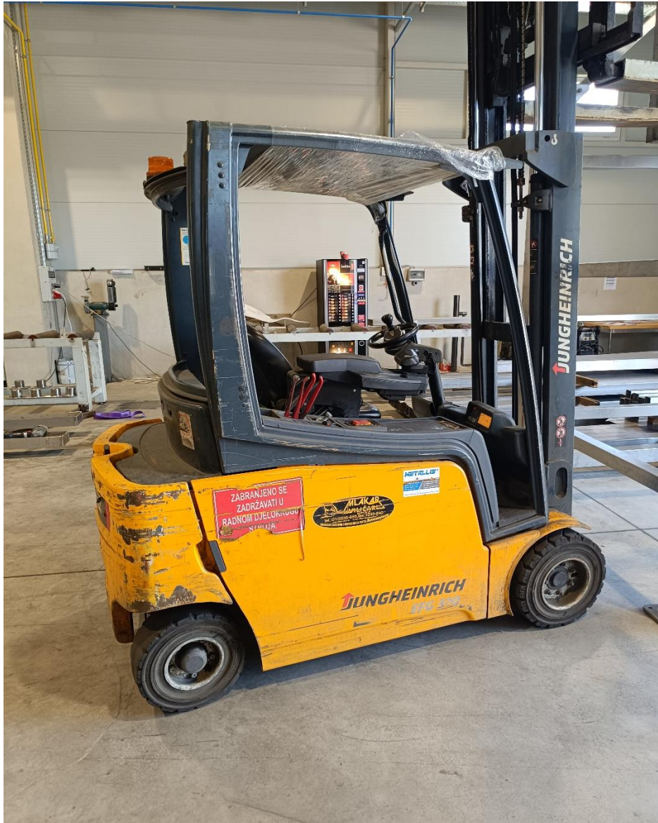
Slika 3. Električni viličar tvrtke "METALLIS d.o.o."

Mosna dizalica se koristi prilikom podizanja konstrukcija radi daljnje obrade ili prilikom prenošenja tereta u proizvodnoj hali.