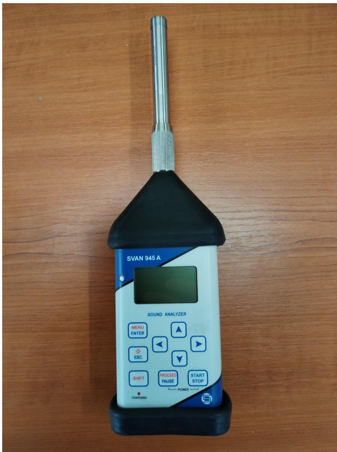
Slika 7. Zvukomjer SVANTEK

čimbenika radnog okoliša za tvrtku „METALLIS d.o.o.“ je pozitivno ocijenjen uz napomenu da se radnicima preporuča ili da su obavezni koristiti osobnu zaštitnu opremu za zaštitu sluha ovisno o mjestima na kojima rade i borave. Za ispitivanje buke korišten je zvukomjer SVANTEK, tip: 945A, sr.br. 4187.