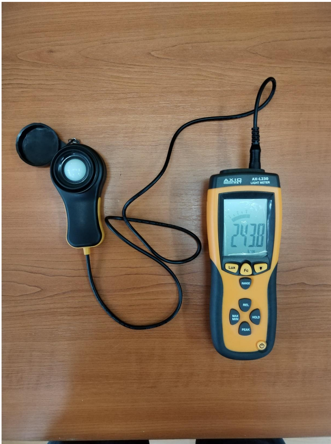
Slika 6. Luksmetar AXIO MET

Za mjerenje se koristio mjerni instrument za ispitivanje osvjetljenosti AXIO MET, tip: AX-L230, sr.br.: 151005096. Mjerna jedinica za mjerenje rasvjete je luks (lx).