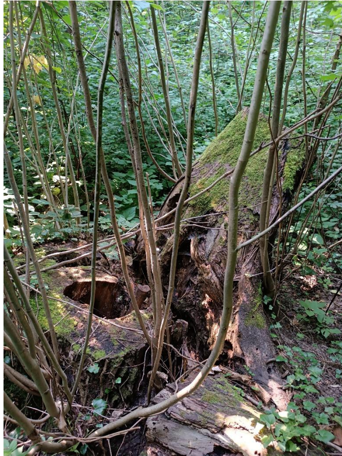
Slika br. 1 Napuknuto stojeće mrtvo drvo