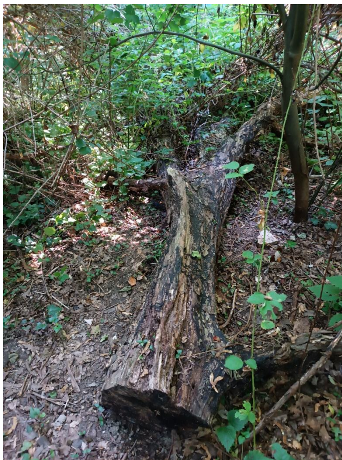
Slika br. 2 Ležeće deblo

U šumskim ekosustavima, ležeće mrtvo drvo često se koristi kao pokazatelj ekološke stabilnosti i zdravlja šume. Šume s većim količinama ležećeg mrtvog drva obično imaju veću bioraznolikost i stabilniju ekološku strukturu. U urbanim parkovima, kao što je Maksimir, prisutnost ležećeg mrtvog drva, može pomoći u održavanju ekološke ravnoteže i osigurati staništa za brojne organizme koji inače ne bi mogli preživjeti u urbaniziranim područjima.