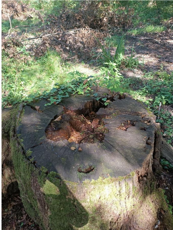
Slika br. 3 Panj

Korijenski sustavi također mogu biti važan izvor hranjivih tvari za rast novih biljaka, osobito u šumama gdje su tla siromašna hranjivim tvarima (HARTMANN i sur. 2017). Panjevi, s druge strane, često služe kao mikrostanište za različite vrste beskralješnjaka i gljiva, te mogu igrati ulogu u regeneraciji šume pružajući stanište za sjemenke koje klijaju na njihovim površinama (ANIĆ, 2004).