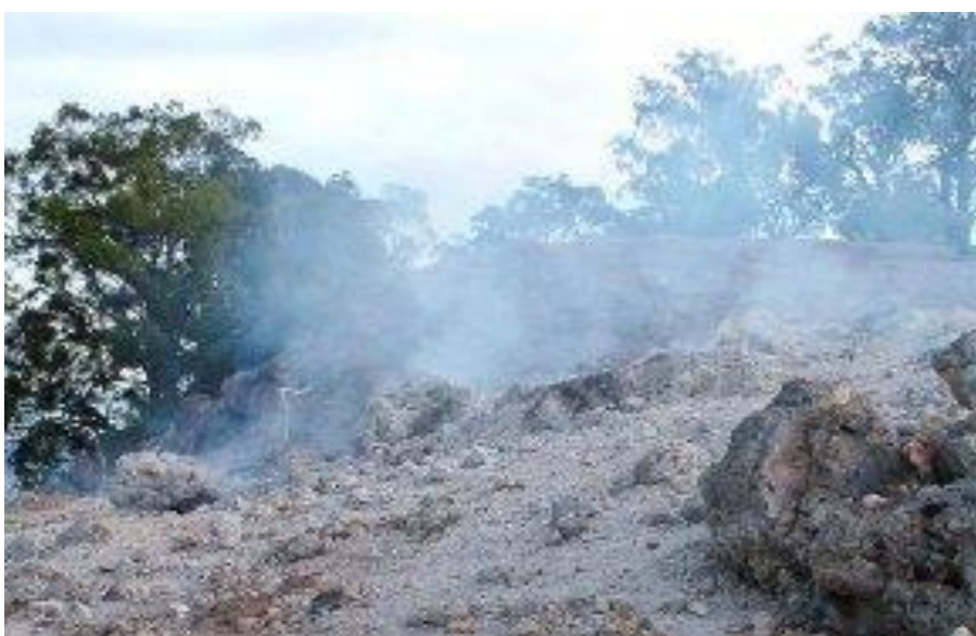
Slika 7: Podzemni požar

Podzemni požari – u njima gori nepotpuno razgrađen materijal u tlu, organske naslage u humusu, kao i podzemne naslage treseta. U podzemne požare ubrajaju se i požari u kamenitim kraškim terenima kada nakon dugotrajnih suša požar zahvati i korijenje u pukotinama kamenja i škrapa. Podzemni požar se razvija iz prizemnog požara. Prizemni požar postepeno suši sloj nerazgrađenog humusa i vatra može prodrijeti do dubine 0,5 m. Požar se sporo, ali kontinuirano, širi na sve strane, a stabla čije je korijenje zahvaćeno, ugiba. Širenje podzemnog požara se teško primjećuje jer ne mora doći do pojave plamena, a dim se može pojaviti u kasnijim fazama razvoja. Požar koji se širi u dubinu uglavnom se nadzire do konačnog samogašenja. Otkopavanje i zalijevanje vodom neće biti učinkovito.