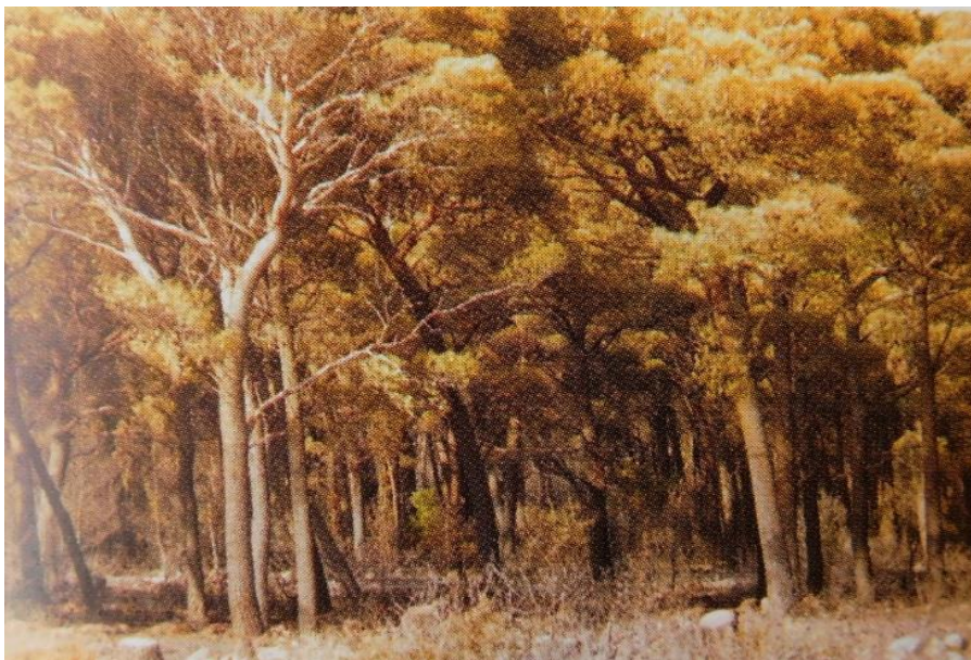
Slika 2: Borova šuma poslije prizemnog požara

Kad je požarom zahvaćena borova šuma, pogotovo u sušnome razdoblju, u pravilu je to sveobuhvatni požar u kojem izgori šumska prostirka, nisko raslinje ovisno koje je i koliko je, te sva korošnja drveća. Već kod prizemnog požara borove iglice će odumrijeti jer ne podnose temperaturu veću od 62°C s time da će se kasnije i debla potpuno osušiti. Sveobuhvatni požar borove šume otpušta, tj. stvara velike količine energije uz ogromne količine dima i „pucajuće“ buke što za vatrogasce predstavlja jedan od većih izazova. Plod bora, šišarka, ubrzava širenje požara tako što zapaljena „odleti“ za više desetaka metara. Uzrok tome su hlapljiva i lako zapaljiva eterična ulja kojih je zatvorena šišarka puna. Nakon paljenja i porasta temperature isparavanjem se stvara pritisak uslijed čega se šišarka naglo otvara i odvaja (puca) od grane te zapaljena „leti“ paleći dalje. To su za vatrogasce na rubu požara krajnje opasne situacije.