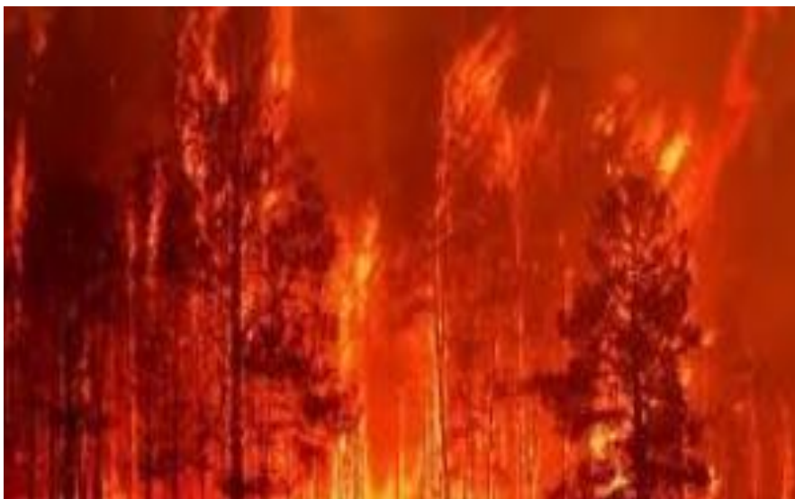
Slika 6: Ovršni požar

Podzemni požari – u njima gori nepotpuno razgrađen materijal u tlu, organske naslage u humusu, kao i podzemne naslage treseta. U podzemne požare ubrajaju se i požari u kamenitim kraškim terenima kada nakon dugotrajnih suša požar zahvati i korijenje u pukotinama kamenja i škrapa. Podzemni požar se razvija iz prizemnog požara. Prizemni požar postepeno suši sloj nerazgrađenog humusa i vatra može prodrijeti do dubine 0,5 m. Požar se sporo, ali kontinuirano, širi na sve strane, a stabla čije je korijenje zahvaćeno, ugiba. Širenje podzemnog požara se teško primjećuje jer ne mora doći do pojave plamena, a dim se može pojaviti u kasnijim fazama razvoja. Požar koji se širi u dubinu uglavnom se nadzire do konačnog samogašenja. Otkopavanje i zalijevanje vodom neće biti učinkovito.