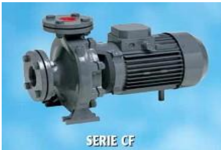
Slika 9: Centrifugalna pumpa

Specijalna konstrukcija i dizajn omogućava ugradnju na vatrogasna vozila ili mogu biti izvedene kao motorne pumpe. U vatrogastvu se uglavnom koriste klipne i centrifugalne pumpe.