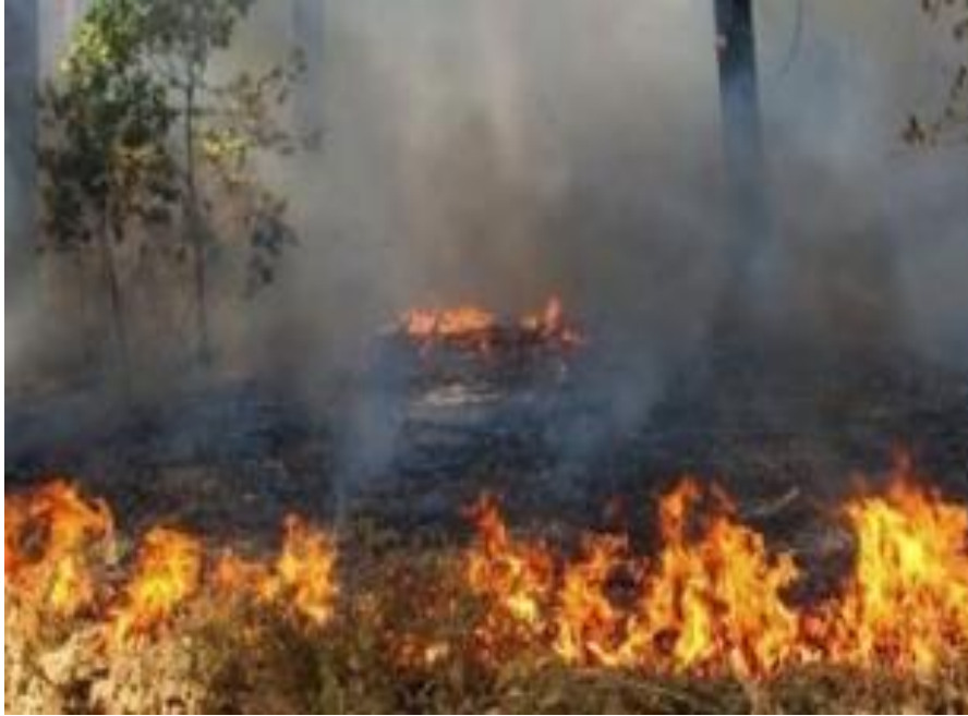
Slika 5: Prizemni požar

Ovršni ili krošnjasti požari – kod ovih požara vatra zahvaća pojedine grane zajedno s lišćem ili iglicama, čitavu krošnju ili deblo. Gotovo se redovito razvija iz prizemnog požara u određenim uvjetima. Požar prelazi u krošnje stabala u slučajevima kada se od oslobođene toplinske energije goriva, prenosi barem 80% topline u krošnje, što se osobito događa prilikom puhanja vjetra. Pritom se ovršni požar širi brže od fronte prizemnog požara.