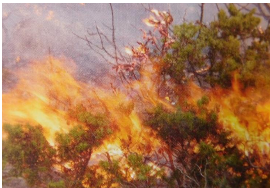
Slika 1: Smrijek

Zapuštene i neodržavane poljoprivredne površine u pravilu će izgorjeti u požaru koji je primjereno svrstati u sveobuhvatni. Smrijek bodljikavošću svojih gustih, krutih iglica ometa prohodnost pri gašenju. Za potpaljivanje je dovoljan mali poticajni plamen koji brzo razvije gorenje, a koje se lako prenosi dalje. Kupina obična je vrsta veoma rasprostranjena u sloju niskog raslinja. Grm kupine stvara zajedno s drugim raslinjem u požaru mnogo dima.