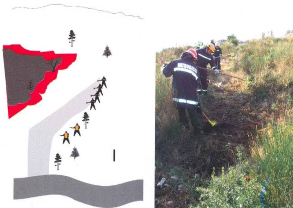
Slika 12: Izrada zaštitnog pojasa

U priobalju se javlja problem teškoća izrade zaštitnih pojaseva zbog konfiguracije terena s relativno malo zemljane površine, te puno kamena i neravnina. Zbog toga se ovakav način gašenja češće i efikasnije primjenjuje u gorskim i kontinentalnim dijelovima gdje je probijanje zaštitnog pojasa lakše. Kod uklanjanja raslinja i drveća, te stvaranja zaštitnog pojasa treba obratiti pozornost na to da požar ne zahvati već uklonjeno raslinje. Vatrogasni zapovjednici moraju procijeniti širinu zaštitnog pojasa i odlučiti o načinu osiguranja, broju gasitelja i vozila, kao i o načinu preventivnog tretiranja vodom, pjenom ili retardantom prije nadolaska požara.