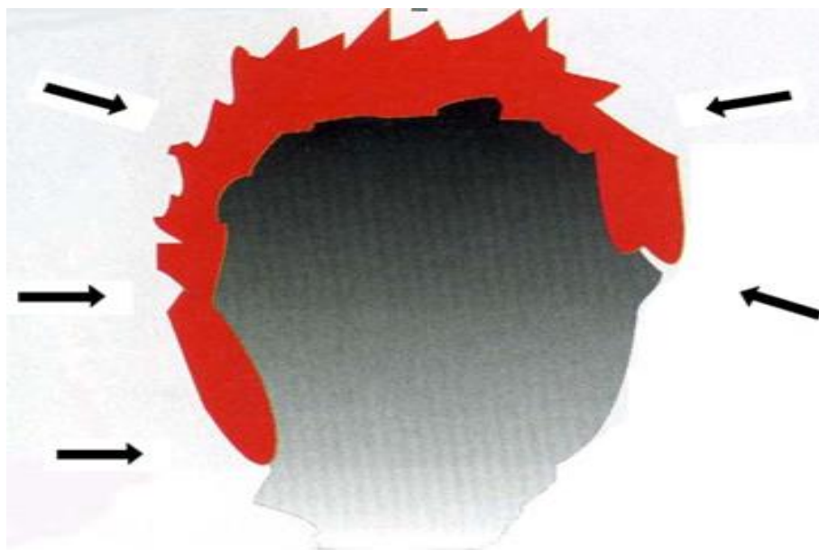
Slika 10: Zaokruživanje požara

Taktika "frontalnog zahvata požara" - rub požara gasi se pomoću dviju grupa, počevši od sredine fronte s postupnim kretanjem prema bokovima i pozadini požara. To je najopasniji sektor požara, a njegovo kretanje brzo povećava opseg radova pri gašenju požara. Ovaj taktički oblik primjenjuje se kada nemamo dovoljan broj ljudi i kad je toplina tolika da vatrogasci mogu raditi na rubu vatre.