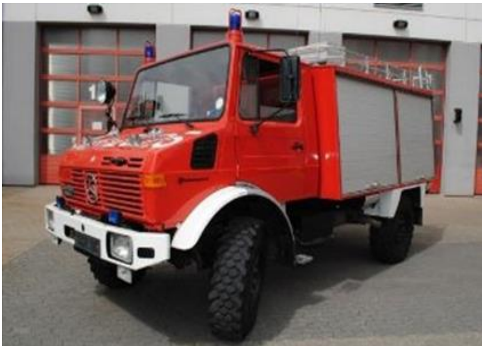
Slika 8: Vatrogasno vozilo

Postoje vatrogasna vozila za različite svrhe, a razvrstana su sukladno normama i namjeni. Gašenje požara raslinja gotovo je nemoguće bez odgovarajućih vatrogasnih vozila.