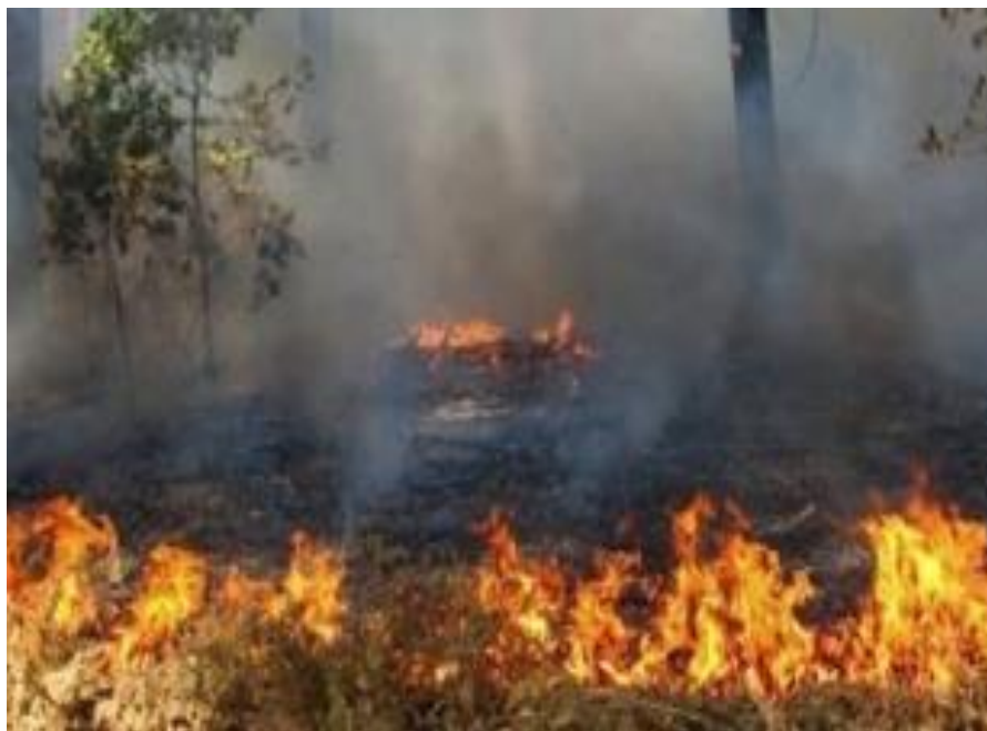
Slika 5: Prizemni požar

Ovršni ili krošnjasti požari – kod ovih požara vatra zahvaća pojedine grane zajedno s lišćem ili iglicama, čitavu krošnju ili deblo. Gotovo se redovito razvija iz prizemnog požara u određenim uvjetima. Požar prelazi u krošnje stabala u slučajevima kada se od oslobođene toplinske energije goriva, prenosi barem 80% topline u krošnje, što se osobito događa prilikom puhanja vjetra. Pritom se ovršni požar širi brže od fronte prizemnog požara.