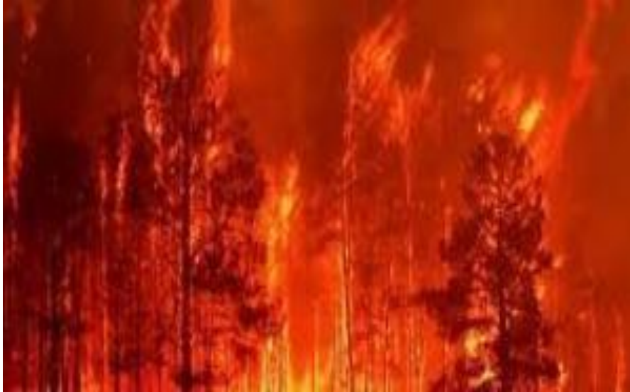
Slika 6: Ovršni požar

Podzemni požari – u njima gori nepotpuno razgrađen materijal u tlu, organske naslage u humusu, kao i podzemne naslage treseta. U podzemne požare ubrajaju se i požari u kamenitim kraškim terenima kada nakon dugotrajnih suša požar zahvati i korijenje u pukotinama kamenja i škrapa. Podzemni požar se razvija iz prizemnog požara. Prizemni požar postepeno suši sloj nerazgrađenog humusa i vatra može prodrijeti do dubine 0,5 m. Požar se sporo, ali kontinuirano, širi na sve strane, a stabla čije je korijenje zahvaćeno, ugiba. Širenje podzemnog požara se teško primjećuje jer ne mora doći do pojave plamena, a dim se može pojaviti u kasnijim fazama razvoja. Požar koji se širi u dubinu uglavnom se nadzire do konačnog samogašenja. Otkopavanje i zalijevanje vodom neće biti učinkovito.