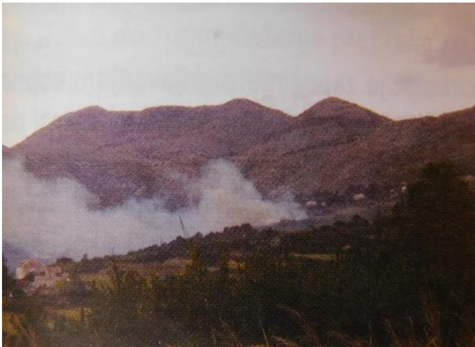
Slika 3: Požar raslinja po buri

Stoga treba znati da se dim, ako je prisutno kolebanje vjetra i ako je zadimljenost u jednom pravcu, već u slijedećim minutama može pružati na drugu stranu. To ne bi smjelo ometati gašenje požara. Dakako. Treba voditi računa o glavnom pravcu kretanja požara raslinja jer požar se uvijek može razmahati do olujnih razmjera.