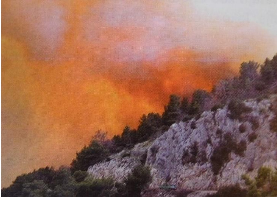
Slika 4: Žestina požara - ekstremna