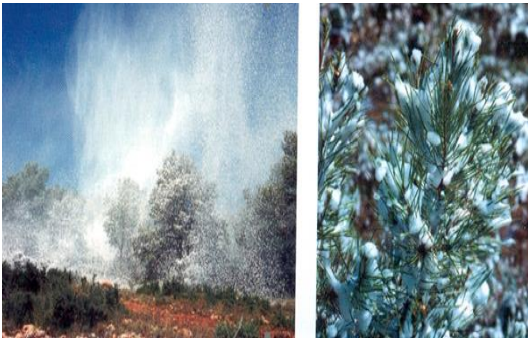
Slika 13: Prekrivanje vegetacije pjenom

Nedostaci pjene klase A: prestaje djelovati kada voda ispari, mogu nadražujuće djelovati na kožu i oči, korozivne su prema nekim metalima i mogu ubrzati propadanje nekih vrsta brtvenih materijala, visoka koncentracija može imati negativni ekološki utjecaj na okoliš.