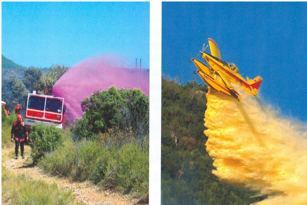
Slika 14: Tretiranje vegetacije retardantima sa zemlje i iz zraka

Glavne komponente retardanata su crvena boja, soli, deterdženti i ugušćivači, koji smanjuju gorivost biljkama i drugim tvarima, odnosno usporavaju gorenje. Djelovanjem topline oni se endotermno razgrađuju. Retardanti mijenjaju tijek pirolize goriva pri čemu nastaju ugljik i voda. Voda apsorbira toplinu i isparava, a vlažan ili suh ugljik teško ili sporo izgara te se požar usporava. Retardantima se dodaju močila kako bi se povećala njihova povezanost i prodornost u gorivu tvar. Pored površinski aktivnih tvari, retardantima se dodaju i ugušćivači čime se dobivaju viskozne otopine. Retardanti se uglavnom primjenjuju preventivno, nabacuju se na gorivu tvar prije nego što se ona zapali. Kod požara raslinja mogu se koristiti za izradu sigurnosnih pojaseva, odnosno za nabacivanje na vegetaciju ispred požara.