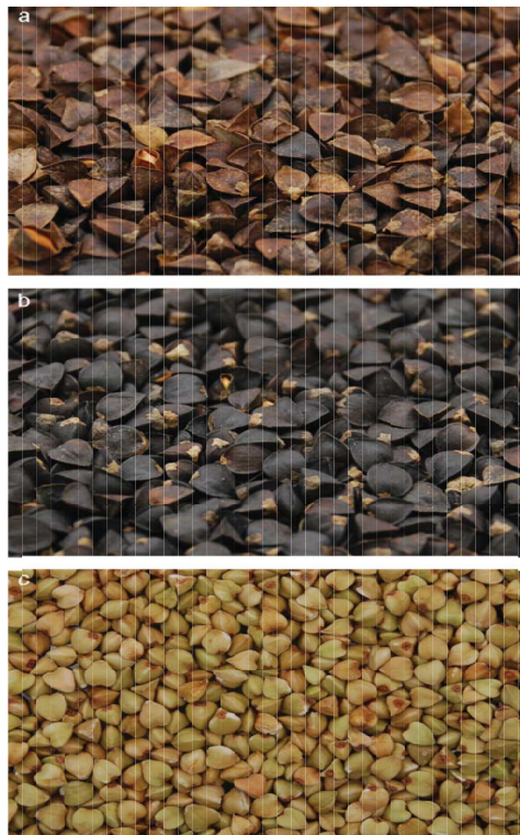
Slika 2. Izgled zrna a) smeđe neoljuštene heljde, b) crne neoljuštene heljde, c) izgled zrna oljuštene heljde (Izydorczyk i sur., 2014).

Plodheljde je zrno, specifičnog trokutastog oblika. Plod se sastoji od sjemene ljuske i jezgre. Na sjemenu ljusku otpada 20 do 40%. Jezgra je tamne boje, a endosperma je bijele boje, s većim sadržajem škroba od žitarica. Klica se nalazi u sredini endosperma, kotiledonima u obliku slova S. Težina tisuću zrna iznosi 20 do 30 grama. Tetraploidna heljda ima veću masu 1000 zrna. Hektolitarska je težina od 55 do 65 kilograma (Gagro, 1997). Duljina je vegetacije oko dva i pol do tri mjeseca.