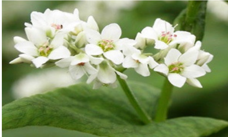
Slika 1. Izgled cvijeta heljde (Christa i Soral-Šmietana, 2008).

Plodheljde je zrno, specifičnog trokutastog oblika. Plod se sastoji od sjemene ljuske i jezgre. Na sjemenu ljusku otpada 20 do 40%. Jezgra je tamne boje, a endosperma je bijele boje, s većim sadržajem škroba od žitarica. Klica se nalazi u sredini endosperma, kotiledonima u obliku slova S. Težina tisuću zrna iznosi 20 do 30 grama. Tetraploidna heljda ima veću masu 1000 zrna. Hektolitarska je težina od 55 do 65 kilograma (Gagro, 1997). Duljina je vegetacije oko dva i pol do tri mjeseca.