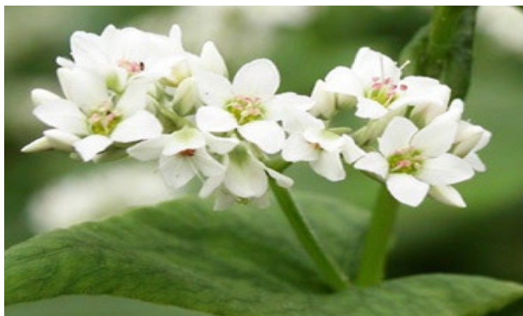
Slika 1. Izgled cvijeta heljde (Christa i Soral-Šmietana, 2008).

Plodheljde je zrno, specifičnog trokutastog oblika. Plod se sastoji od sjemene ljuske i jezgre. Na sjemenu ljusku otpada 20 do 40%. Jezgra je tamne boje, a endosperm je bijele boje, s većim sadržajem škroba od žitarica. Klica se nalazi u sredini endosperma, kotiledonima u obliku slova S. Težina tisuću zrna iznosi 20 do 30 grama. Tetraploidna heljda ima veću masu 1000 zrna. Hektolitarska je težina od 55 do 65 kilograma (Gagro, 1997). Duljina je vegetacije oko dva i pol do tri mjeseca.