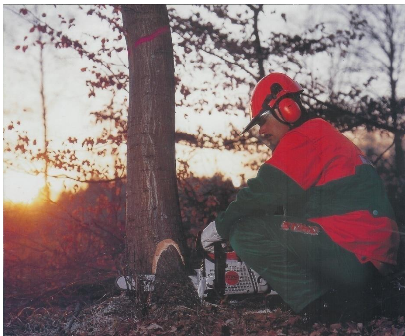
Sl. 5. Rušenje stabla[5]

Nakon obaranja stabla pristupa se kresanju grana koje treba kresati od donjeg dijela stabla prema vrhu i to sa suprotne strane debla od mjesta stajanja radnika kako bi izbjegao udar sjekire i ozljede nogu. Trupljenje debla smije započeti tek kada se deblo postavi na čvrsto i stabilno tlo. Pri pomicanju debla se mora koristiti i pomoćni alat kao što je okretaljka, capin, poluga i slično. Također valja voditi računa o tome da ne dođe do pada trupca na noge radnika koji obavlja trupljenje. Rukovanje drvnim materijalom je opasan posao i radnik se treba pridržavati određenih uputa i upozorenja za rad na siguran način.(Sl.5)