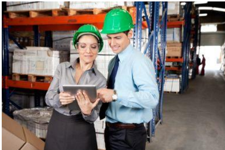
Slika 8. Ispitivanje radnog okoliša