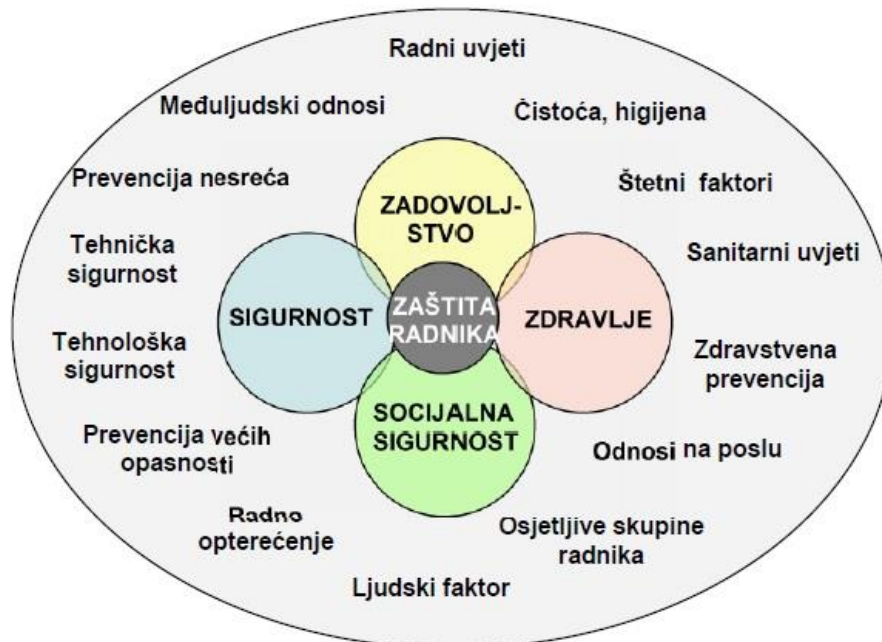
Slika 3. Aspekti rada koji utječu na zaštitu radnika

Sigurnost i zaštita zdravlja na radu moraju se osigurati uzimajući u obzir sve postojeće okolnosti vezane uz rad, tj. uzimajući u obzir ne samo sprječavanje nesreća, uklanjanje opasnih tvari i čimbenika, sigurnost tehničke opreme i procesa, već također i situacije koje dovode do prekomjernog fizičkog, umnog i osjetilnog opterećenja ili stresa. Također je potrebno imati na umu ljudski faktor, psihosocijalne aspekte, stres i nasilje na radnome mjestu. Sve što je nepoželjno na radnome mjestu treba se smatrati rizikom. Zaštita radnika mora se uz sigurnost i zdravlje usredotočiti također i na njihovo zadovoljstvo i socijalnu sigurnost.