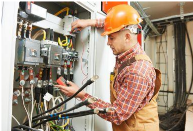
Slika 7. Ispitivanje električnih instalacija

Prema Tehničkom propisu za niskonaponske električne instalacije učestalost redovitih pregleda u svrhu održavanja električne instalacije provode se sukladno zahtjevima iz projekta građevine, ali ne rjeđe od: