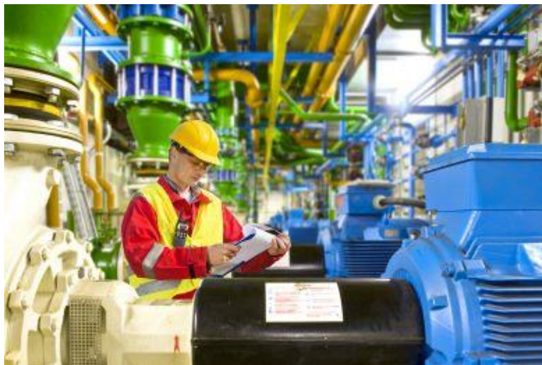
Slika 9. Primjena zaštite na radu na strojevima i uređajima

Ispitivanje je svaka ostala radnja u postupku koju nije moguće utvrditi pregledom, a koja je neophodna za utvrđivanje pojedinih sigurnosno zdravstvenih zahtjeva i provodi se korištenjem mjerne i ispitne opreme.