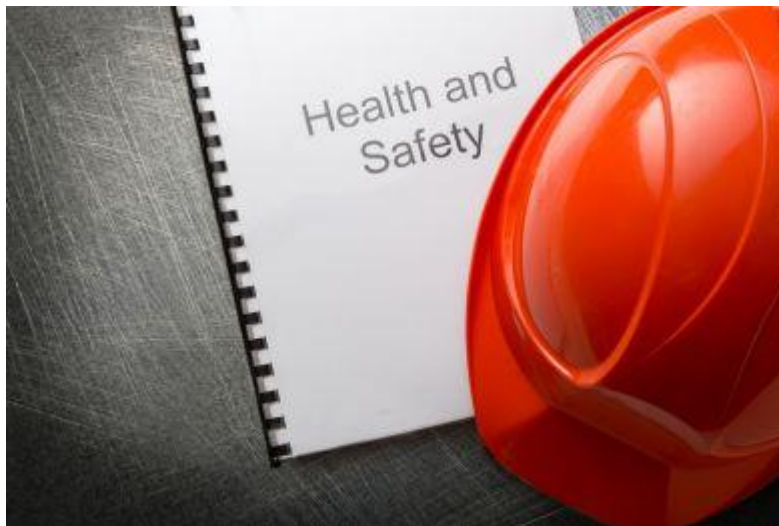
Slika 1. Zaštita na radu u poduzeću

Zakonom o zaštiti na radu propisuju i dodatni uvjeti zaštite posebno osjetljivih skupina osoba na radu od, za njih, specifičnih rizika.