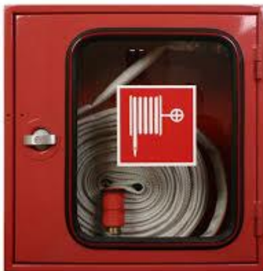
Slika 10. Unutarnja hidrantska mreža

Vanjskom hidrantskom mrežom za gašenje požara obvezatno se moraju štiti: