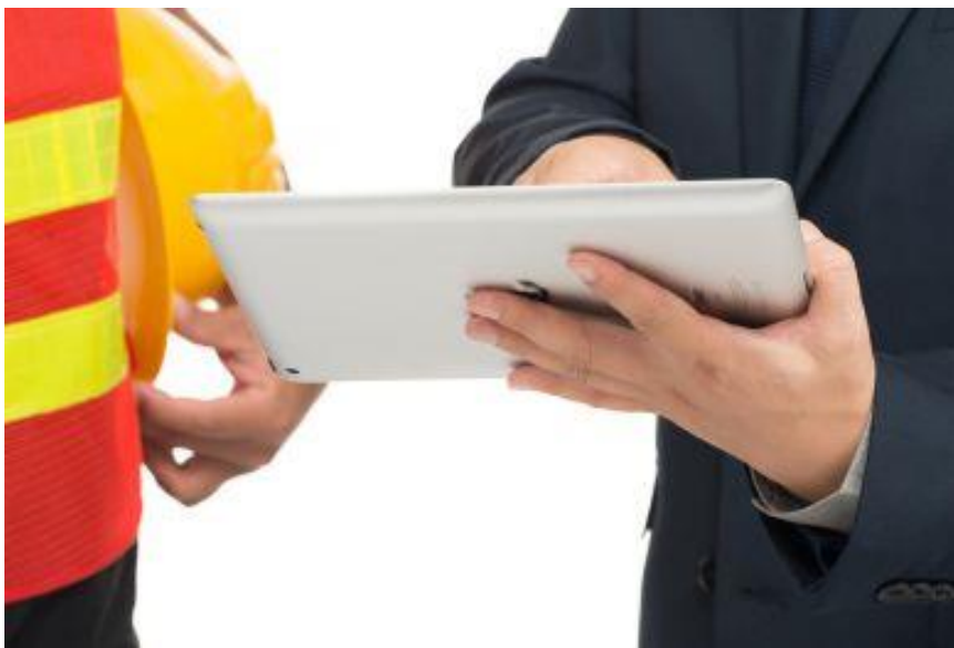
Slika 4. Osposobljavanje djelatnika

Osposobljavanje za rad na siguran način nije obvezno za naučnike te učenike i studente na praksi čije je osposobljavanje uređeno posebnim propisom.