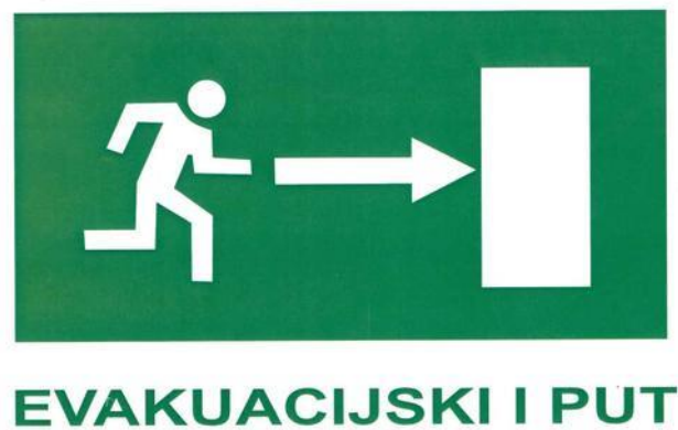
Slika 6. Evakuacijski put

Poslodavac je obvezan broj radnika, njihovu osposobljenost i potrebnu opremu, utvrditi i osigurati u skladu s propisima koji uređuju zaštitu od požara i spašavanje, ovisno o naravi procesa rada, veličini poslodavca te ukupnom broju radnika.