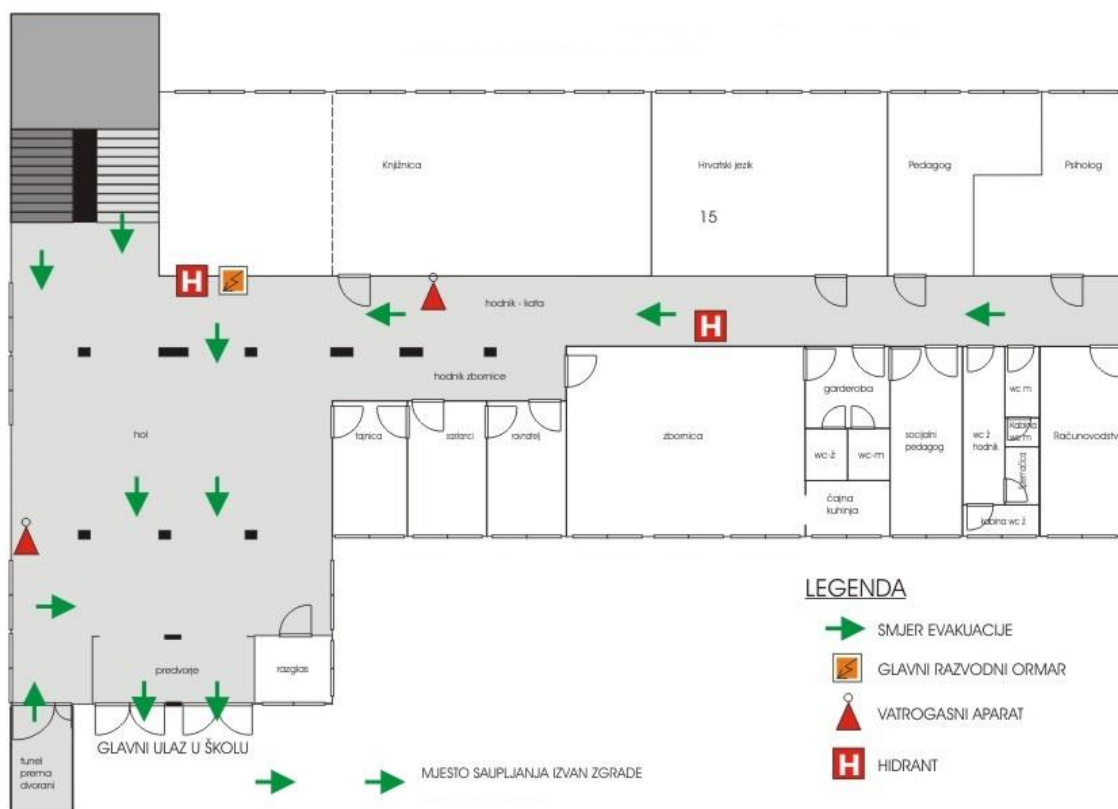
Slika 12. Plan evakuacije

Planom se utvrđuju i sredstva te oprema za spašavanje radnika, npr. kompleti alata, sanitetski materijal, nosila i dr. te se utvrđuju mjesta na kojima će biti ta oprema. Planom se utvrđuje i način davanja propisanih znakova za uzbunu. Svaki plan evakuacije i spašavanja uz tekstualni, sadržava i grafički prikaz objekta, evakuacijskih putova, razmještaj opreme i dr.