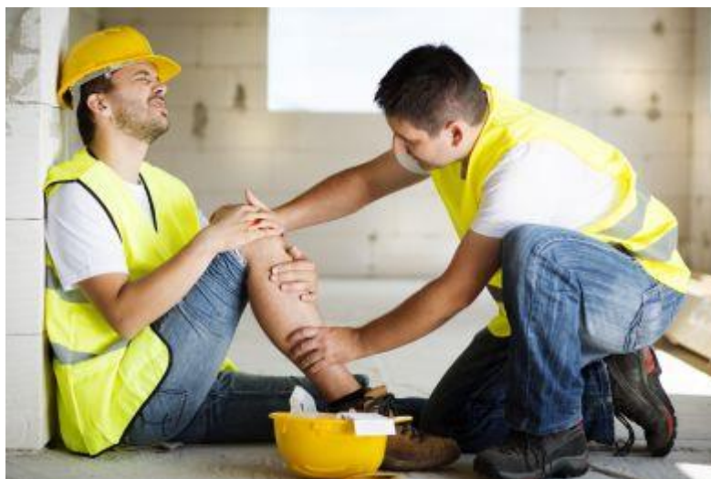
Slika 5. Pružanje prve pomoći

Ministar nadležan za zdravlje, uz suglasnost ministra, pravilnikom propisuje postupke pružanja prve pomoći, sredstva, vrstu i količinu sanitetskog materijala koja mora biti osigurana na mjestu rada te način i rokove osposobljavanja radnika za pružanje prve pomoći.