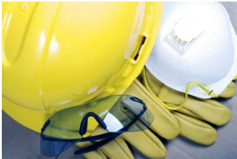
Slika 2. Osobna zaštitna sredstva

Predstavnici radnika imaju pravo uvida u dokumente, koji predstavljaju stručnu podlogu za izbor osobnih zaštitnih sredstava.