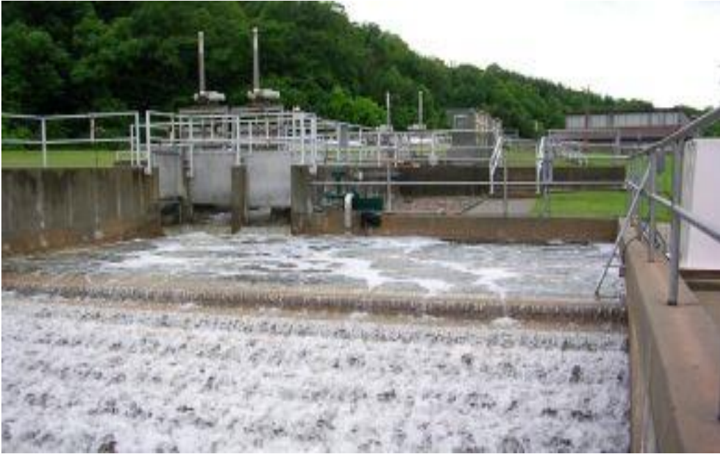
Slika 11. Prikaz pročišćavanja otpadnih voda