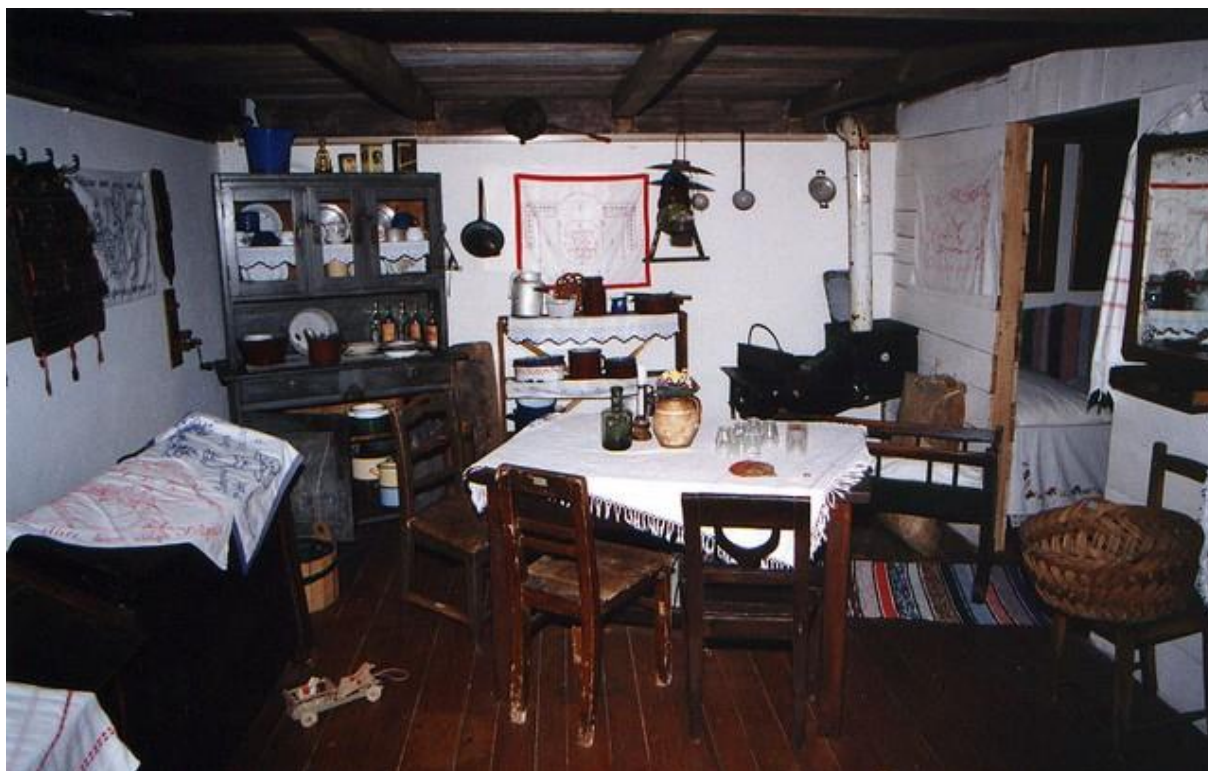
Slika 27. Zavičajni muzej Ogulin, etnografska zbirka