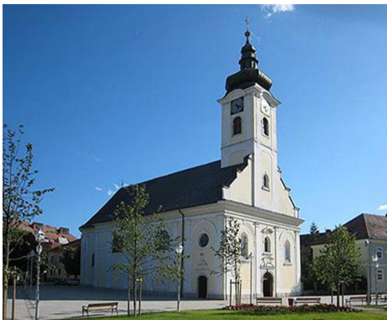
Slika 11. Župna crkva Sv. Križa