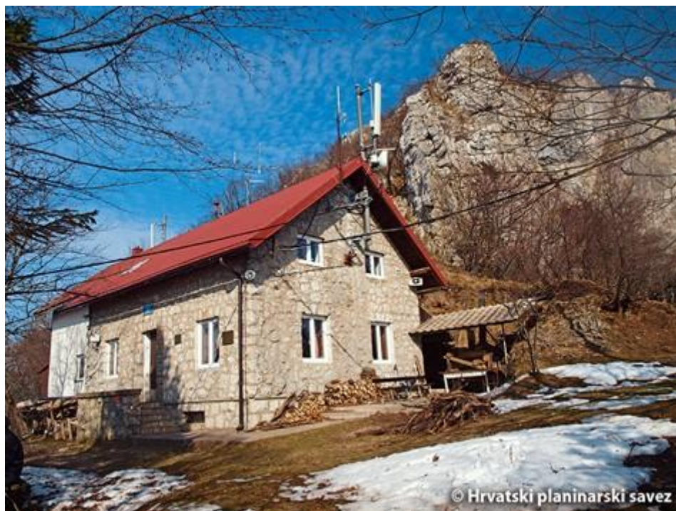
Slika 26. Planinarski dom na Kleku