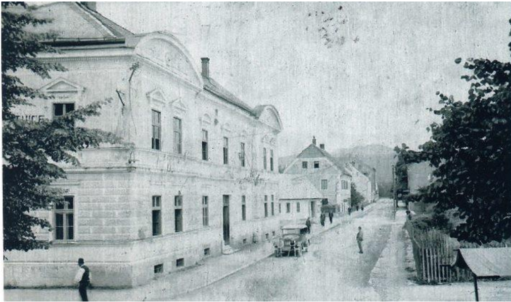
Slika 3. Hotel „K kolodvoru“