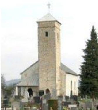
Slika 15. Crkva Sv. Jakova