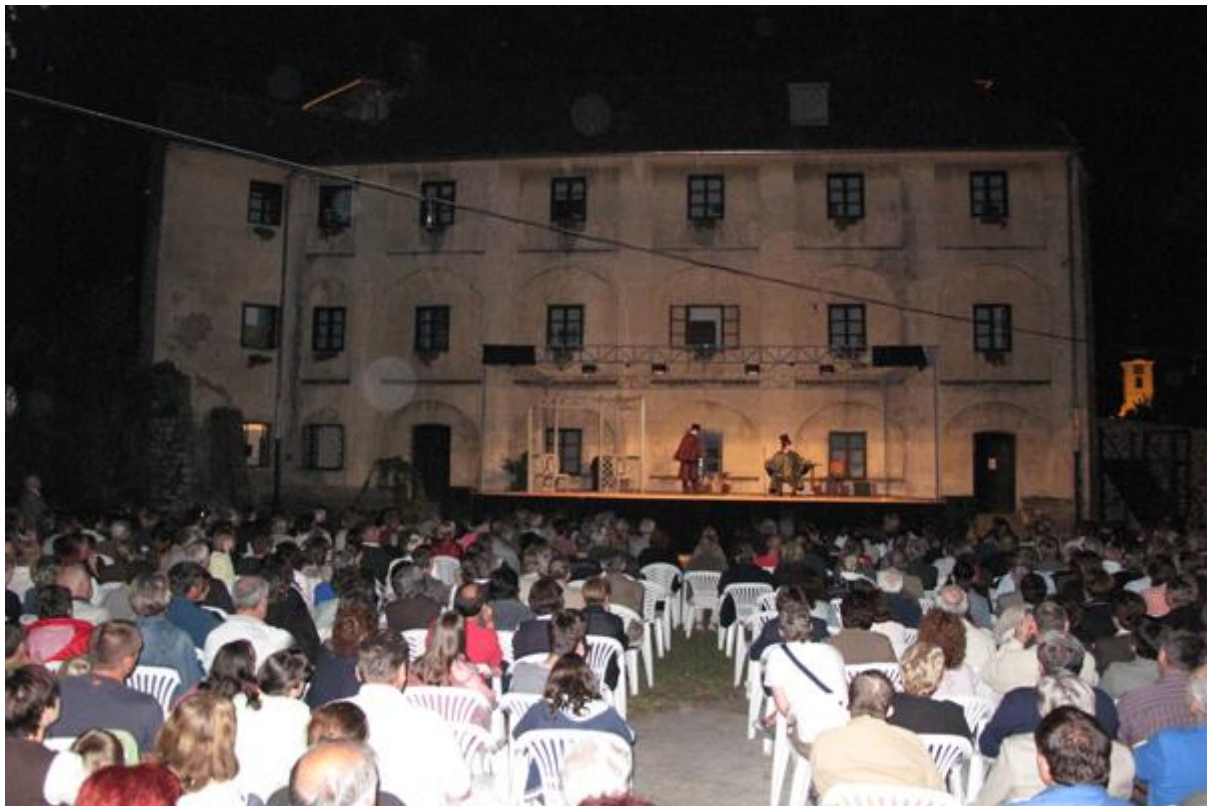
Slika 28. Frankopanske ljetne večeri