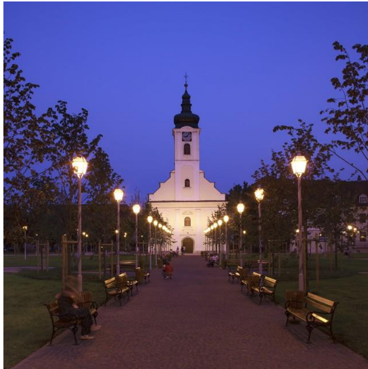
Slika 25. Crkva svetog Križa u Ogulinu