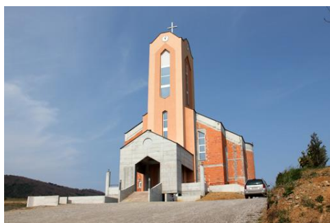
Slika 23. Crkva Blaženog kardinala A. Stepinca