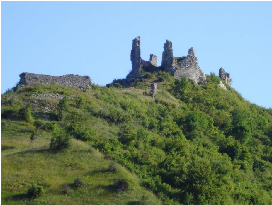
Slika 10. Modruška gradina