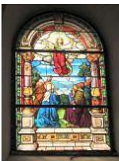
Slika 13. Vitraj u crkvi Sv. Križa