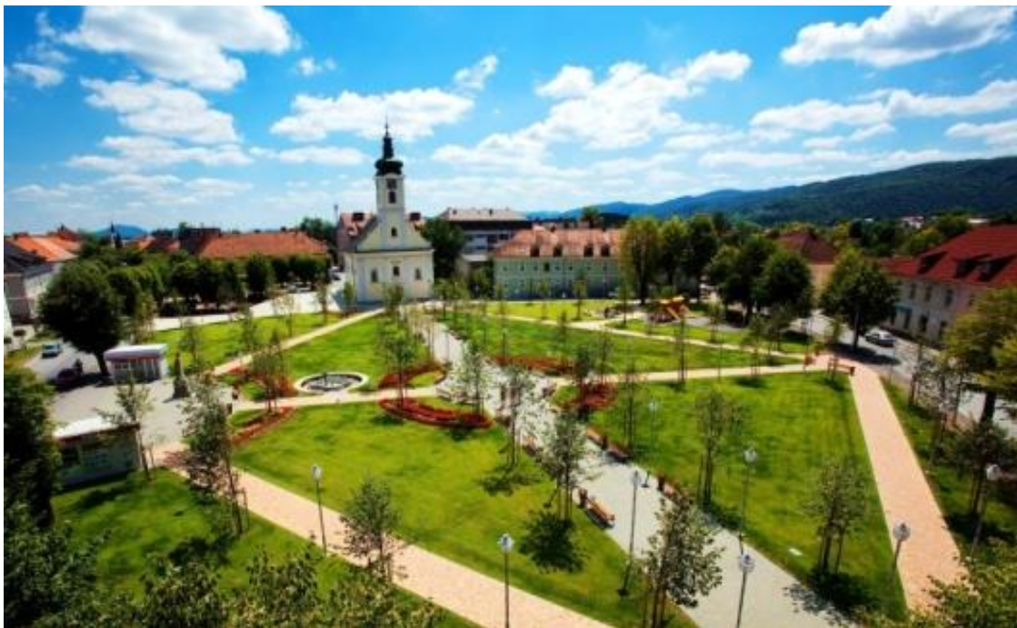
Slika 1. Grad Ogulin