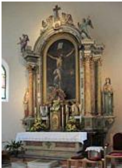
Slika 12. Oltar u crkvi Sv. Križa