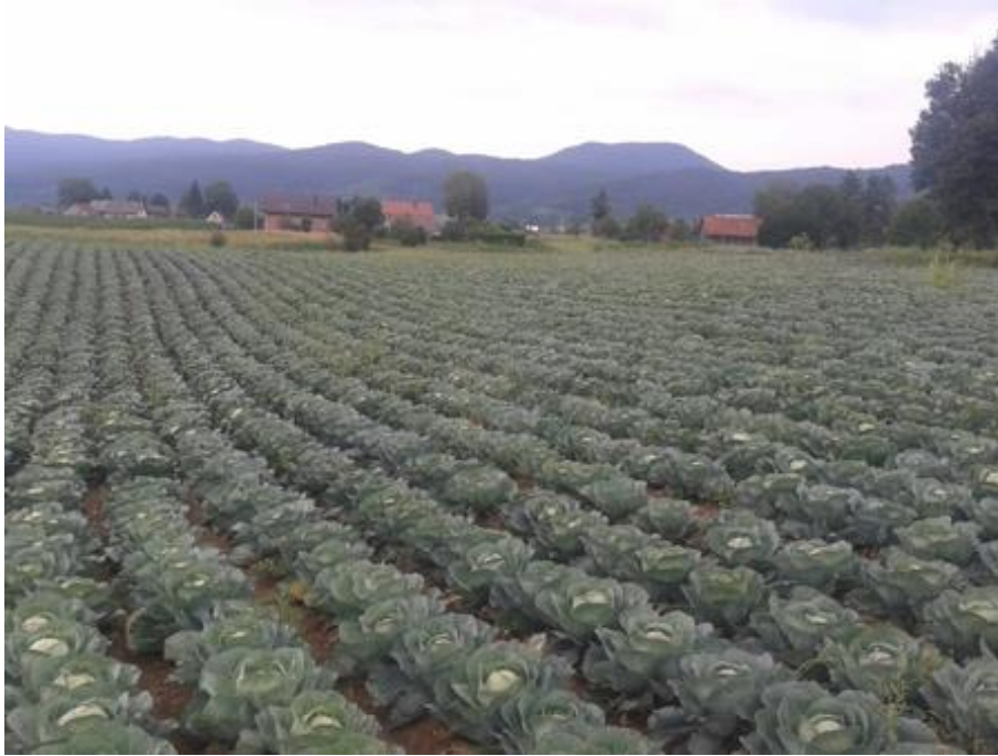
Slika 24. Polje kupusa u Ogulinu