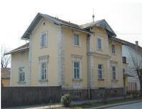
Slika 20. Samostan Sv. Franje Asiškog