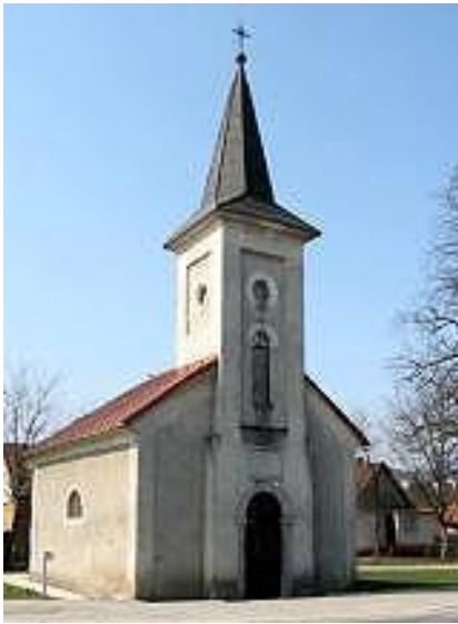
Slika 17. Kapela Sv. Roka