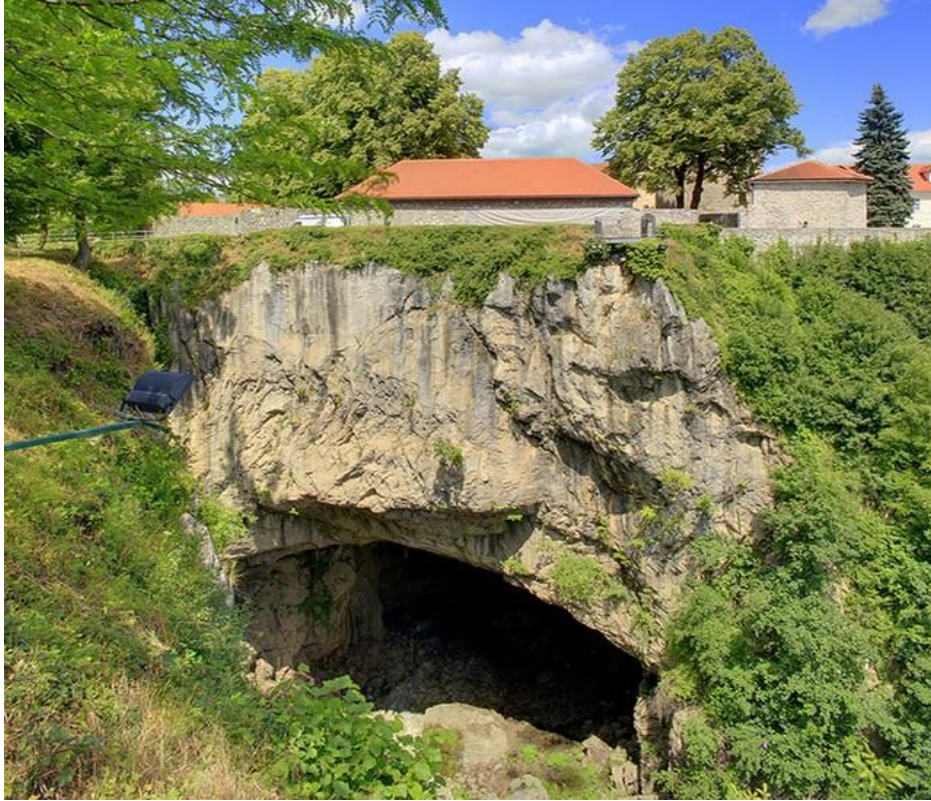
Slika 7. Đulin ponor