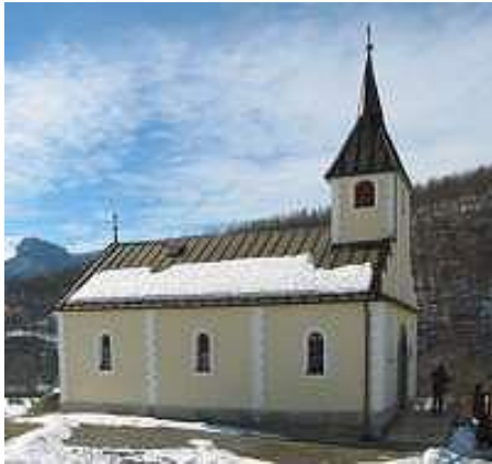
Slika 19. Crkva Sv. Antuna Padovanskog