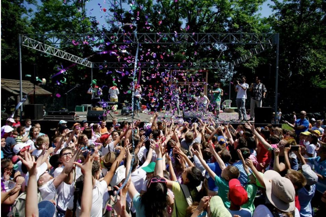
Slika 30. Ogulinski festival bajke