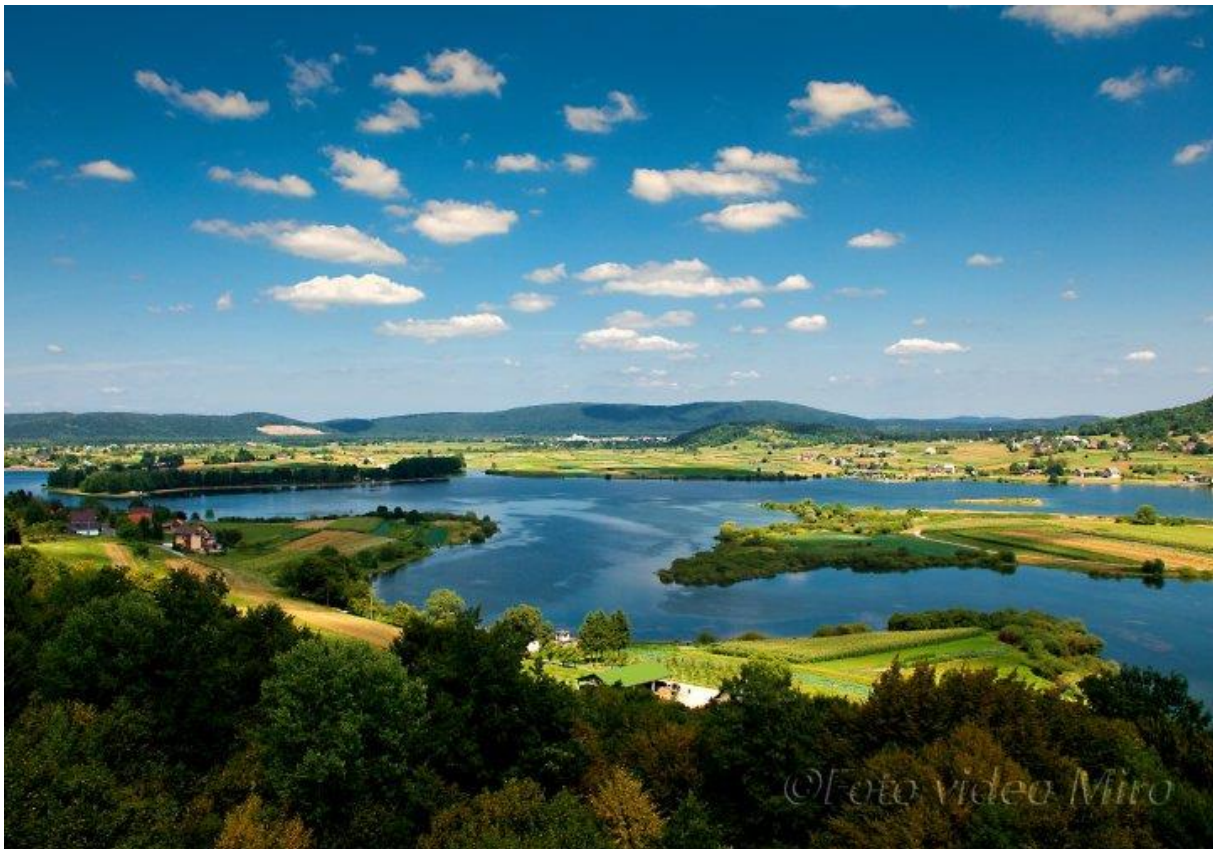
Slika 8. Jezero Sabljaci