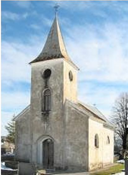
Slika 16. Crkva Sv. Petra