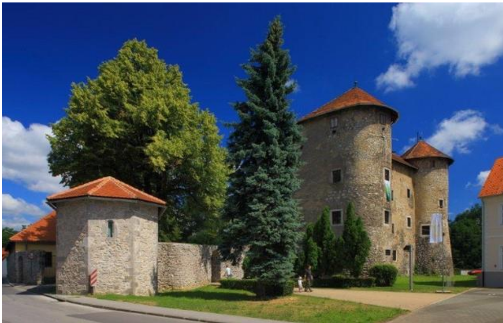
Slika 9. Frankopanski kaštel

Izvor: Turistička zajednica Ogulin, www.tz-grad-a-ogulina.hr (22.9.2015.)