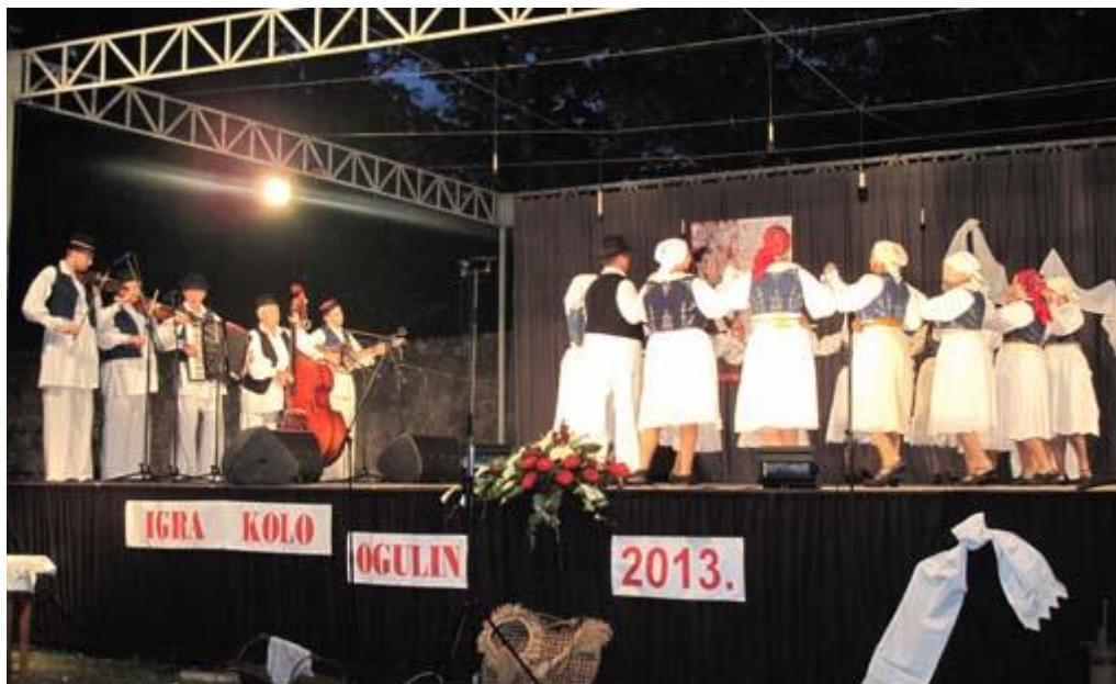
Slika 29. Smotra folklora Igra kolo