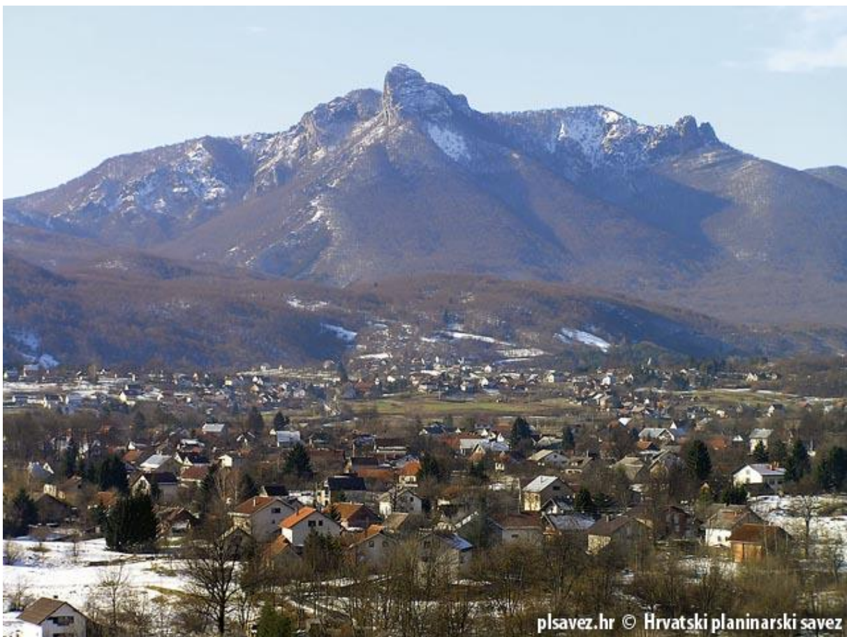
Slika 4. Klek