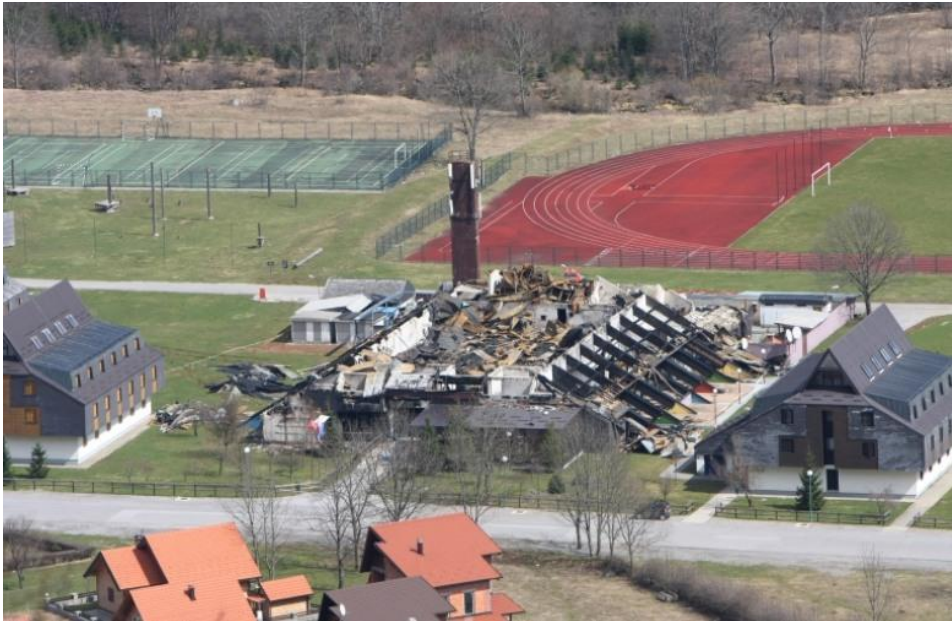
Slika 6. HOC Bjelolasica nakon požara 2011.