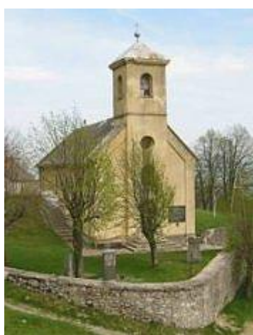
Slika 22. Župna crkva Presvetog Trojstva