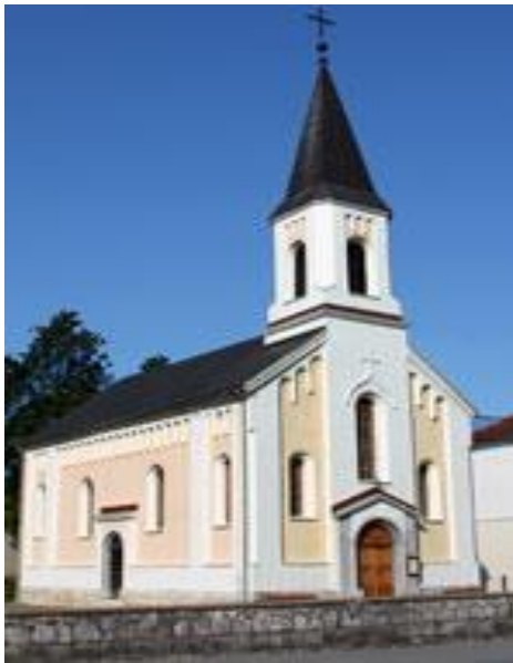
Slika 21. Crkva Sv. Georgija