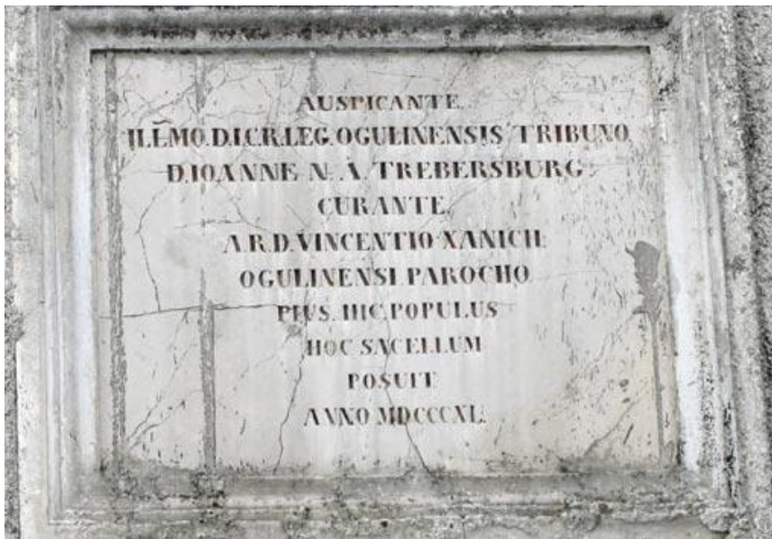
Slika 18. Natpis na kapeli Sv. Roka