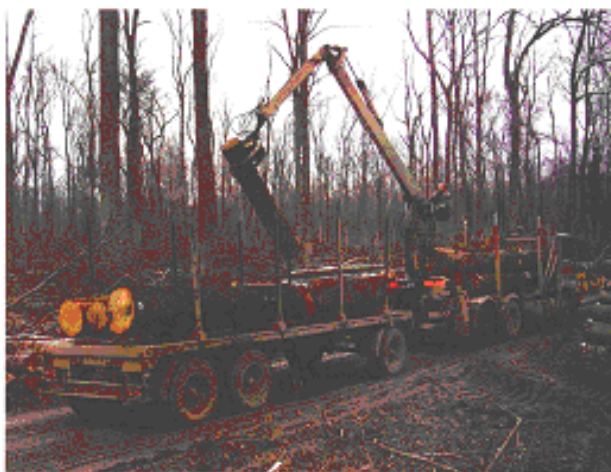
Slika 14. Utovar trupaca

Kamioni namijenjeni prijevozu trupaca na šasijama imaju montiranu tzv. šumsku nadogradnju tj. ojačani utovarni prostor i bočne držače. Svi su opremljeni hidrauličnim dizalicama za utovar i istovar, a većina ih ima dvije stražnje osovine. Zakonski propisi kojih se potrebno pridržavati pri prijevozu drva kamionima najvećim su dijelom regulirani Pravilnikom o tehničkim uvjetima vozila u prometu na cestama (NN 59/98).