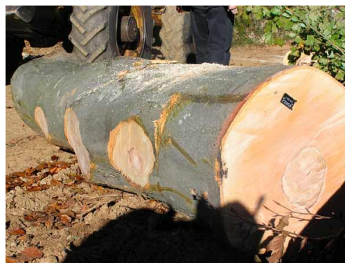
Slika 13. Klasiranje trupaca