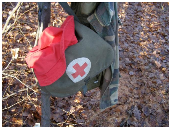
Slika 18. Prva pomoć na radilištu

Na svakom radilištu moraju se nalaziti sva sredstva za pružanje prve pomoći a radnici moraju biti osposobljeni za pružanje prve pomoći. Ako na radilištu radi do 20 ljudi onda bar jedan od njih mora biti osposobljen za pružanje prve pomoći, te još po jedan za svakih 50 radnika.