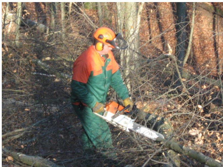
Slika 7. Uređenje radilišta

Kada je pažljivo i dobro očistio radno mjesto, dovoljno široko oko žilišta da osigura rad na siguran način, radnik otklanja sve ostale opasnosti u zoni rušenja. Mora srušiti sva trula opasna i nesigurna stabla, prije nego što pristupi rušenju odabranog stabla. Također, mora u suradnji s poslovođom porušiti i nedoznačena stabla, ali samo ako je to neophodno radi sigurnosti. Svaka uočena opasnost u krošnjama mora neprestano biti kontrolirana i pod nadzorom.