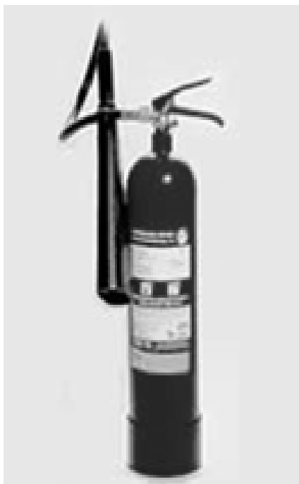
Slika 2. Aparati s CO2