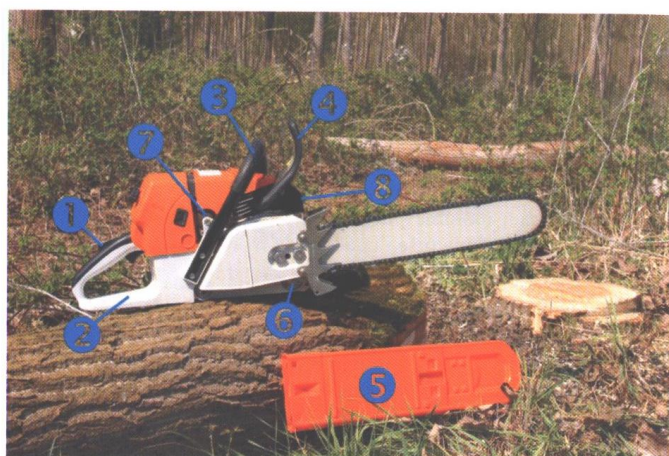
Slika 17. Zaštitne naprave na motornoj pili