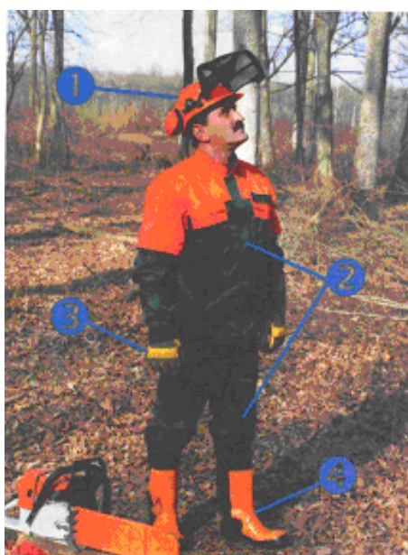
Slika 16. Osobna zaštitna sredstva radnika: