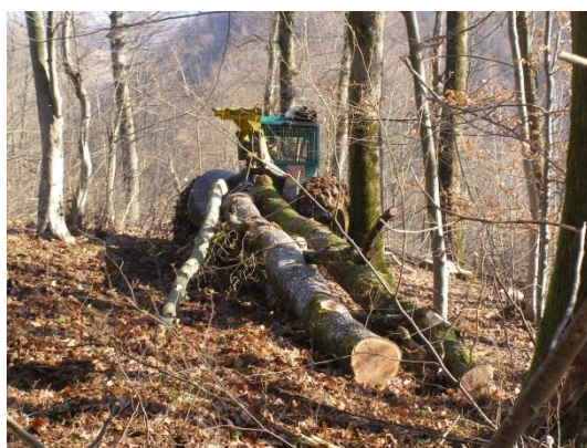
Slika 11. Transport debla