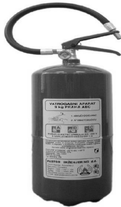
Slika 1. S-9 vatrogasni aparat

Danas, zbog svojih prednosti najrašireniju primjenu imaju vatrogasni aparati za gašenje požara prahom. U njihove prednosti mogu se ubrojiti gašenje požara električnih uređaja pod naponom, potpuna neotrovnost i neškodljivost u odnosu na čovjeka i materije, otpornost prema smrzavanju i mogućnost gašenja i pri veoma niskim temperaturama, mogućnost gašenja gotovo svih vrsta požara (klase A, B, C, E) i velika moć gašenja. Nedostaci su im osim fizičkog onečišćenja su kad je prah tijekom gašenja izložen temperaturama višim od 120 °C, a gašenje je obavljeno u prostoru u kojem je relativna vlažnost veća od 50 %, predmeti na kojima se nalazi prah korodiraju pa se prah u potpunosti mora odstraniti sa svih površina na koje dospije tijekom gašenja. Pored navedenog, treba napomenuti da tijekom gašenja požara u zatvorenim prostorima može doći do smanjene vidljivosti na što treba upozoriti osobe koje će rukovati aparatima.