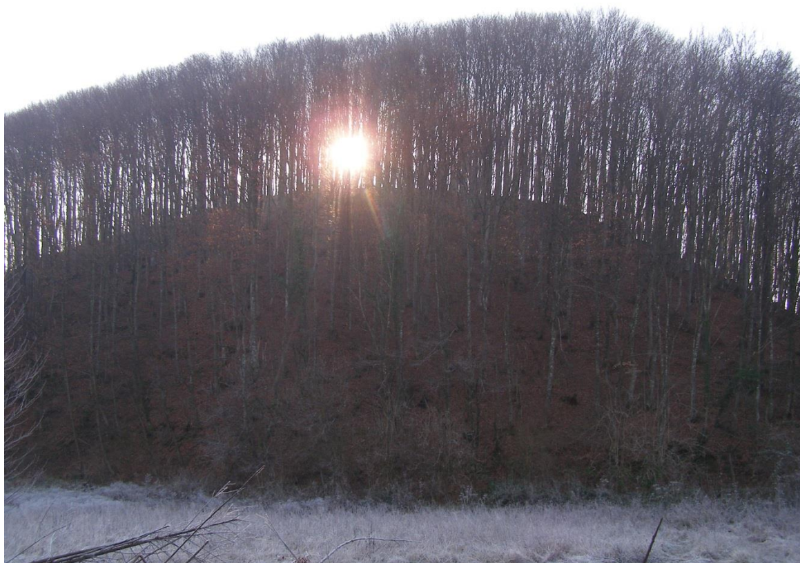
Slika 6. Šumsko radilište

Obaranje stabala i izrađivanje šumskih drvnih sortimenata skraćeno se naziva sječa i izrada. Taj se posao dijeli na obaranje doznačenih stabala, izrađivanje drvnih proizvoda te uspostavu šumskog reda.