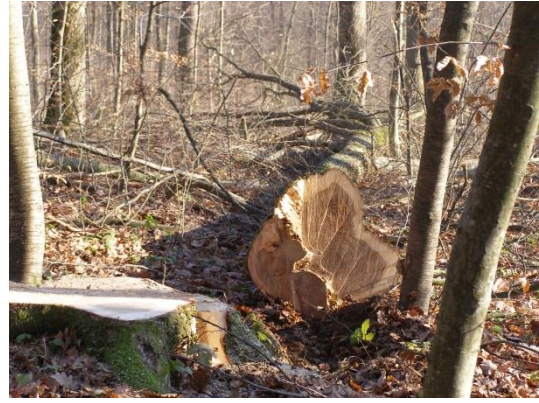
Slika 9. Prikaz pravilnog načina obaranja stabla