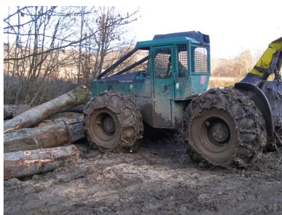
Slika 12. Doprema na pomočno stovarište

Za pomočno stovarište smije se koristiti samo ravan ili blago nagnut teren nagiba do 10^\circ . Teren koji se koristi mora biti očišćen od drveća, grana, kamenja i drugih predmeta koji smetaju pri radu.