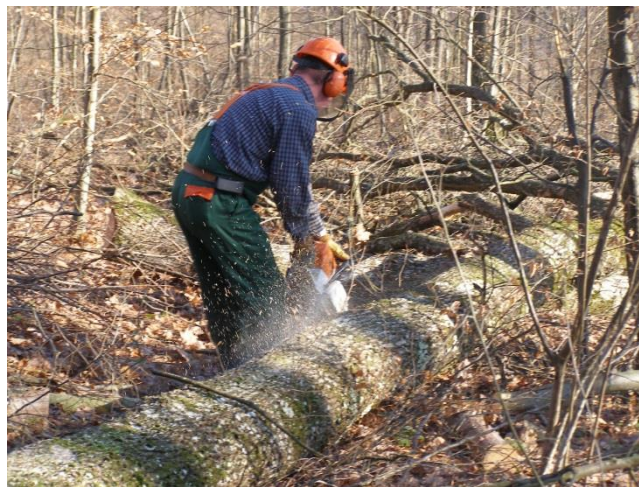
Slika 10. Oblikovanje žilišta i kresanje grana

Prije svih radnji na oborenom stablu potrebno je nakon pada pričekati da se umire krošnje susjednih stabala, te provjeriti više li na njima otkinute ili slomljene grane, koje mogu biti potencijalna opasnost. Također je potrebno utvrditi stabilnost debla (opasnost od kotrljanja, uklještena debla...)