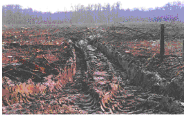
Slika 15. Šteta na tlu

Svi se strojevi pri kretanju i radu moraju pridržavati mjera zaštite tla i okolne sastojine. Pri izvoženju treba se kretati po vlakama, a u neplodnim i dovršnim sjekovima po obilježenim izvoznim putovima. Debla stabla koja se nalaze neposredno uz vlake, treba zaštititi od oštećivanja. Štete na tlu se moraju nakon završetka privlačenja sanirati.