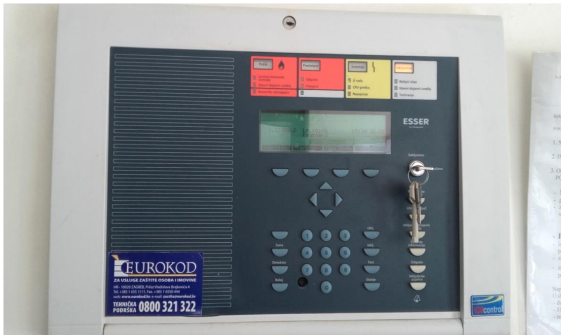
Slika 21. Vatrodojava [izrada autora]