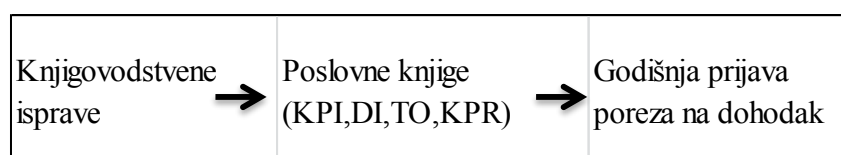
Tablica 7. Računovdstveni proces i poslovne knjige obrtnika