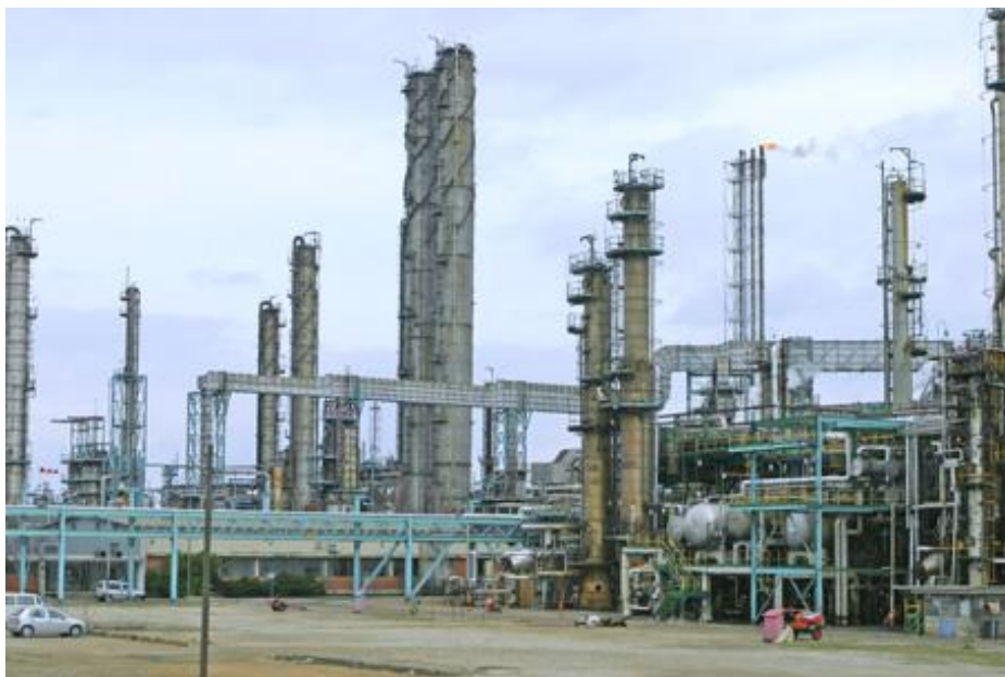
Slika 14: Rafinerija nafte u Sisku

Rafinerija nafte Sisak nalazi se u dijelu grada koji se zove Caprag, uz desnu obalu Kupe, u blizini njenog utoka u Savu. Dio je poslovnog sustava INA - Industrija nafte, a godišnje je mogla preraditi oko 4 milijuna tona nafte. Danas prerađuje oko 2 milijuna tona nafte. Rafinerija koristi izuzetno povoljan geostrateški položaj Siska, transportne putove, plovne rijeke i naftovod. Prvih godina 21. stoljeća vode se intenzivni pregovori između grada i Rafinerije o zaštiti okoliša, a osobito o smanjenju zagađenja zraka.