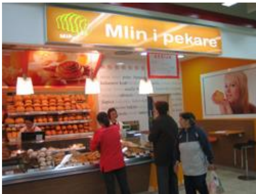
Slika 24: Mlin i pekare – prodajno mjesto