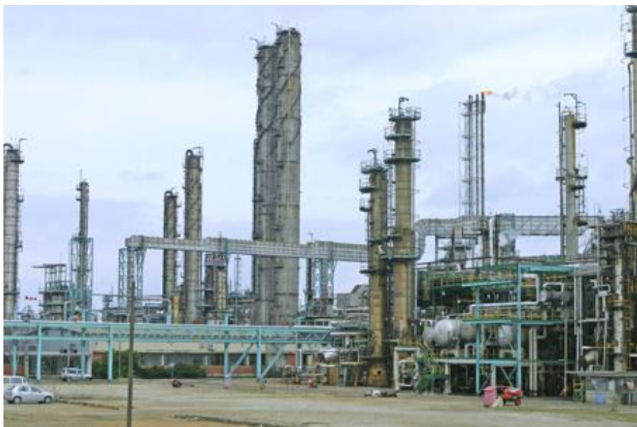
Slika 14: Rafinerija nafte u Sisku

Rafinerija nafte Sisak nalazi se u dijelu grada koji se zove Caprag, uz desnu obalu Kupe, u blizini njenog utoka u Savu. Dio je poslovnog sustava INA - Industrija nafte, a godišnje je mogla preraditi oko 4 milijuna tona nafte. Danas prerađuje oko 2 milijuna tona nafte. Rafinerija koristi izuzetno povoljan geostrateški položaj Siska, transportne putove, plovne rijeke i naftovod. Prvih godina 21. stoljeća vode se intenzivni pregovori između grada i Rafinerije o zaštiti okoliša, a osobito o smanjenju zagađenja zraka.