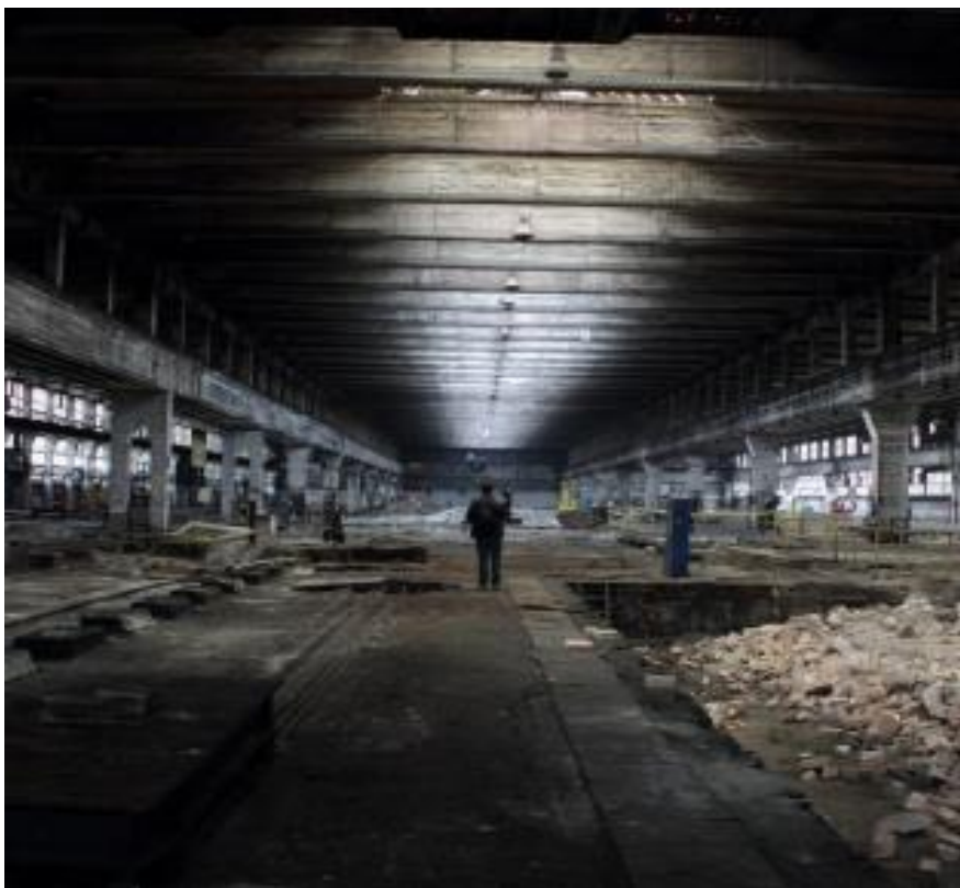
Slika 16: Propast Željezare Sisak

Vrijeme je da se okrenemo suvislom stvaranju socijalističke alternative oprečnoj današnjem sustavu temeljenom na stranim ulaganjima, privatizaciji i zavisnosti o stranom kapitalu.