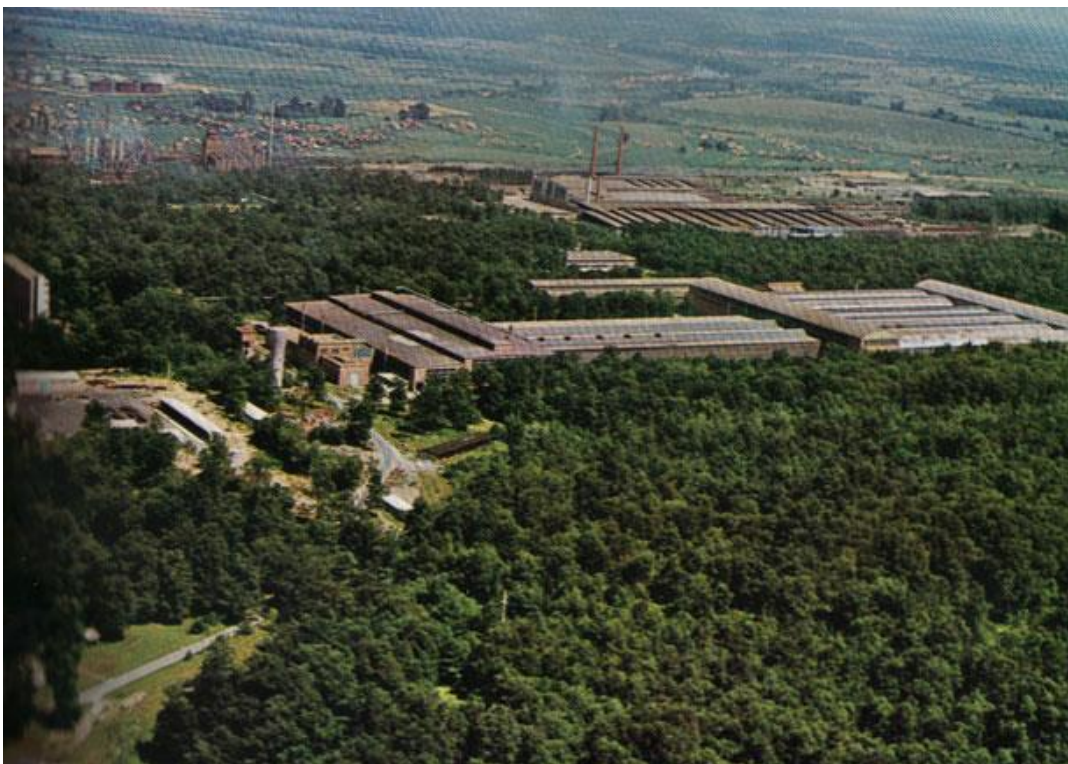
Slika 3: Valjaonica bešavnih cijevi u hrastovoj šumi