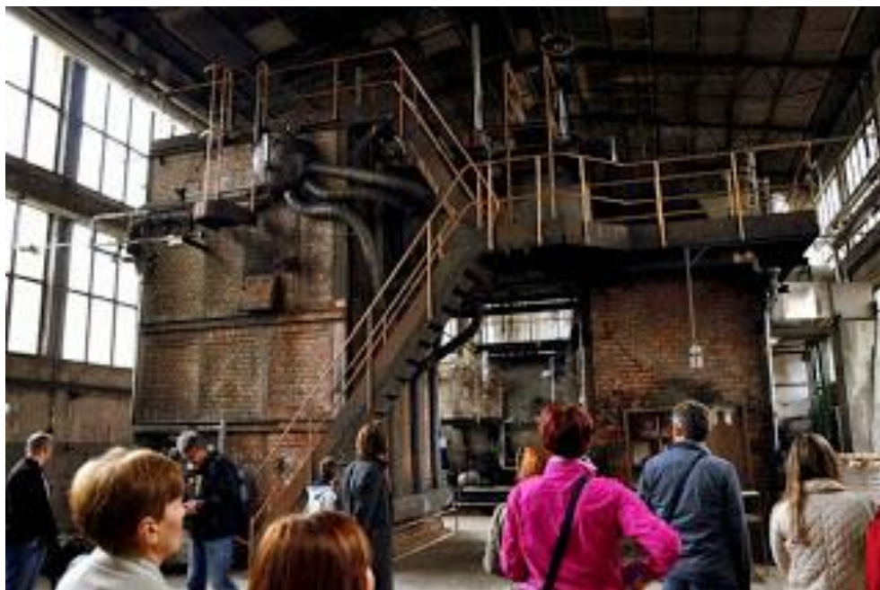
Slika 17: Ciglena peć za paru

Nedaleko od postrojenja za proizvodnju pare na mazut nalaze se acetatori. Oni su smješteni u staroj drvenoj proizvodnoj hali koja održava idealne uvijete vlage i temperature za proizvodnju octa. Miris u ovoj hali je naprosto nevjerojatan – na prvu se čini da sve zaudara po octu, ali nakon nekoliko sekundi shvatite da je to zapravo miris jabuka od kojih se ocat proizvodi.