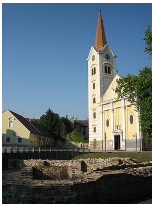
Slika 6: Sjedište ordinarijata sisačke biskupije

Uz ove i druge ustanove, u Sisku djeluje i niz umjetnika iz raznih područja. Tu je poznati akademski slikar Slavko Striegl, a u pripremi je otvaranje stalnog postava njegove galerije. Od 1995. djeluje i sastav The Bambi Molesters koji svira garage i surf glazbu, a postigao je zapaženi uspjeh u svijetu. U Sisku se od 1999. održava i Međunarodni festival dječjih kazališta Maslačak.