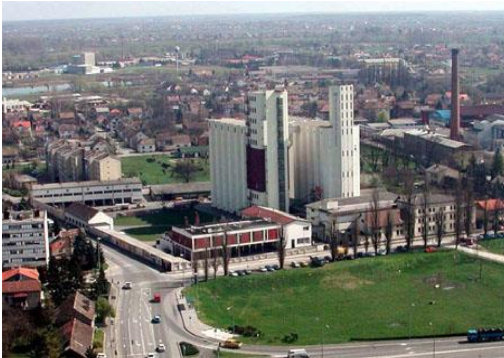
Slika 23: Mlin i pekare d.o.o.