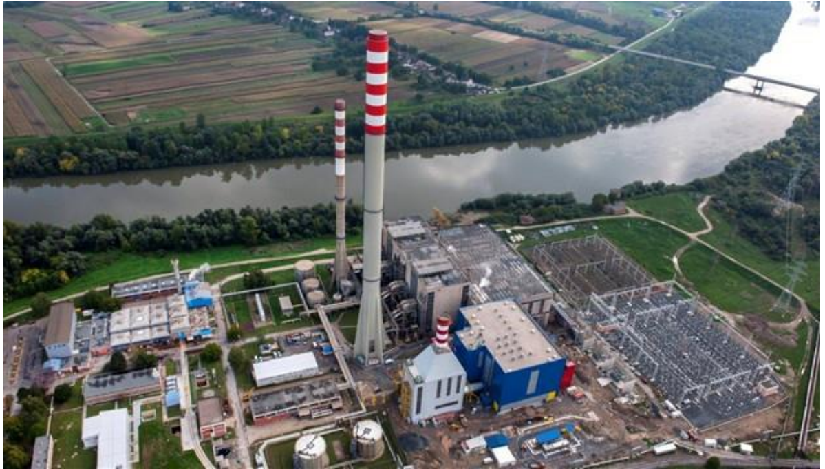
Slika 21: Termoelektrana – toplana Sisak