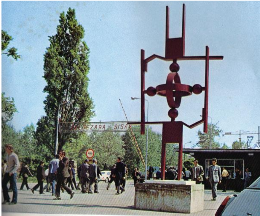
Slika 12: Kožarićev „Antipod“ na ulazu u Željezaru