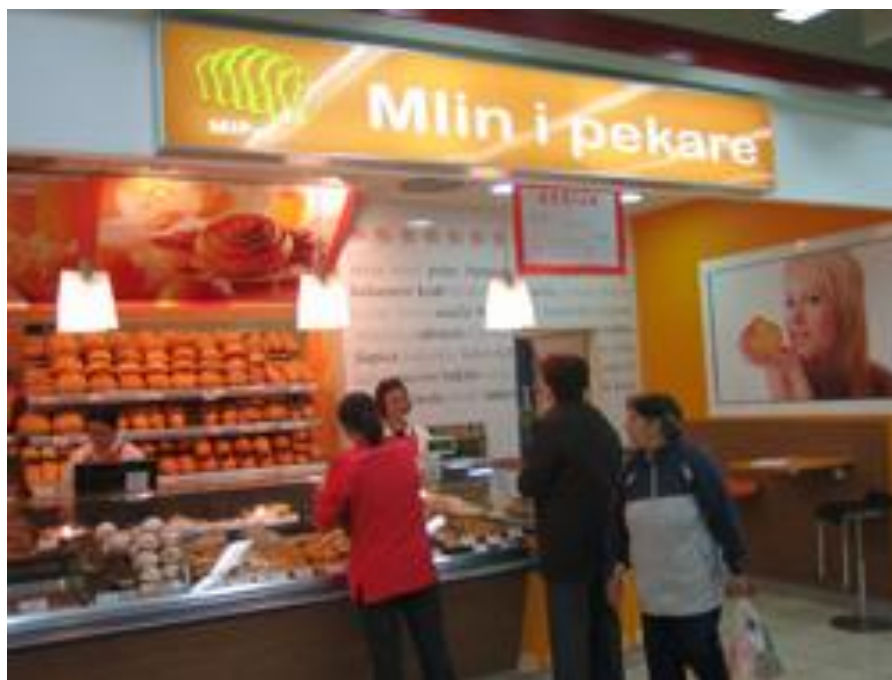
Slika 24: Mlin i pekare – prodajno mjesto