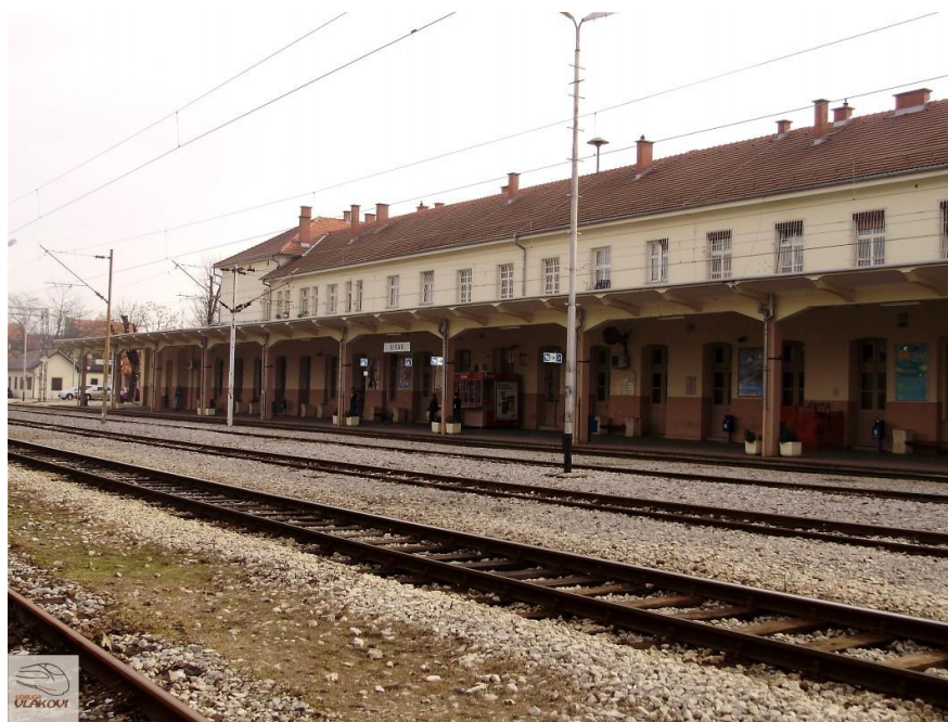
Slika 27: Željeznički kolodvor u Sisku

Istočno od željezničke postaje Caprag postoji teretna ranžirna postaja INA Rafinerije nafte koja zadovoljava potrebe manevarskog i ranžirnog prometa uz mogućnost pranja auto i željezničkih cisterni. Teretne industrijske kolosijeke na području grada imaju i proizvodni pogoni: Segestica, Herbos, Siscia, Željezara Sisak (tvornica čeličnih konstrukcija i čeličana), INA - Rafinerija nafte i Termoelektrana Sisak.