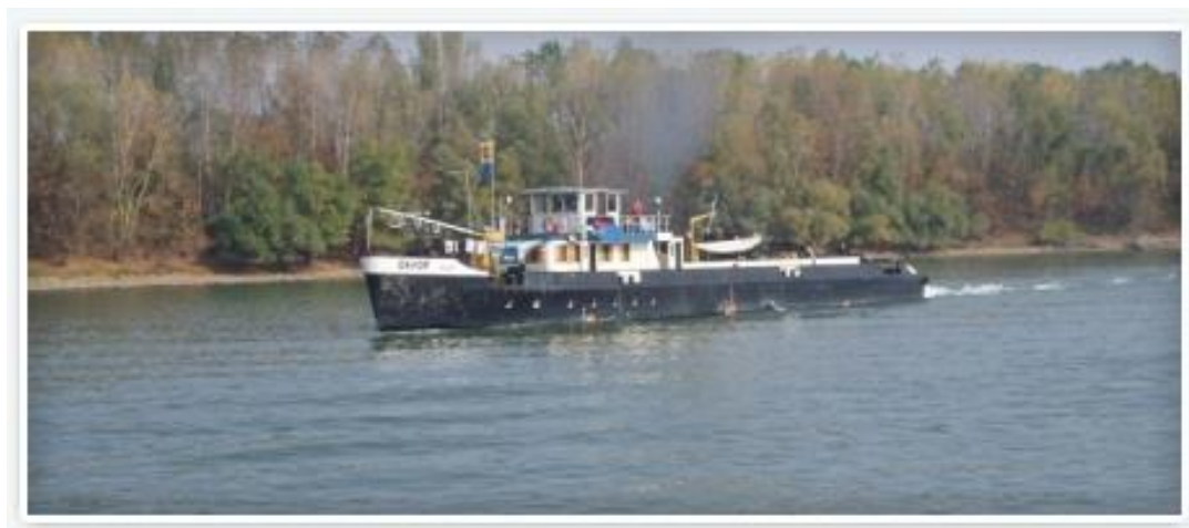
Slika 25: Dunavski Lloyd – Sisak d.o.o.

Dunavski Lloyd nastavlja dugu tradiciju riječnog brodarstva u Sisku koji je od svog nastanka prije dvadesetčetiri stoljeća uvijek bio značajan centar razvoja riječnog brodarstva. Okružen rijekama ,Sisak je bio prirodno pogodan da se razvije u značajnu riječnu luku,a zapisano je da je bio sjedište rimske riječne flotile u vrijeme Rimskog Carstva.