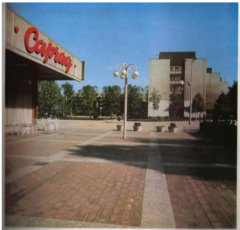
Slika 11: Glavni trg u naselju Caprag, nekoć Lenjinov