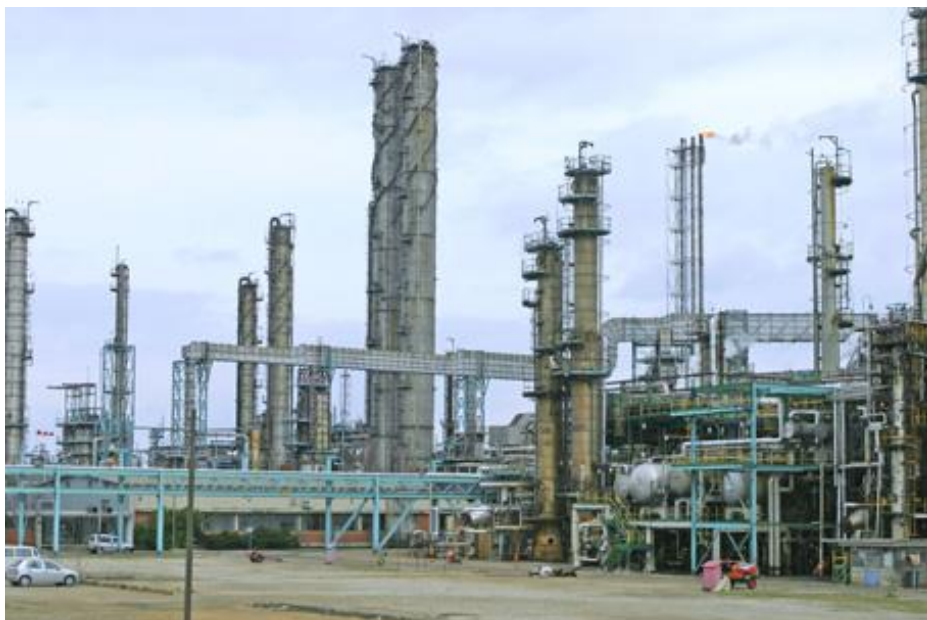
Slika 14: Rafinerija nafte u Sisku

Rafinerija nafte Sisak nalazi se u dijelu grada koji se zove Caprag, uz desnu obalu Kupe, u blizini njenog utoka u Savu. Dio je poslovnog sustava INA - Industrija nafte, a godišnje je mogla preraditi oko 4 milijuna tona nafte. Danas prerađuje oko 2 milijuna tona nafte. Rafinerija koristi izuzetno povoljan geostrateški položaj Siska, transportne putove, plovne rijeke i naftovod. Prvih godina 21. stoljeća vode se intenzivni pregovori između grada i Rafinerije o zaštiti okoliša, a osobito o smanjenju zagađenja zraka.