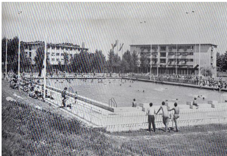
Slika 8: Prvi sisački bazen izgradili su radnici u slobodnoj vrijeme / foto: Monografija Željezara