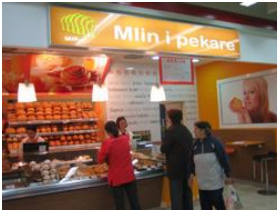
Slika 24: Mlin i pekare – prodajno mjesto