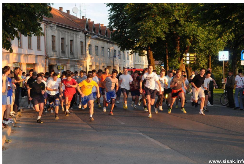
Slika 7: Svjetski dan sporta u Sisku koji se obilježava svake godine zadnje srijede u svibnju

Ukupan sportski život odvija se na sportskim objektima koji su u sastavu Sportsko-rekreacijskog centra "Sisak", gradskom nogometnom stadionu, zatvorenom olimpijskom bazenu s dvoranskim prostorima, otvorenom klizalištu, četverostaznoj automatskoj kuglani, te objektima koji su izvan športske ustanove, nogometnom stadionu "Metalac", športskoj dvorani "Brezovica", kao i otvorenim i zatvorenim športskim terenima poduzeća za sportsku djelatnost "Silax" d.d. i športskim dvoranama.