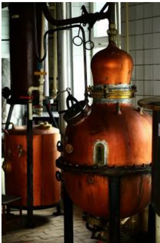
Slika 18: Stari tank za maceraciju