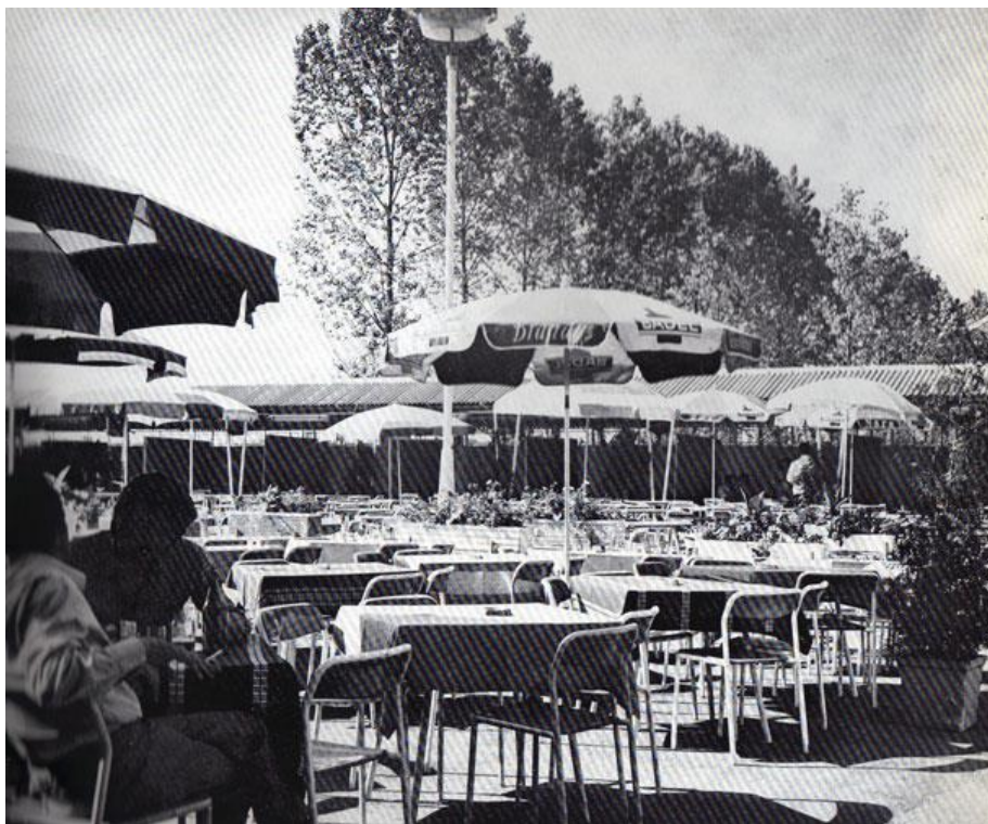
Slika 10: Terasa „Metalac“ na kojoj su nastupale jugoslavenske zvijezde