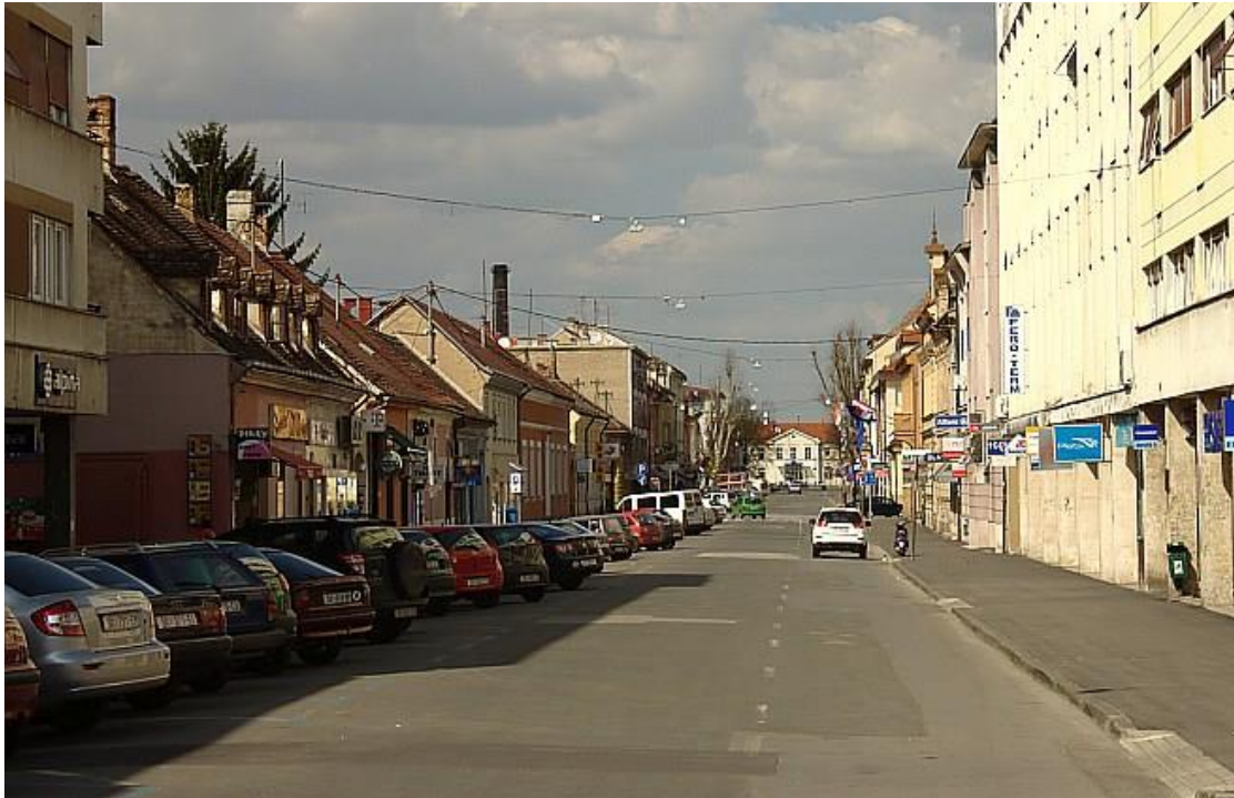
Slika 2: Sisak - grad na umoru