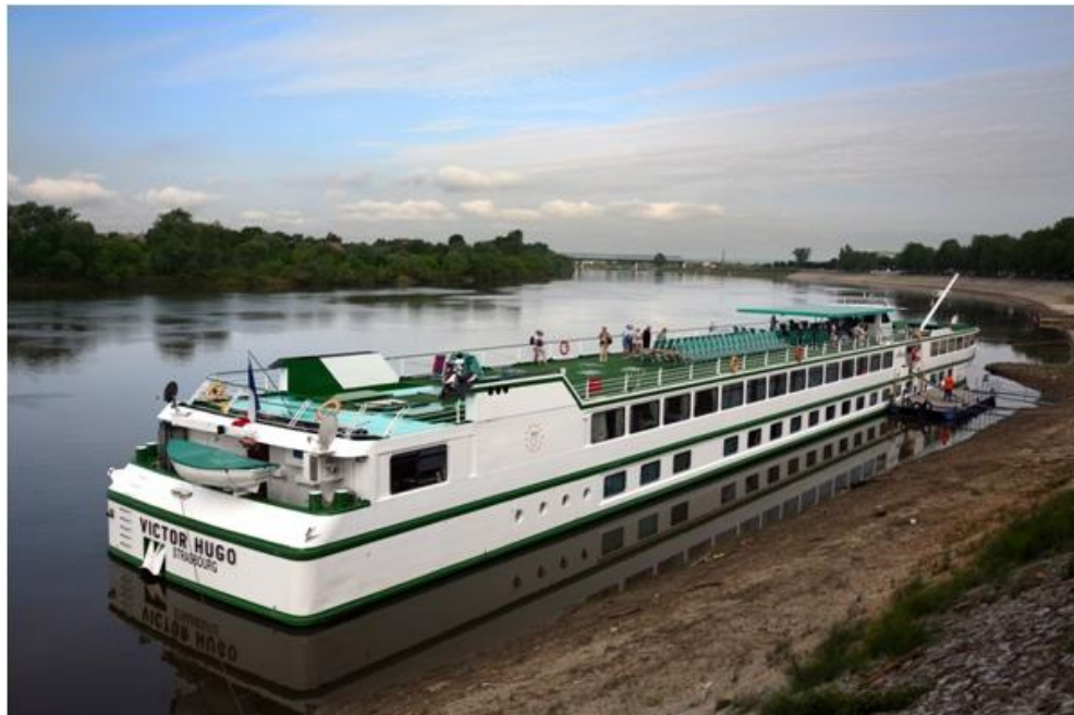
Slika 4: Luka u Sisku

Tijekom 18. i 19. stoljeća u Sisku uz obalu Kupe počinju rasti žitna skladišta, ali i ostale trgovačke zgrade, koje će bitno odrediti izgled i današnjeg grada. Trgovci su se međusobno natjecali, ne izgledom svojih kuća, nego izgledom i kvalitetom gradnje skladišta, te će ona postati gotovo statusni simbol. Tek će se nakon toga misliti na izgradnju gradskih palača, a grade ih opet imućni trgovci koji su u svemu imali odlučujuću ulogu u gradu. U gradu se povećava i broj gostionica i svratišta. Izgrađena je i puštena u promet prva željeznička pruga u Hrvatskoj, koja je povezivala Sisak i Zidani Most, a suodnos riječnog i željezničkog prometa postaje pretpostavka snažnog industrijskog razvoja grada. Glavne grane grada Siska su metalurška, naftna, kemijska, prehrambena i drvna industrija. Veliku važnost ima sisačka luka.