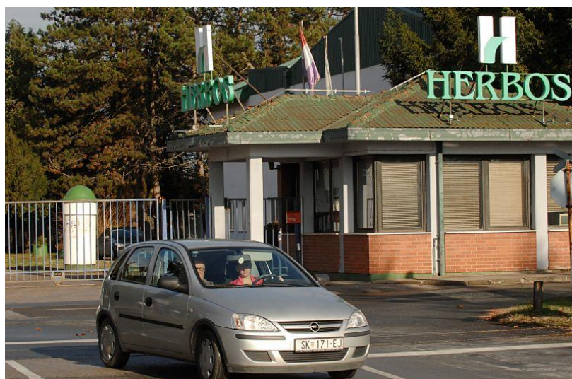
Slika 20: Tvrtka Herbos d.d. – tvornica kemijskih proizvoda

Jedan od vrijednijih pogona Herbosa je nova spalionica opasnog otpada, za koju i danas postoji zanimanje. Međutim, spalionica je imala dozvole samo za spaljivanje vlastite onečišćene ambalaže pa je zbog sumnje da noću spaljuje i tuđi otpad svojedobno bilo mnogo polemike i prosvjeda.