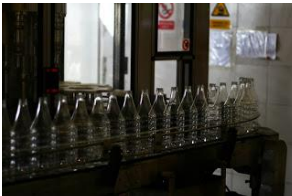
Slika 19: Detalj iz punionice boca