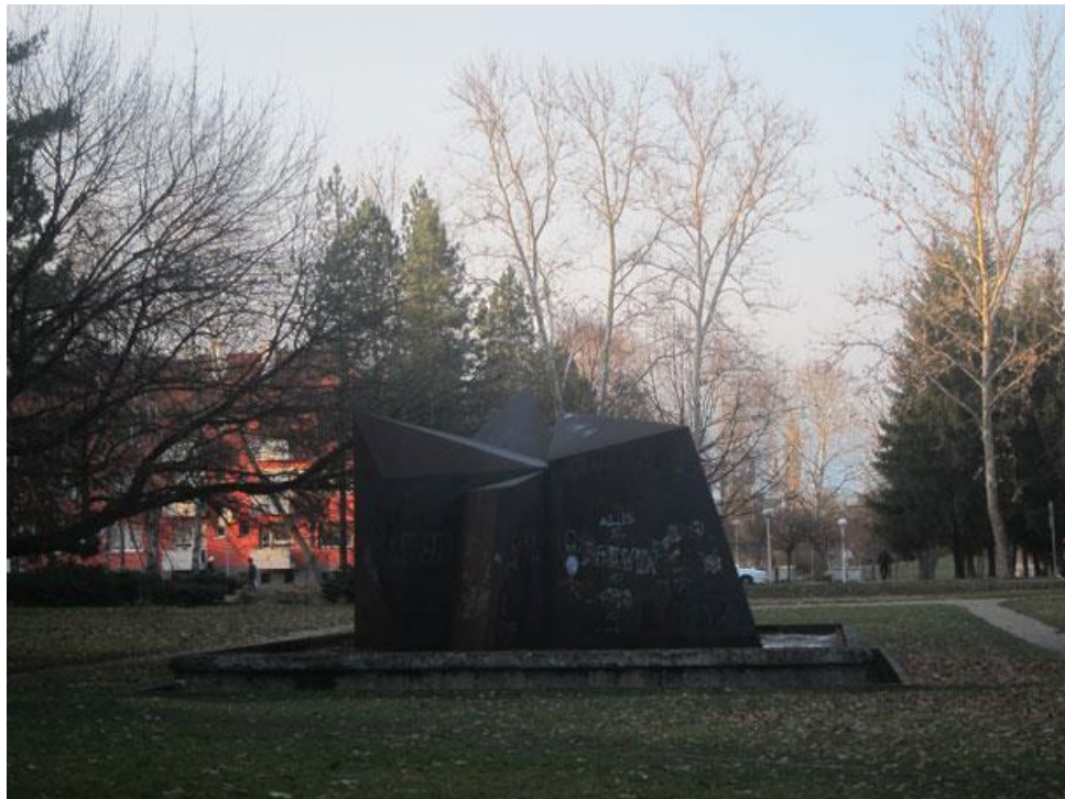
Slika 13: Džamonjina „Kardeljeva zvijezda“