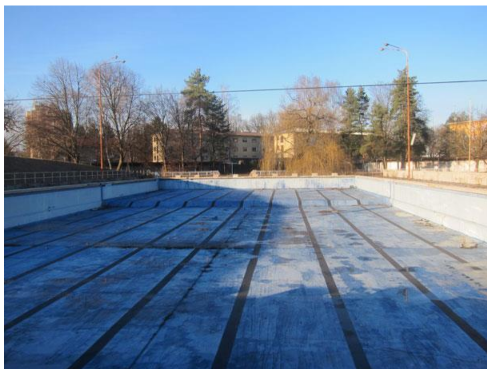
Slika 9: Bazen danas – privatiziran i zatvoren