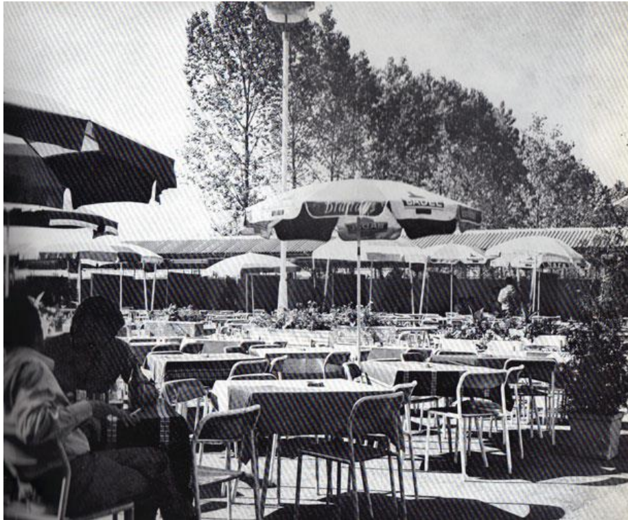
Slika 10: Terasa „Metalac“ na kojoj su nastupale jugoslavenske zvijezde