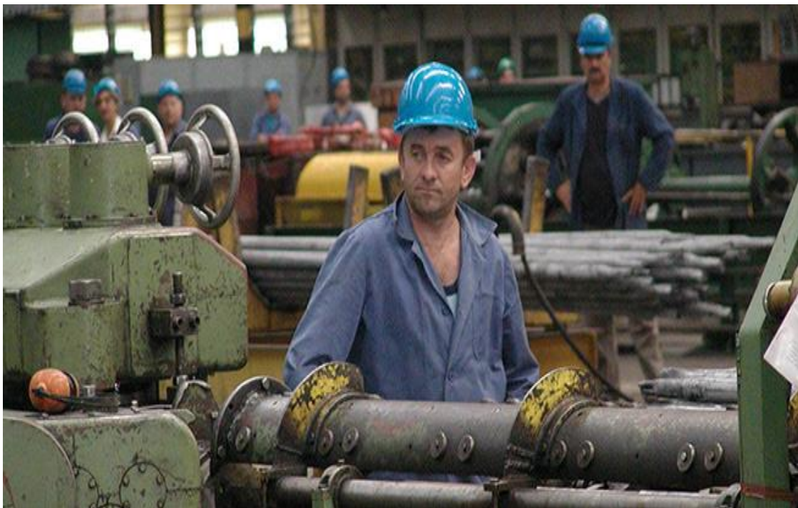
Slika 15: Željezara Sisak

Željezara Sisak bila je jezgra razvoja. Nacionalizacijom tvornice stvoreni su uvjeti za planski razvoj postrojenja i stvaranje metalurškog giganta koji je po proizvodnji proizvoda na bazi željeza bio treći u Jugoslaviji. Do 60-ih godina podignute su nova visoka peć, valjaonica, ljevaonica, čeličana i energana čime su se uz, sirovo željezo, stekli uvjeti za proizvodnju odljevaka od sirovog čelika Siemens-Martinovim postupkom, bešavnih cijevi, valjanih traka, gredica i šavnih cijevi. Liberalizacijom tržišta krajem 60-ih godina počinju prvi problemi za sisačku željezaru. Počinje nekontrolirani uvoz sirovina i čeličnih proizvoda čime se smanjuje značaj Željezare. Uspostavljanjem tržišnih odnosa počelo se s uvođenjem kapitalizma i stvaranjem nejednakosti. Tako su se domaće firme, iako formalno u rukama radnika, počele međusobno natjecati i poslovati po kapitalističkoj logici što bilo je suprotno interesima radničke klase. Posljedice po Željezaru bile su sljedeće: poslovanje ispod obujma očekivane proizvodnje, orijentacija na strana tržišta, otežano poslovanje na domaćem tržištu i tehnološko zaostajanje jer se nikada nije krenulo u treću fazu modernizacije Željezare za što su planovi postojali još od 70-ih. Unatoč krizi najveći obujam proizvodnje bio je krajem 80-ih te tada Željezara zapošljava i rekordnih 13 742 ljudi.