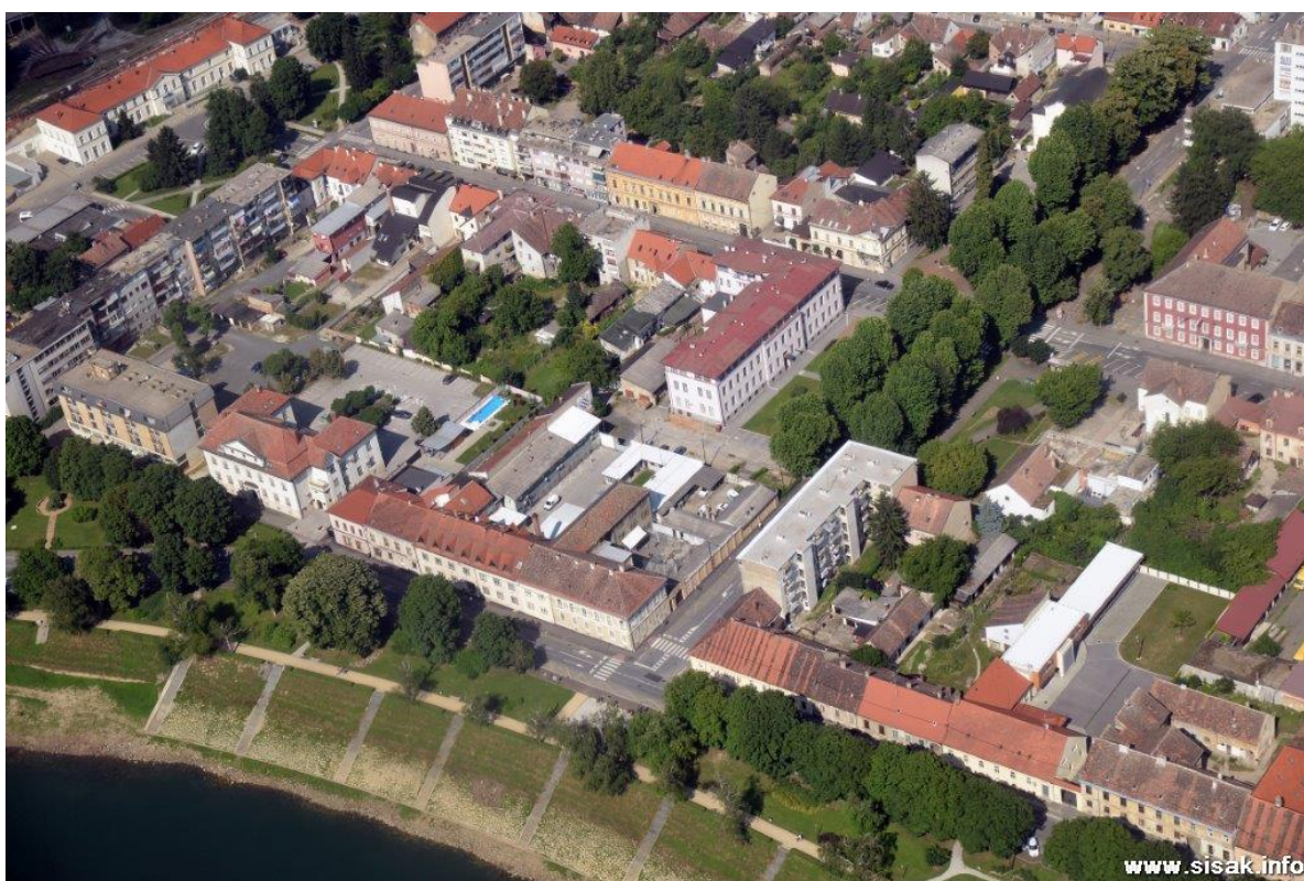
Slika 31: Sisak iz zraka