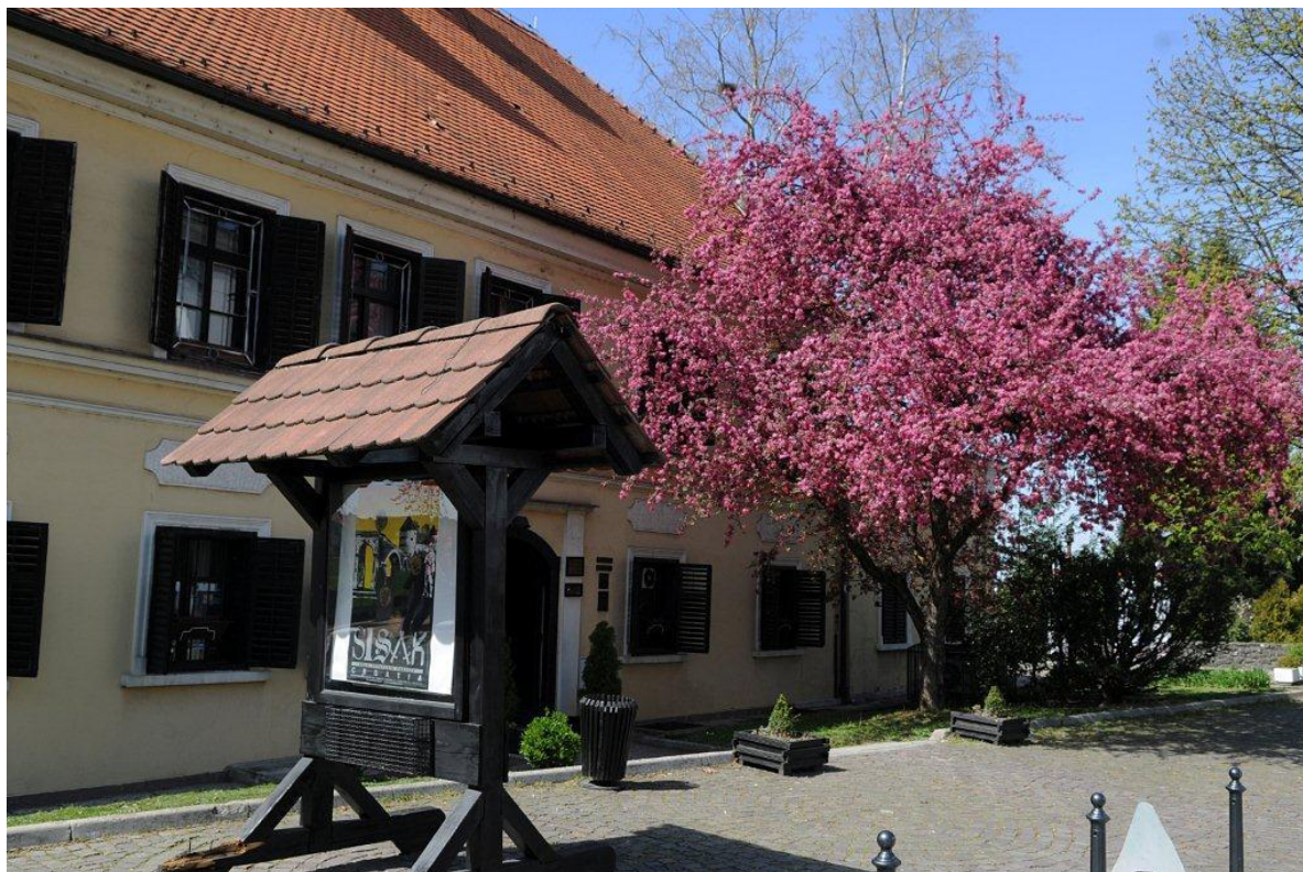
Slika 5: Turistička zajednica grada Siska