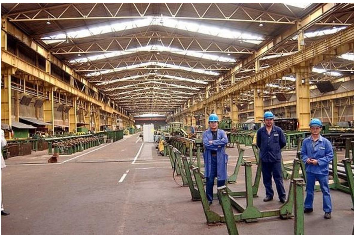
Slika 1: Željezara - slomljeni stup sisačke privrede

Za početak, valja nam se vratiti u ne tako davnu prošlost, u godine koje su prethodile ratu i tranziciji. Prema podacima objavljenim u znanstvenom radu sveučilišnog profesora Zdenka Braičića 8 , na području općine Sisak 1990. godine ukupan broj zaposlenih kretao se oko 30.000. Grad Sisak u to vrijeme imao je 61.413 stanovnika.