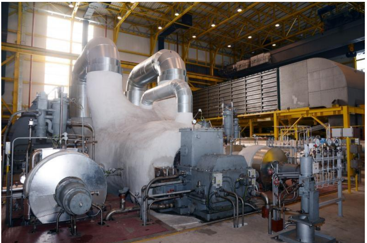
Slika 22: Termoelektrana Sisak