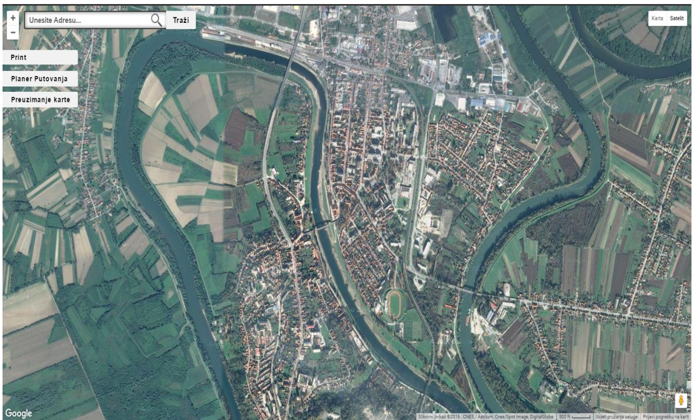
Slika 29: Satelitski prikaz grada Siska