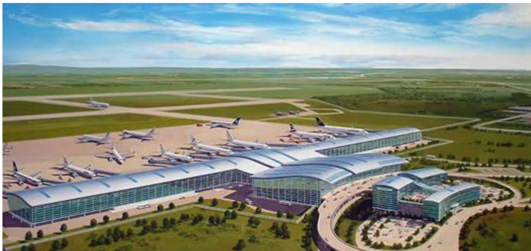
Slika 28: Zračna luka "Pleso"

Potrebe Grada Siska za daljinskim zračnim prometom u potpunosti zadovoljava najveća hrvatska zračna luka "Pleso" kod Velike Gorice koja je od Siska udaljena samo 50 km.