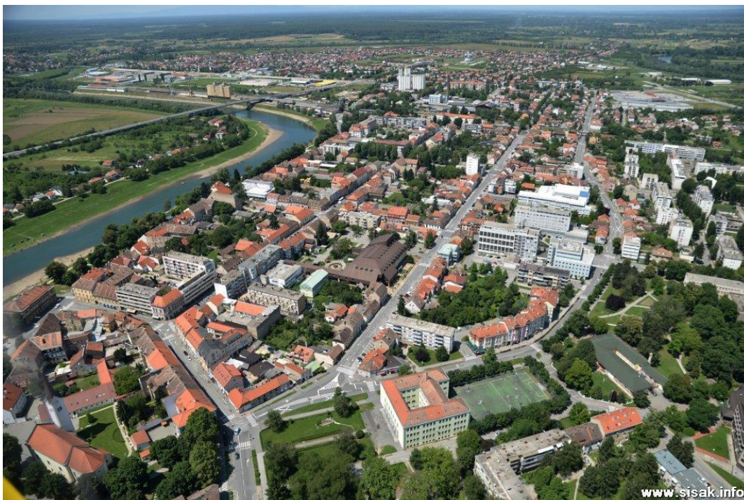
Slika 30: Sisak iz zraka