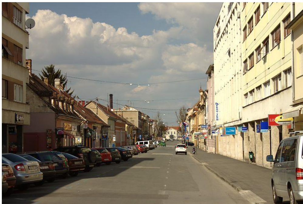
Slika 26: Zona mirnog prometa u dijelu ulice A. i S. Radica

“Prometnom studijom užeg područja grada Siska” predložen je sistem regulacije prometa u gradskom središtu koji ostvaruje mogućnosti za proširenje zone ograničenja dinamičkog motornog prometa. Predviđa se povezivanje pješačkim vezama svih glavnih točaka u gradu koje predstavljaju izvore i ciljeve pješačkoga prometa. Cilj planiranja pješačkih veza jest stvaranje neovisne mreže pješačkih veza, odvojenih od kolnog prometa, da bi kretanje ljudi bilo sigurnije i udobnije. Širina pješačkih staza je višekratnik širine jedne pješačke trake, koja iznosi 0,75 m, no minimalna prikladna širina staze trebala bi iznositi 1,50 m.