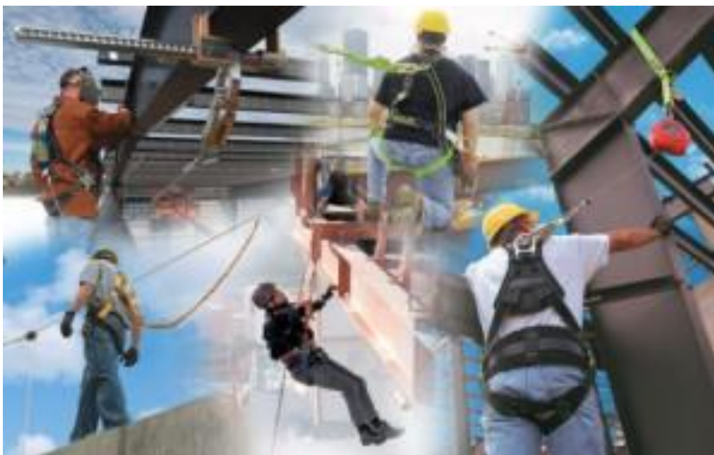
Slika 4. Zaštitni pojas

Također, prilikom podizanja oplata kranskom dizalicom, signalist odnosno vezač tereta mora posebnu pažnju obratiti na način na koji će zakvačiti oplatu. Prilikom podizanja tereta nosivo uža mora biti vortikalno u odnosu na radni pod s kojeg se teret podiže da prilikom podizanja tereta nebi došlo do nekontroliranog ljuljanja tereta te samim time može ugroziti vezača tereta te osobe koje se nalaze u blizini.