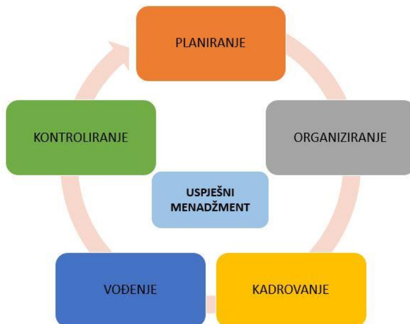
Shematski prikaz 2.: Temeljne funkcije menadžmenta

Menadžment također predstavlja proces oblikovanja okruženja gdje pojedinci rade zajedno u skupinama i efikasno ostvaruju ciljeve. Menadžment, kao i druge profesije, čini specifičnu diskursnu zajednicu, grupu koja posjeduje zajedničke društvene norme i slična pravila uporabe jezika. 18