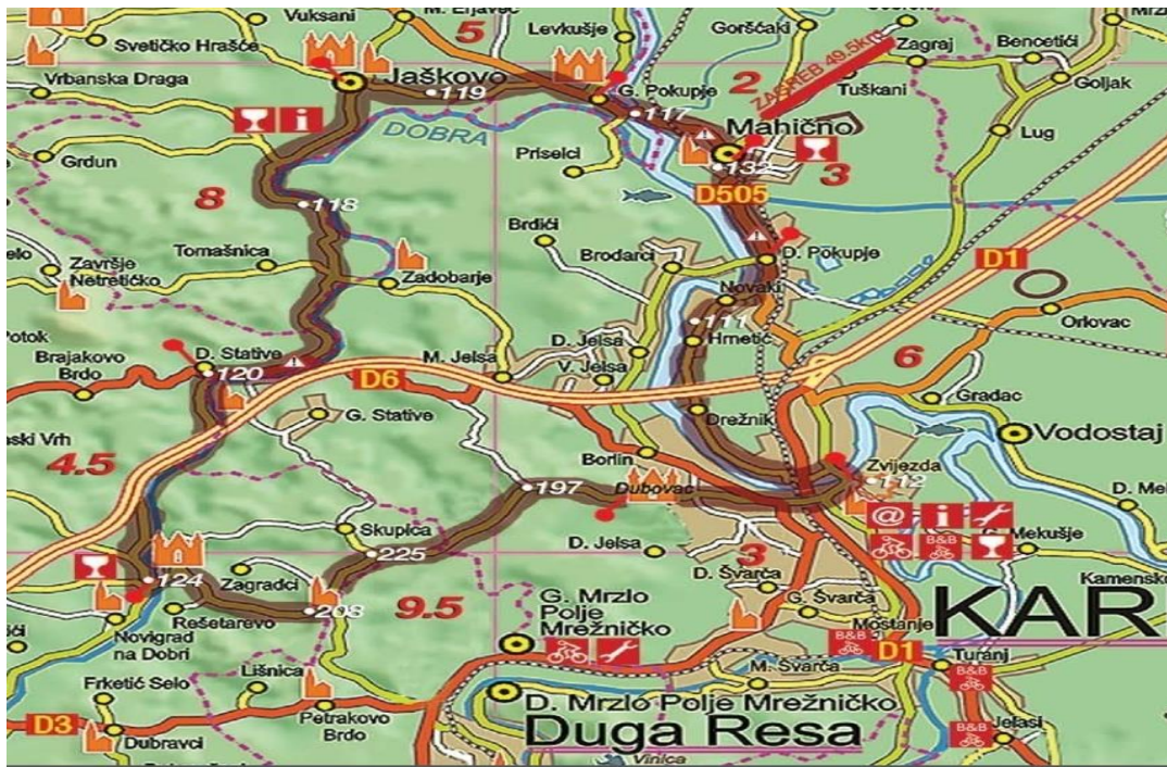
Slika 5. Biciklistička ruta Karlovac