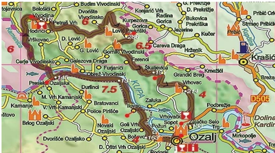
Slika 7. Biciklistička ruta Ozalj