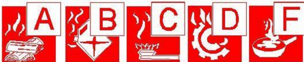
Slika 1: Piktogram razreda požara [1]

Hrvatska norma HRN EN 2 iz 2013. godine koja je usklađena sa europskom normom EN 2, razvrstava požare u skladu s prirodom gorive tvari. Takva podjela posebno je značajna radi primjene odgovarajućih aparata za gašenje požara. Požarni razredi određeni su slovnim oznakom (slika 1):