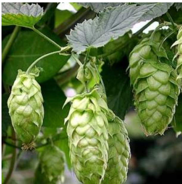
Slika 3. Hmelj

Hmelj je višegodišnja dvodomna biljka penjačica, koja izraste i do osam metara (slika 3). Prašnički cvjetovi razvijaju se u visećim metlicama na muškim biljkama, a ženski u jajastim resama – češerima na ženskim biljkama. U proizvodnji piva koriste se samo neoplođeni, djevičanski ženski cvjetovi. Češeri hmelja sadržavaju lupulinska zrnca, bogata eteričnim uljima, tanin i hmeljne smole. Najvažnije su meke hmeljne smole, koje sadržavaju \alpha i \beta hmeljne kiseline ( \alpha kiselina zove se humulon, a \beta kiselina lupulon). Nakon žetve u rujnu, hmelj se suši i tada je kao „prirodni hmelj“ spreman za uporabu. Može se upotrijebiti mljeven ili prešan (peletizirani hmelj) ili u obliku ekstrakta. Za gorkasti okus piva odgovoran je humulon. Lupulon je devet puta manje gorak od humulona, ali ima jača antiseptička svojstva. Gorke kiseline nisu topljive u vodi u svom prirodnom obliku, zato se hmelj kuha sa sladovinom, a hmeljne kiseline prelaze u izo-oblike, topljive u vodi. Gorčina piva ovisi o količini dodane gorke sorte hmelja, a njegova aroma o udjelu aromatične sorte. U pivovarama se najčešće upotrebljavaju jedna do dvije sorte hmelja (obično je jedna sorta gorka, a druga aromatična) [4].