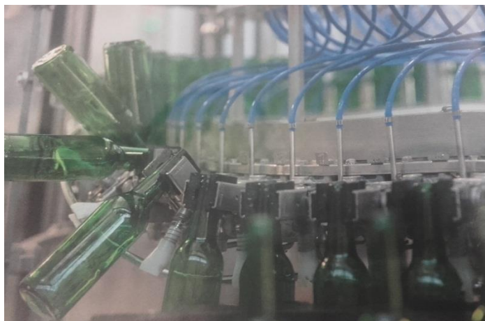
Slika 9. Ispiranje boca prije punjenja piva u tvornici „Heineken Hrvatska“