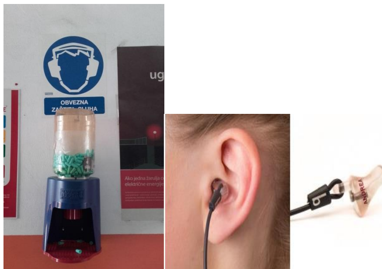
Slika 18. Čepići za jednokratnu upotrebu i akrilni čepići s vezicom

Osim zaštite očiju obavezna je i zaštita sluha. Za buku od 80 dB i više preporučeno je korištenje osobnih zaštitnih sredstava, a kod buke od 85 i više dB je obavezno. Ovisno o trajanju izloženosti i jačini buke u proizvodnom procesu koriste se zaštitni čepići za jednokratnu upotrebu i akrilni čepići s vezicom (slika 18).