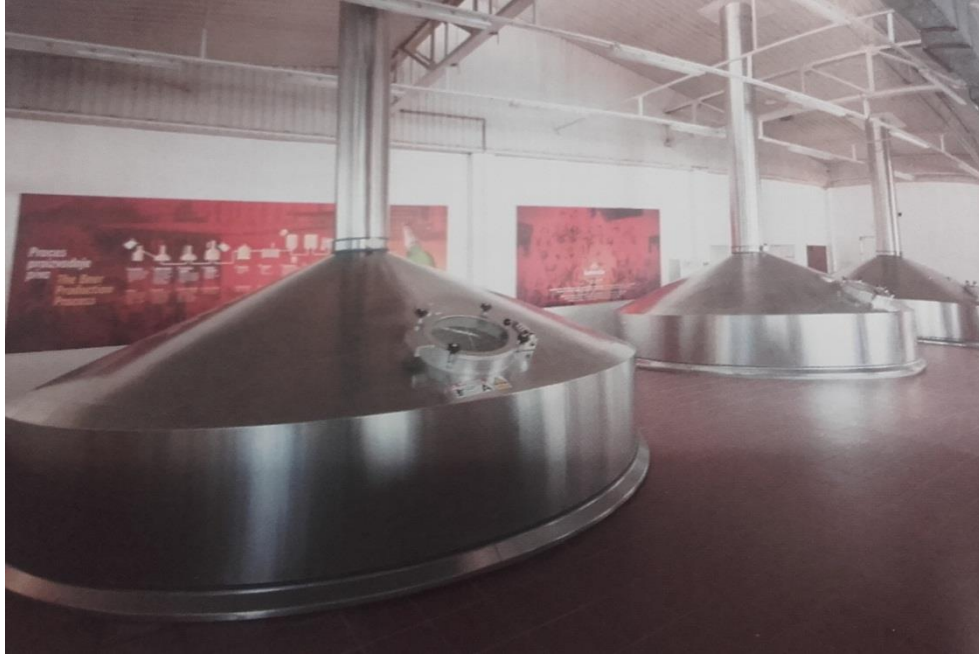
Slika 7. Kotlovi za kuhanje sladovine u tvornici „Heineken Hrvatska“

Uparavanje vode i koncentriranje sladovine na normativni udio suhe tvari tehnološki se provodi tijekom kuhanja. S obzirom na to da je uparavanje sladovine energetski zahtjevan proces, nužno se provodi uz ove uvjete: