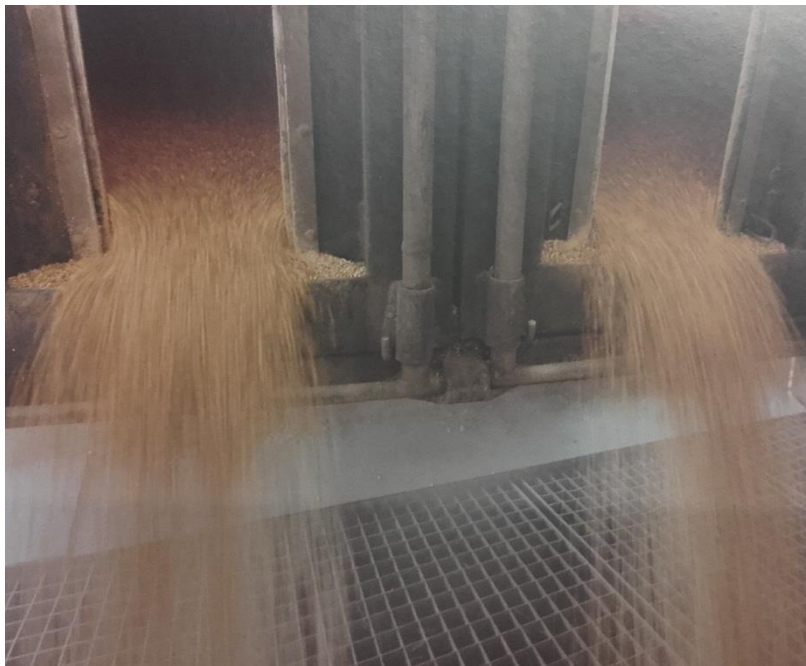
Slika 5. Istovar slada u tvornici „Heineken Hrvatska“

Slad se prije pretvorbe u sladovinu usitnjava, što tijekom ukomljavanja omogućuje provođenje netopljivih dijelova slada u vodotopljive te kvalitetnu enzimsku hidrolizu (slika 5).