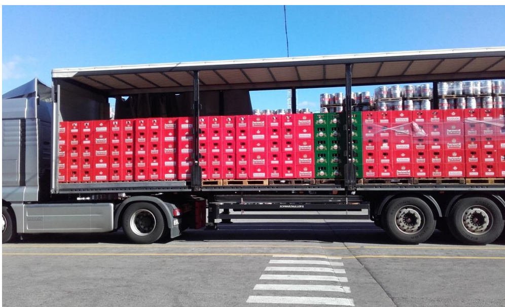
Slika 12. Distribucija proizvoda kamionom

Posljednja faza u procesu proizvodnje je distribucija, odnosno transport gotovog proizvoda do krajnjeg potrošača. Paleta se po potrebi, ovisno o ambalaži podvrgavaju tzv. „stretchiranju“ pomoću stretch folije. Stretchiranje se u prvom redu radi kako bi proizvod i ambalaža u kojoj se nalazi proizvod stigli do potrošača neoštećeni, te kako bi proizvod bio zaštićen od prašine i vlage [10]. Tako stretchirana paleta prevozi se viličarem do kamiona (slika 12), te kamion prevozi gotovi proizvod dalje do krajnjeg potrošača.