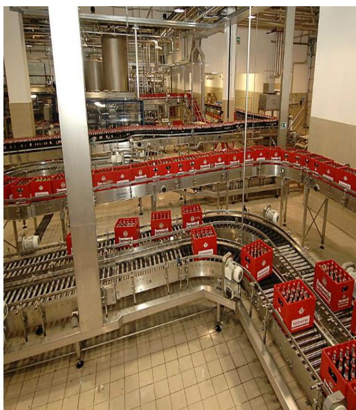
Slika 11. Ambalažiranje piva u nosiljke

Diferencijalno-tlačni uređaji rastaču pivo na načelu razlike tlakova u stroju za punjenje i boci. Nakon punjenja boce se što je moguće brže zatvaraju. Obično stroj za punjenje i zatvaranje čini blok sa zajedničnim pogonom kako bi se osigurao sinkronizirani rad. Nakon punjenja, a prije zatvaranja boca u njima se vodenim mlazom visokog tlaka pobuđuje pjena kako bi se „head-space“ prostor prije zatvaranja ispunio pjenom. Boca se najčešće zatvara krunskim zatvaračem s 21 zupcem, koji se u položaj zatvaranja dovodi pneumatskim ili mehaničko-magnetskim transportom. Etiketiranje je tehnološka operacija koja uvjetuje kvalitetu vizualnog identiteta pa se posebna pozornost pridaje kvaliteti izrade i skladištenja prednje, stražnje i vratne etikete, vratnih folija na nepovratnoj boci te kvaliteti i nanosu ljepila. Rok trajanja utiskuje se na etiketu ink jetom ili laserskom tehnologijom. Na kraju procesa punjenja boce se ambalažiraju u nosiljke, a nosiljke se strojno paletiziraju (slika 11).