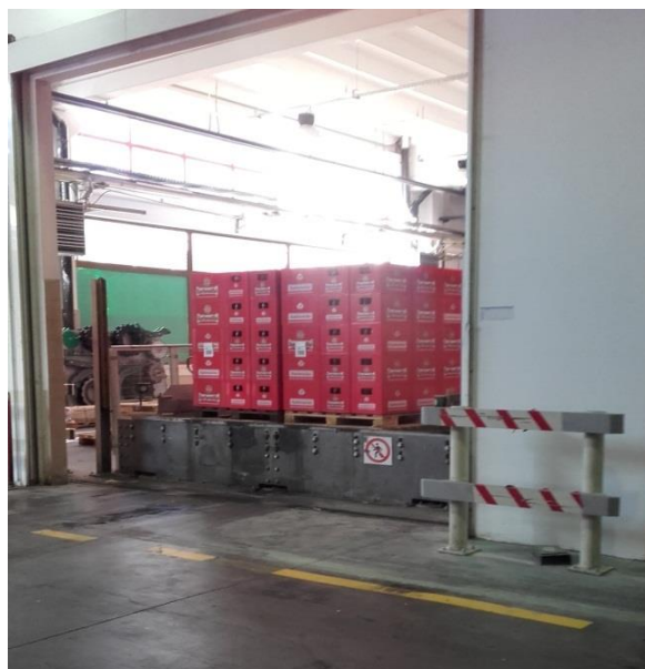
Slika 10. Gotov proizvod na paletama