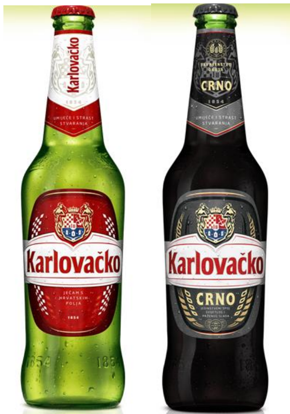
Slika 4. Svijetlo i crno pivo