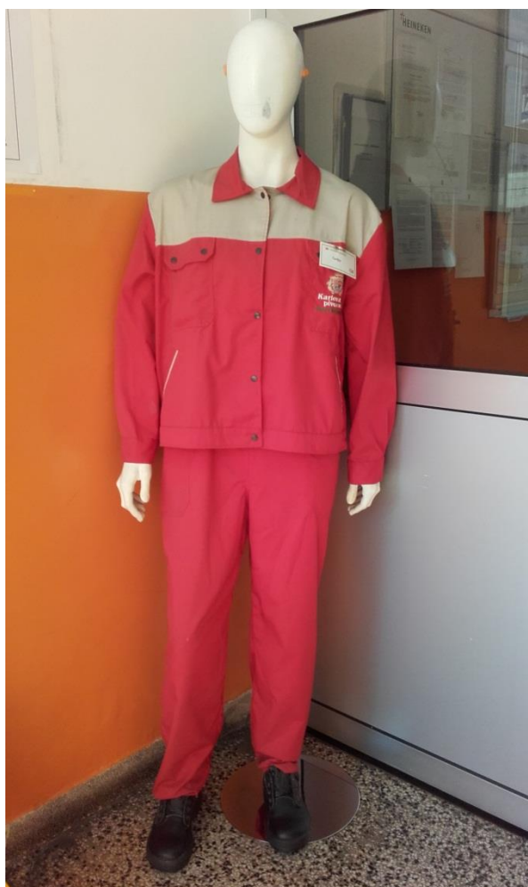
Slika 13. Osobna zaštitna sredstva

„Heineken Hrvatska“ posebnu pozornost posvećuje zaštiti radnika pa samim time i upotrebi osobnih zaštitnih sredstava prilikom rada. Minimalni zahtjev je nošenje radnog odijela i zaštitne obuće (slika 13).