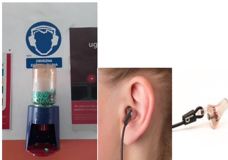
Slika 18. Čepići za jednokratnu upotrebu i akrilni čepići s vezicom

Osim zaštite očiju obavezna je i zaštita sluha. Za buku od 80 dB i više preporučeno je korištenje osobnih zaštitnih sredstava, a kod buke od 85 i više dB je obavezno. Ovisno o trajanju izloženosti i jačini buke u proizvodnom procesu koriste se zaštitni čepići za jednokratnu upotrebu i akrilni čepići s vezicom (slika 18).