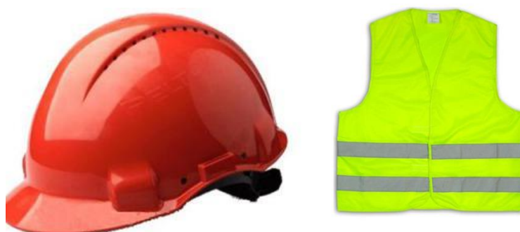
Slika 15. Zaštitna kaciga i zaštitni prsluk

Za kretanje po pješačkim stazama i svim logističkim površinama obavezna je upotreba zaštitne kacige kao i zaštitnog prsluka (slika 15).