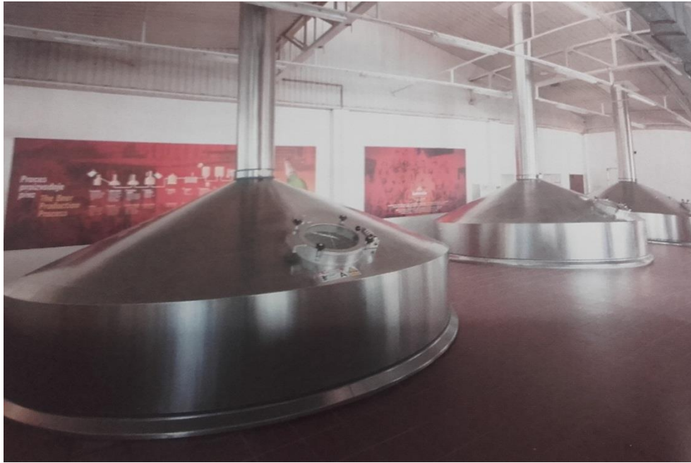
Slika 7. Kotlovi za kuhanje sladovine u tvornici „Heineken Hrvatska“

Uparavanje vode i koncentriranje sladovine na normativni udio suhe tvari tehnološki se provodi tijekom kuhanja. S obzirom na to da je uparavanje sladovine energetski zahtjevan proces, nužno se provodi uz ove uvjete: