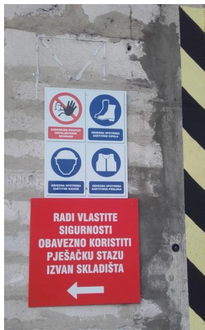
Slika 14. Znakovi zabrane i obaveze

U krugu tvornice jasno su ocrtane i ogradom zaštićene pješačke staze i strogo je zabranjeno kretati se van njih (slika 14).