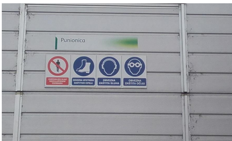
Slika 16. Znak zabrane i znakovi obaveze korištenja ozs-a

Svaki pojedini dio tehnološkog procesa (fermentacija, varionica, punionica boca,...) ispred ulaza, na vratima, ima jasno istaknuta upozorenja o obaveznom korištenju dodatnih osobnih zaštitnih sredstava, osim radnog odijela i zaštitnih cipela. Tako npr. ispred punionice boca stoji upozorenje o obaveznoj zaštiti sluha kao i o obaveznoj zaštiti očiju (slika 16).