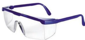
Slika 17. Zaštitne naočale sa bočnom zaštitom

Rad na liniji gdje se pune boce zahtjeva zaštitu očiju s obzirom na to da se radi sa staklom i da pasterizirana piva u boci može eksplodirati. Upravo iz tog razloga koriste se zaštitne naočale sa bočnom zaštitom (slika 17).