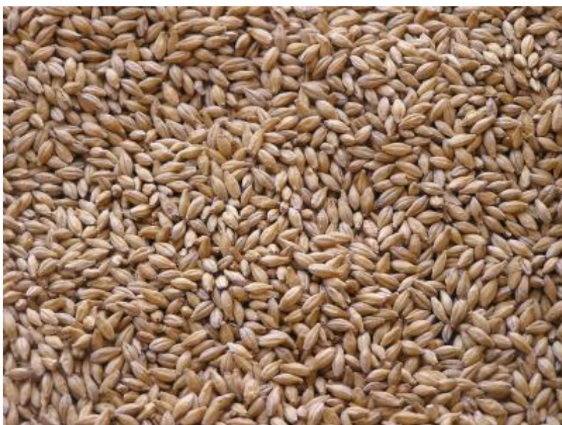
Slika 2. Slad

Ječmeni slad je osnovna sirovina za proizvodnju piva, kao što je i grožđe sirovina za vino, jer oboje preradom daju slatke tekućine, koje sadržavaju fermentirane šećere (slika 2). Za jednu litru standardnog piva (12% ekstrakta u sladovini) treba između 180 i 190 g slada, ovisno o njegovoj kakvoći i ekstraktivnosti [4]. U osnovi postoje tri glavna tipa slada: svijetli – „plzenski“, jače sušeni – „bečki“ i „bavarski“ slad koji je još jače sušen.