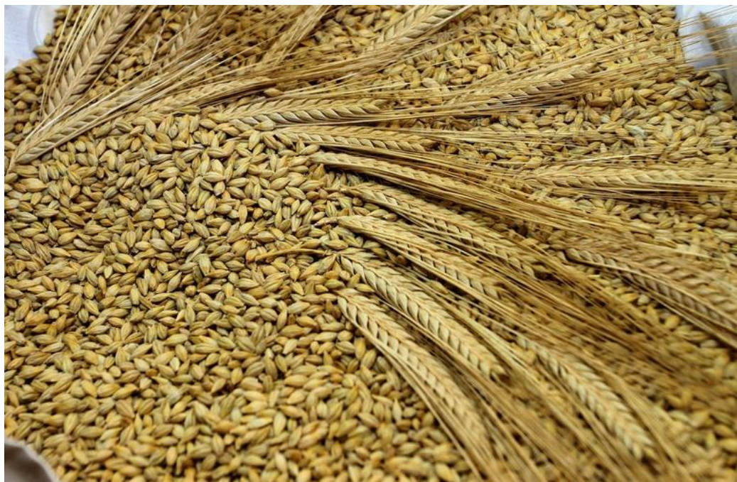
Slika 1. Ječam

Pivski ječam je žitarica poznata kao arpa, bijelo žito i ječmen te je najuniverzalnija zrnata kultura (slika 1). Uzgajana je još oko 6000 godina p.n.e. i drži se da je porijeklom sa Srednjeg istoka. U najdavnija vremena se prženo zrnje ječma podvrgavalo postupku kuhanja i vrenja, te se upotrebljavalo za proizvodnju pjenušavog pića sličnog današnjem pivu. U pivarskoj industriji se koristi pljevičarski dvoredni ječam, pretežito jarih sorti, koji je bogat škrobom i relativno siromašan bjelančevinama (do 12%) [3].