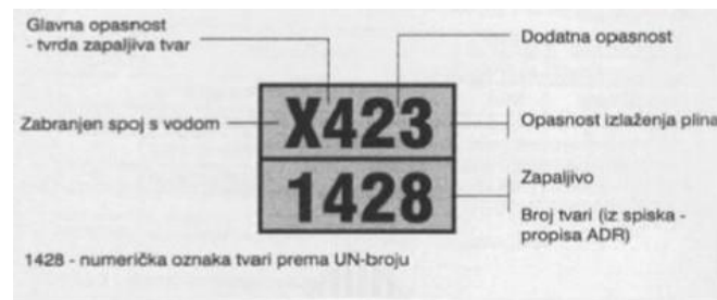
Slika 1 – Opasnost dodira ukapljenog plina sa vodom

Brzina motornog vozila koji prevozi ukapljeni plin ne smije biti veća od 70 km/h. Prema ADR-u sva vozila koja prevoze opasne tvari, pa tako i ukapljeni plin, moraju biti označena znakovima i svjetlom. Oznaka na vozilu s prednje i stražnje strane pravokutnog je oblika s narančastom svjetlećom osnovom, dimenzija 30 x 40 cm.