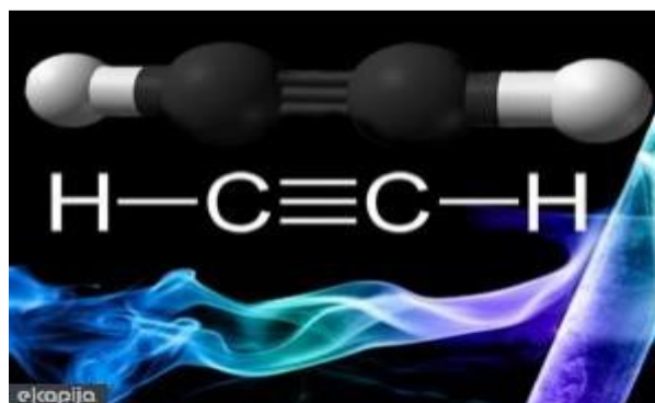
Slika 3 – Molekula acetilena

Acetilen možemo komprimirati u praznu bocu samo do 1,3 bara nadtlaka. Kod većeg tlaka plin postaje nestabilan pa kod temperature od 500-530°C dolazi do raspada acetilena na sastavne dijelove čime se oslobađa velika količina energije koja povećava temperaturu što uzrokuje eksploziju boce, budući da tlak poraste dvanaestak puta. Granice eksplozivnosti nastale smjese vrlo su široke, jer se nalaze između 1,5 – 82vol. u zraku i 2,3 – 93 vol. u kisiku. Acetilen se burno spaja s klorom i drugim halogenim elementima i to tako da se eksplozija pri ovoj reakciji izaziva već samim izlaganjem svjetlosti.