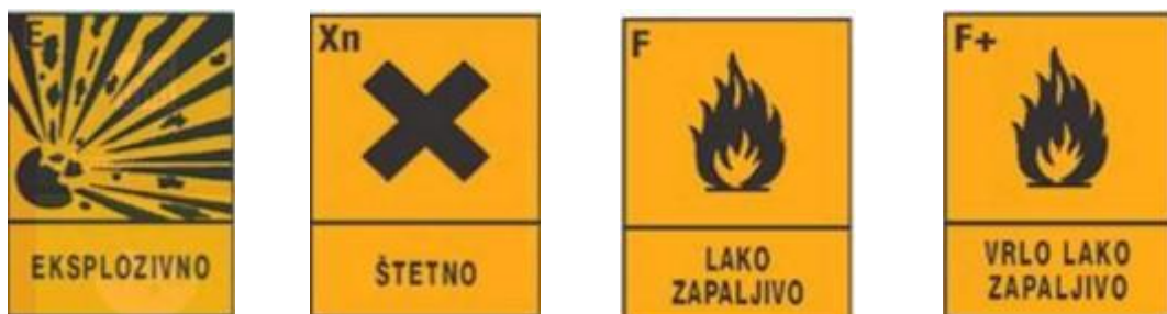
Slika 2 – Oznake koje nosi ukapljeni plin

Ukapljeni plin može na ljude i okolinu različito djelovati, a najčešće djeluje nadražajno (inhalatorni sustav), zapaljivo, eksplozivno, otrovno, zagađujući okoliš i slično.