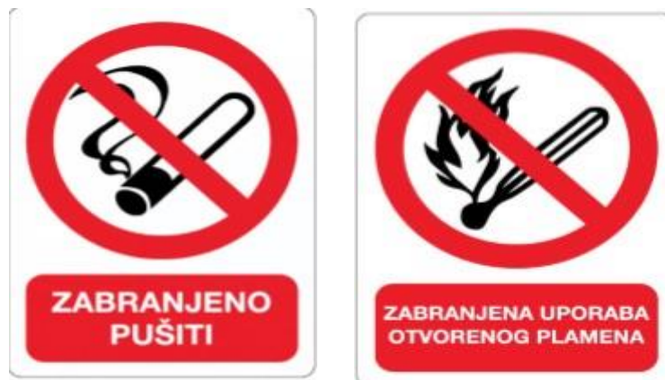
Slika 7 – Zabranjena upotreba otvorenog plamena i Zabrana pušenja

Svaki razvijač acetilena mora imati predčistač za odstranjivanje fizičkih primjesa u acetilenu. Za mjerenje tlaka u razvijaču acetilena i razvodnoj cijevnoj mreži smiju se upotrebljavati samo posebno građeni manometri. S obzirom na opasnost od eksplozije mješavine acetilena sa zrakom, potrebno je čišćenje i punjenje razvijača karbidom obavljati pri dnevnoj svjetlosti.