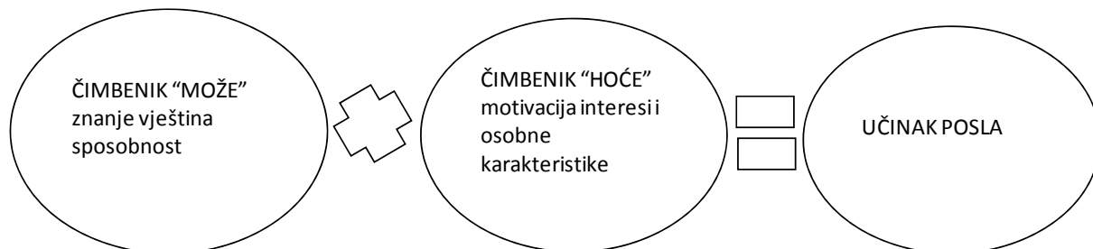
Shema 2: Čimbenici selekcije kandidata

Izvor: Cerović, Z.: Hotelski menadžment , Fakultet za turistički i hotelski menadžment Opatija, 2003.g., str.537. prema W.A.Sherman Jr., W.G.Bohlander, J.H. Churden, Managing Human Resources , South-Western Publishing Co., Cincinanti, Ohio, str.181.