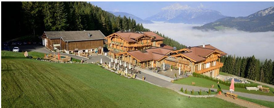
Slika broj 6. Hotel Jufenalm