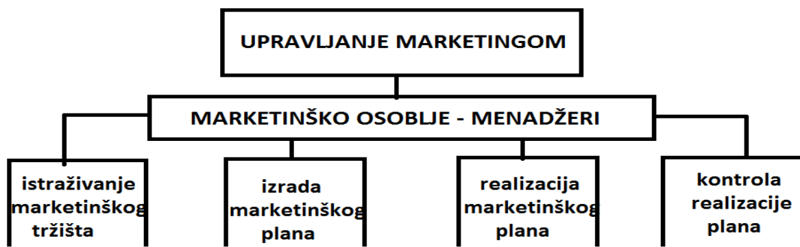
Slika broj 2. Proces upravljanja marketingom