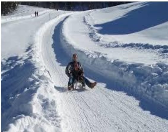
Slika broj 9. Rodelban