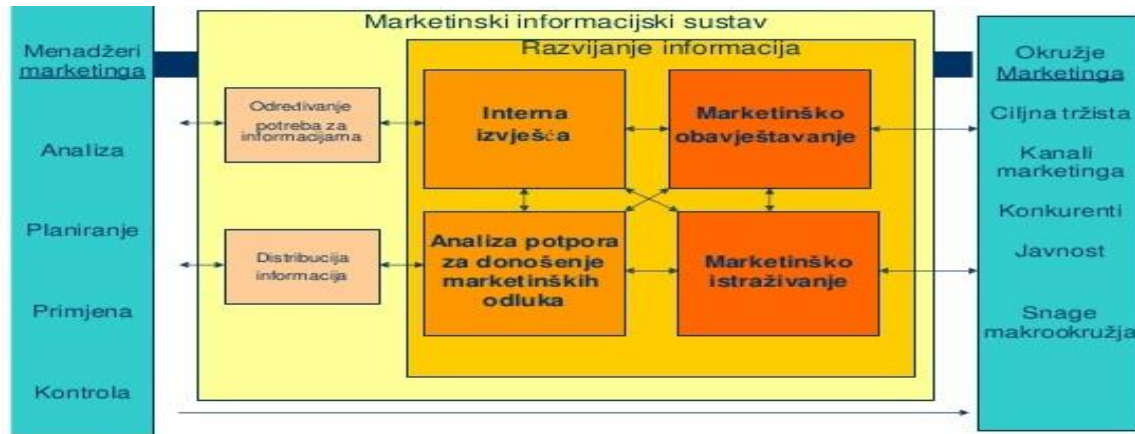
Slika broj 3. Marketinški informacijski sustav