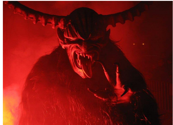
Slika broj 10. Krampuslauf