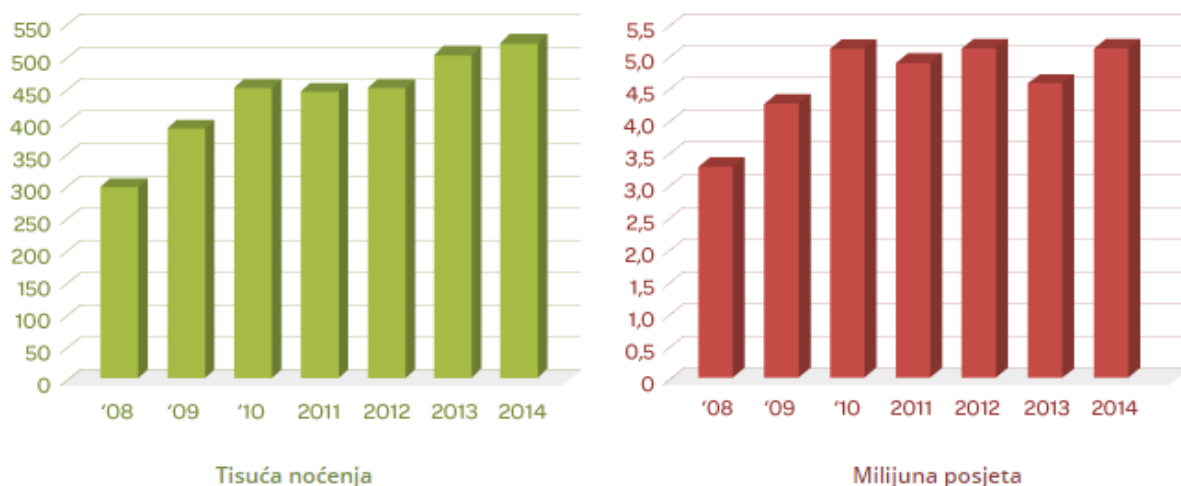
Slika 6-8. Broj posjeta stranice turističke agencije Adriatic i broj noćenja koja su ostvarena pute te agencije