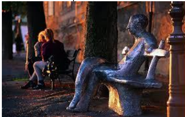
Slika 7.: Spomenik A. G. Matoša

Pod drvoredom kestena šetači u društvu pjesnika A. G. Matoša uživaju u najromantičnijoj panorami Zagreba. Iako nije rođen u Zagrebu, Antun Gustav Matoš (1873. – 1914.), jedan je od najvećih zaljubljenika u grad u kojem je odrastao. Bez dlake na jeziku piše feljtone, putopise, kritike i polemike kojima šokira i oduševljava suvremenike, a njegova lirika jedan je od najvrjednijih opusa hrvatske književnosti. Živio je boemski, najčešće sam, umro je rano i ostao zapamćen kao buntovnik i sanjar. Skulptura, djelo kipara Ivana Kožarića postavljena je na Strossmayerovo šetalište 1978. godine.