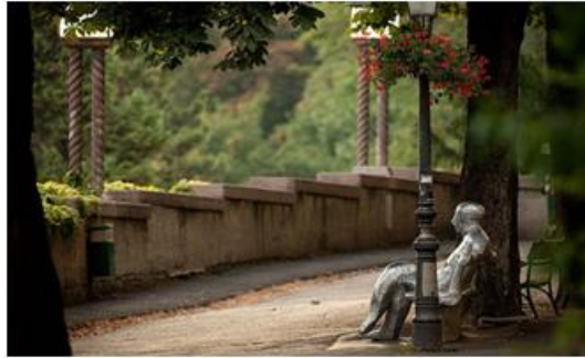
Slika 15: Strossmayerovo šetalište