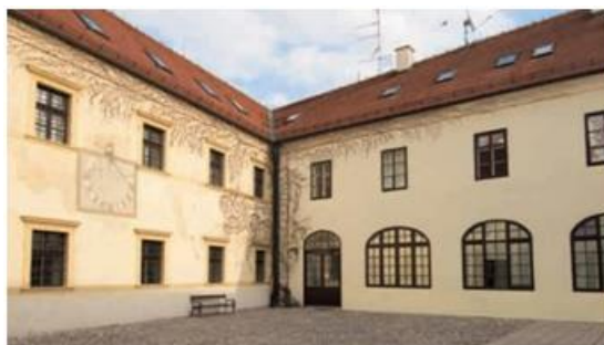
Slika 18: Muzej grada Zagreba