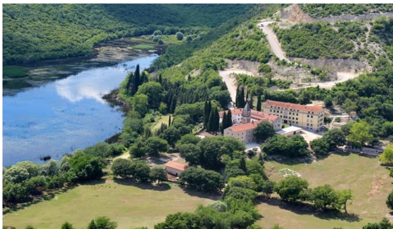
Slika 7. Manstir Krka