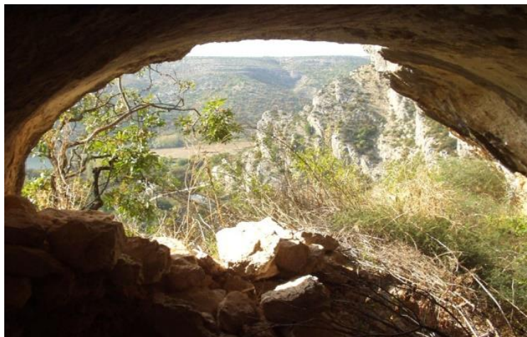
Slika 5. Ozidana pećina