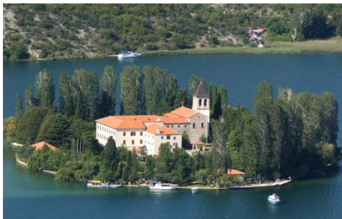
Slika 3. Otok Visovac