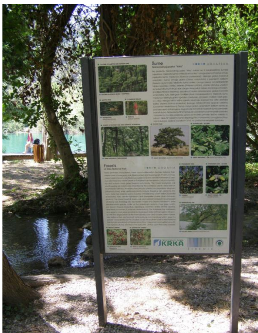
Slika 10. Edukativna tabla NP Krka