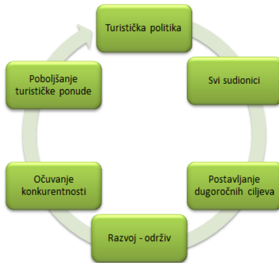
Grafikon 1. Temeljne odrednice sustava razvoja turističke politike