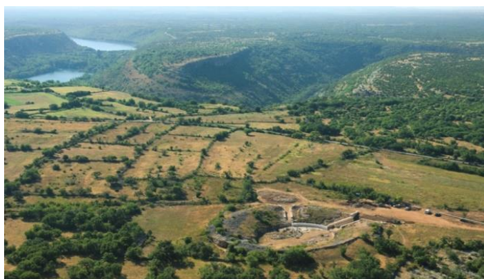
Slika 4. Arheološki lokalitet Burnum