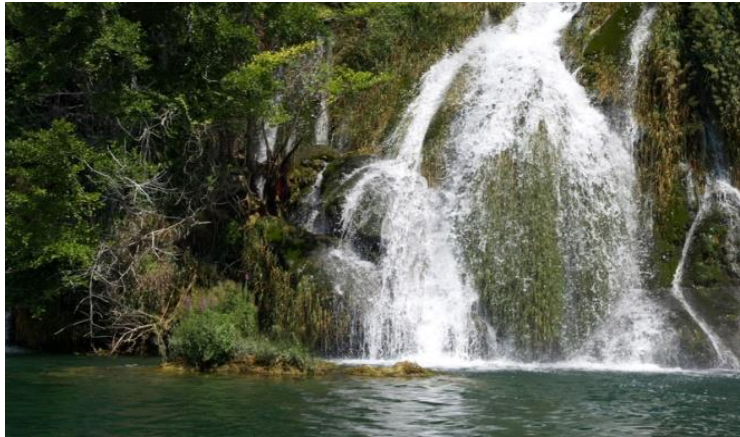
Slika 6. Roški slap