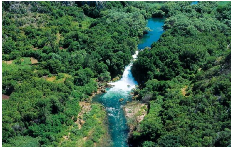
Slika 9. Bilušića buk