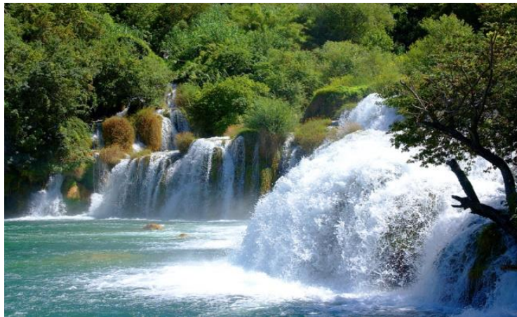
Slika 2. Skradinski buk