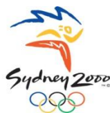
Slika 5: Logo Olimpijskih igara u Sydneyu